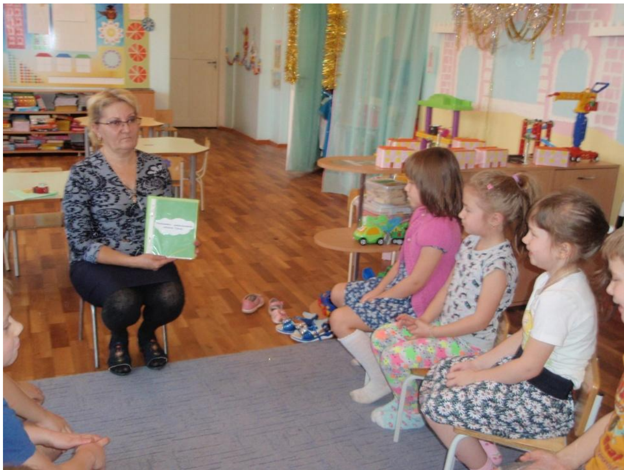
Фотоотчет о чтении сказов об Урале ( в свободное время) по программе « В стране озер и рудных скал Урала Русь отражена» в подготовительной группе.