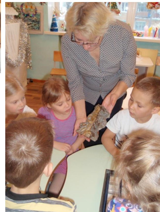
Фото-отчет о рассматривании коллекций камней и изделий из них по программе « В стране озер и рудных скал Урала Русь отражена» в подготовительной группе.