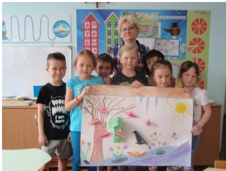
Фотоотчет о оформлении газеты «Весна на Южном Урале», используя художественное творчество и поделки из оригами по программе « В стране озер и рудных скал Урала Русь отражена» в подготовительной группе.