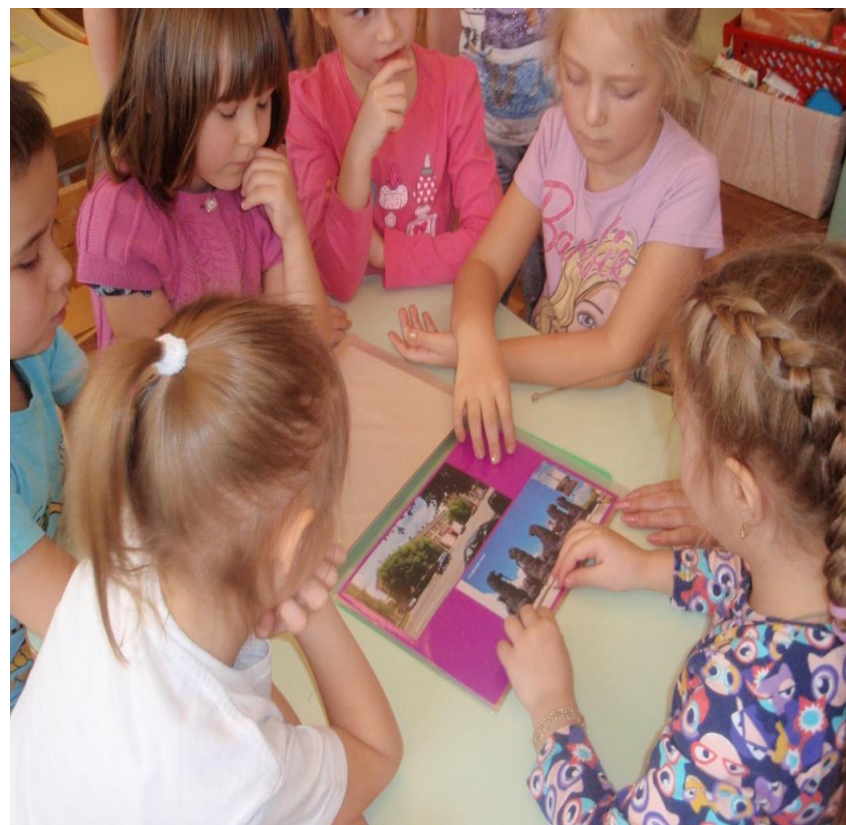
Фотоотчет о беседе «Прошлое и настоящее нашего города» по программе « В стране озер и рудных скал Урала Русь отражена» в подготовительной группе.