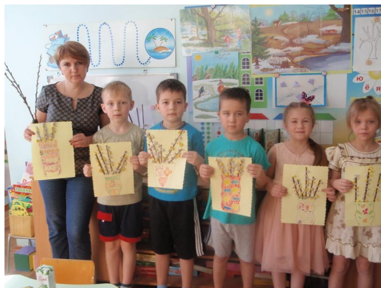
Фотоотчет о НОД «Веточка вербы» (аппликация нетрадиционной техникой) по программе « В стране озер и рудных скал Урала Русь отражена» в подготовительной группе.