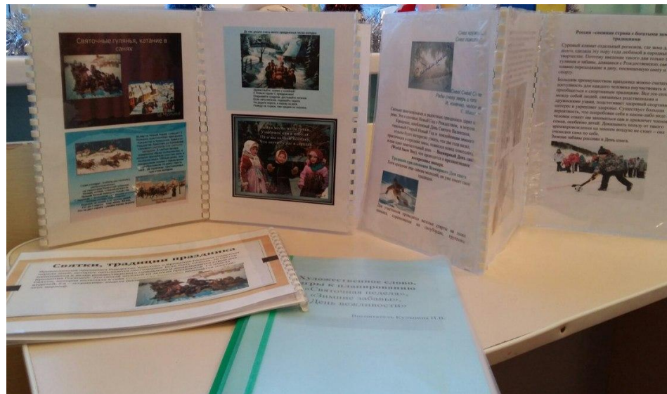
Фотоотчет о пополнении ПРПС познавательным материалом по программе « В стране озер и рудных скал Урала Русь отражена» в подготовительной группе