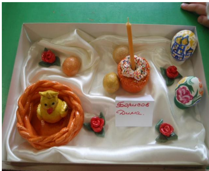
Фотоотчет о участии родителей в выставке «Великая Пасха» по программе « В стране озер и рудных скал Урала Русь отражена» в подготовительной группе.