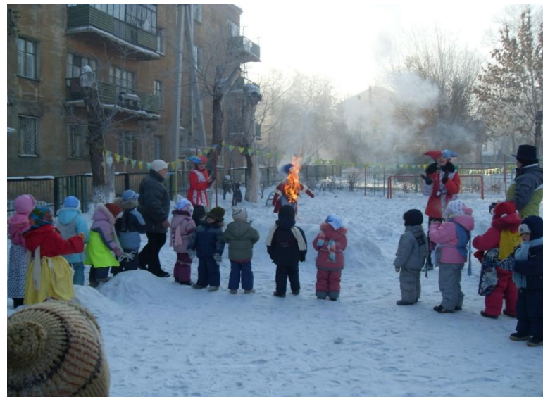
Фотоотчет о проведении праздника « Веселая Масленица » по программе « В стране озер и рудных скал Урала Русь отражена » в подготовительной группе.