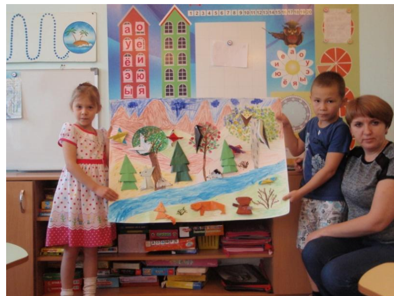
Фотоотчет о изготовлении газеты «Природа Южного Урала» по программе « В стране озер и рудных скал Урала Русь отражена» в подготовительной группе.