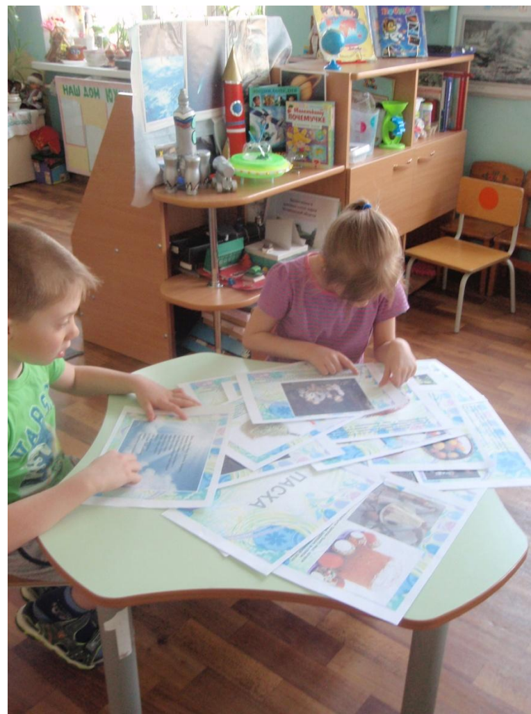
Фотоотчет о познавательной беседе «Великая Пасха» по программе « В стране озер и рудных скал Урала Русь отражена» в подготовительной группе.