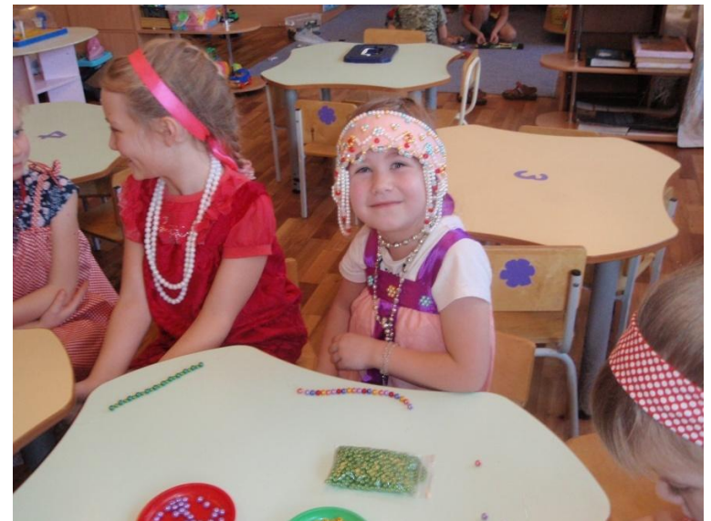
Фотоотчет о НОД по декоративно-прикладному искусству « Нарядные браслетки» по программе « В стране озер и рудных скал Урала Русь отражена» в подготовительной группе.