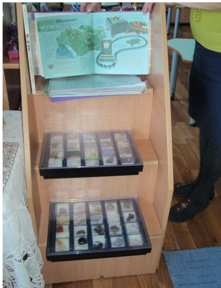
Фотоотчет о создании мини-музея камня по программе « В стране озер и рудных скал Урала Русь отражена» в подготовительной группе.