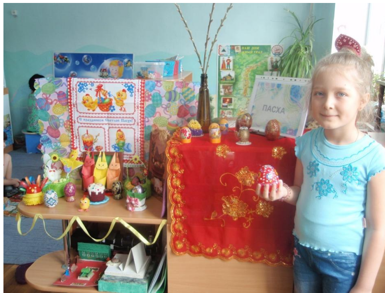
Фотоотчет о тематической выставке «Великая Пасха» по программе « В стране озер и рудных скал Урала Русь отражена» в подготовительной группе.