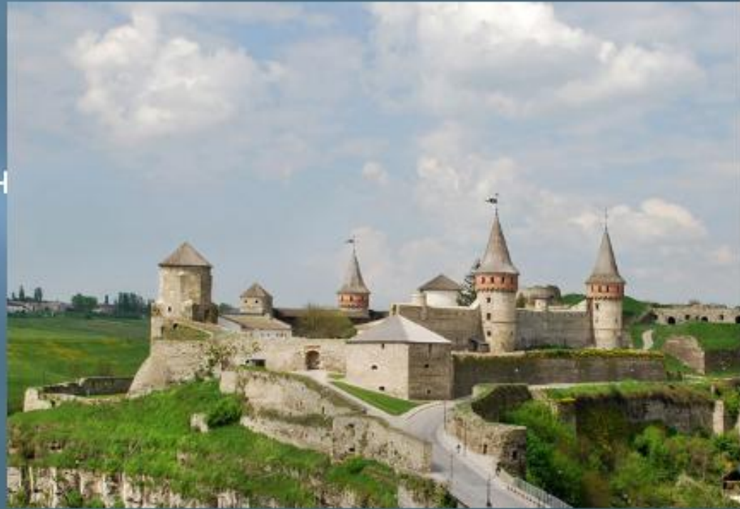
Кам'янець-Подільський. Старий Замок.