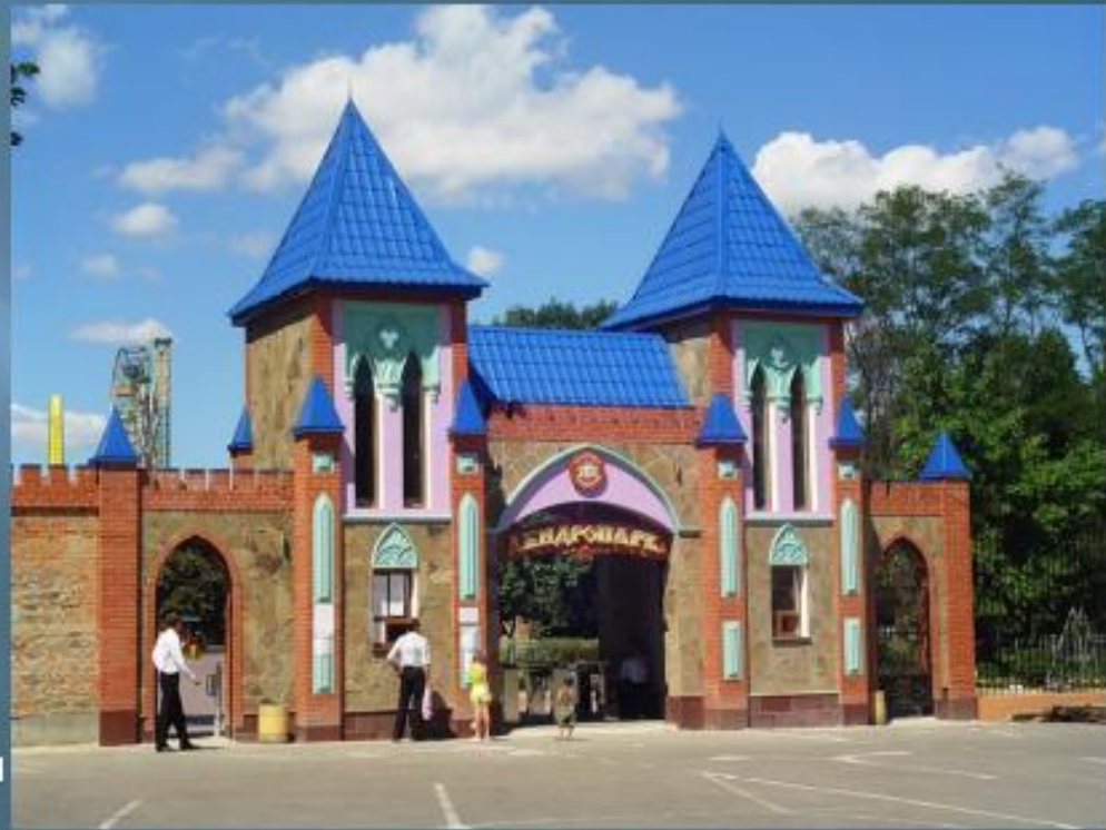
Кіровоград. Вхід до дендропарку