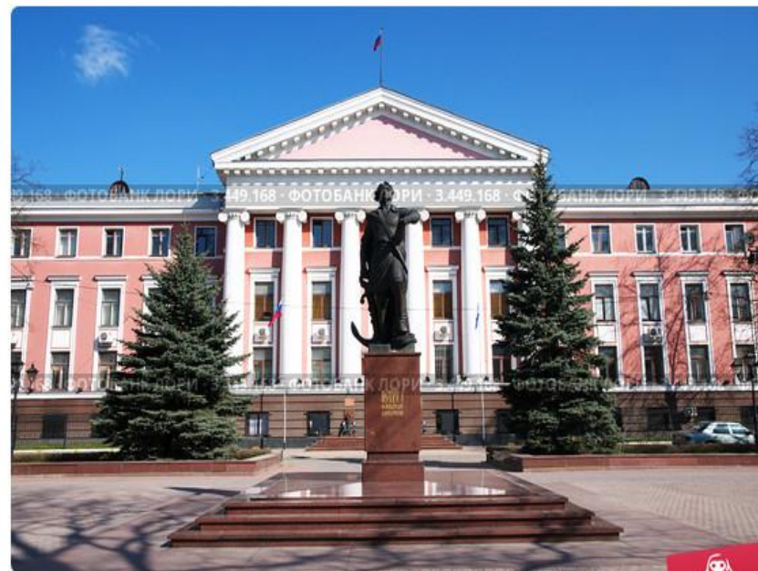
Скульптура Петра у штаба Балтийского флота. Калининград