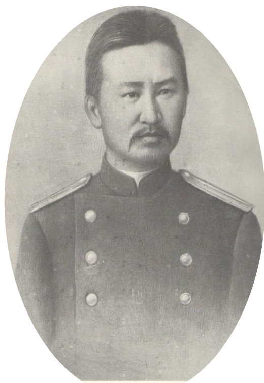
Сыртанов, 1908 ж.

1903-1907 жылдары Б.Сыртанов қазіргі Алматы, Талдықорған облыстарының Қытаймен шектесетін шекараны сақтап қалды.