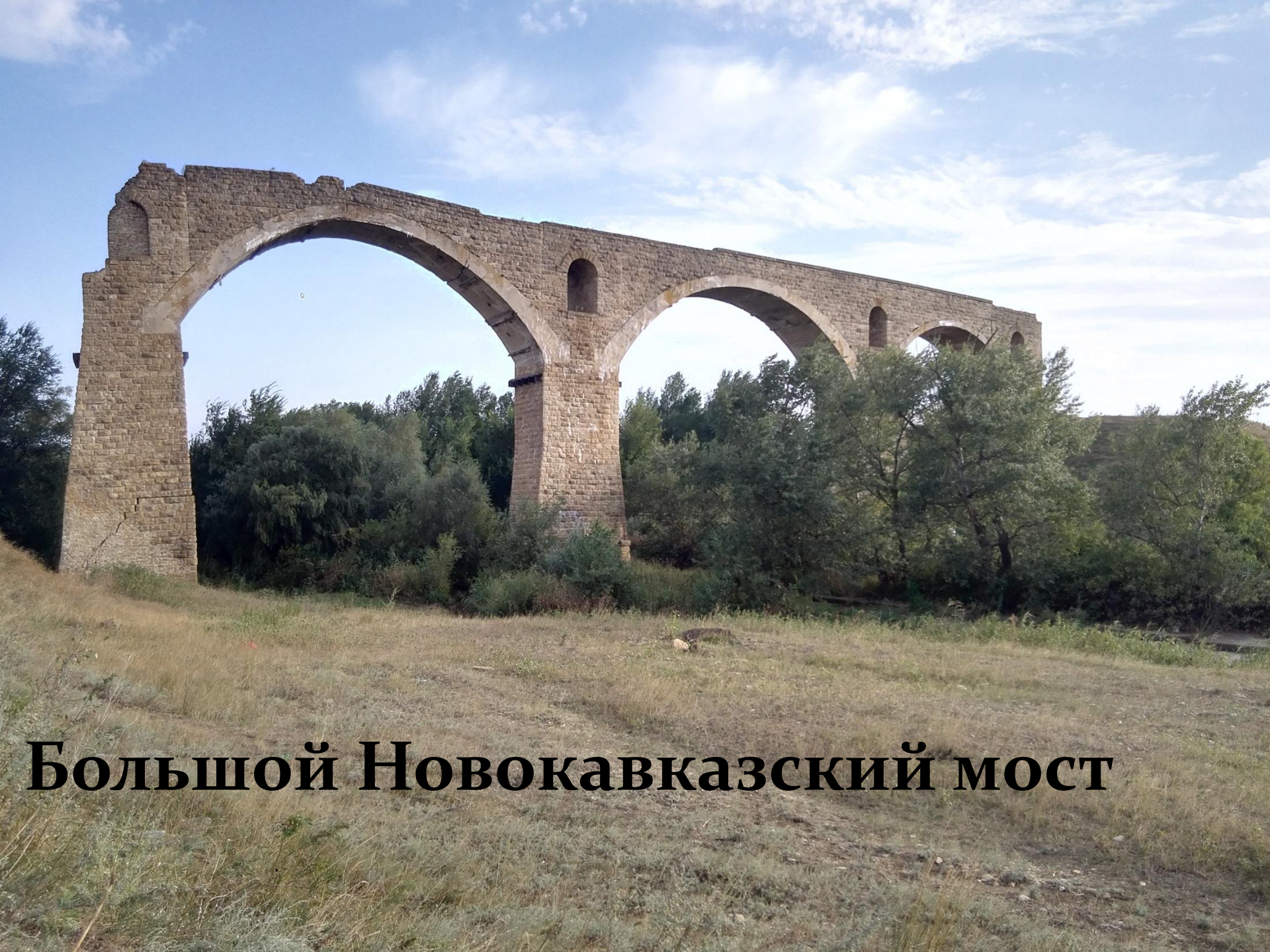
Большой Новокавказский мост