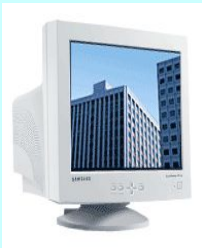
мониторы на электронно-лучевой трубке

На его экран выводится изображение при работе компьютера.