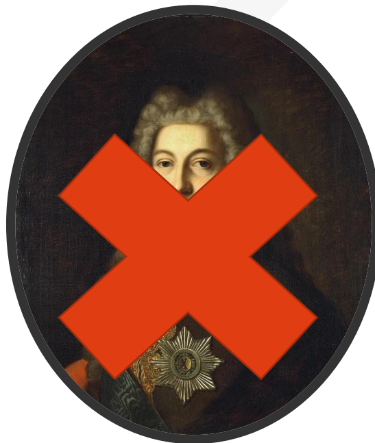
Андрей Иванович Остерман (1686-1747 гг.)

Бирон не пользовался популярностью. Не прошло и месяца, как он был арестован. Реальная власть оказалась в руках А.И. Остермана.