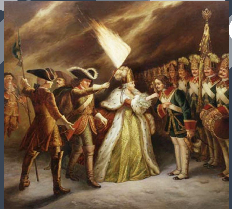
Присяга Преображенского полка императрице Елизавете Петровне. Ф. Московитин