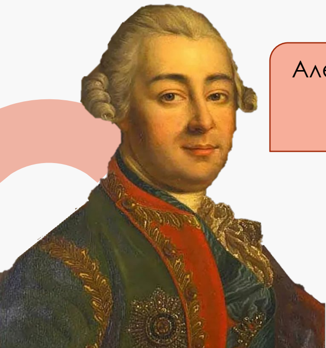
Алексей Григорьевич Разумовский (1709-1771 гг.)

Фаворитизм (фр. favoritisme) — социокультурное явление, существовавшее при монарших (королевских, императорских, царских) дворах, главным образом, в Европе эпохи абсолютизма и состоявшее в возвышении конкретного лица или группы лиц в связи с личной приязнью к ним монарха. Получил распространение в абсолютных монархиях.