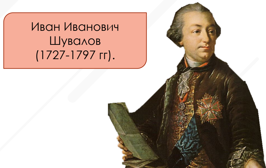
Иван Иванович Шувалов (1727-1797 гг.).