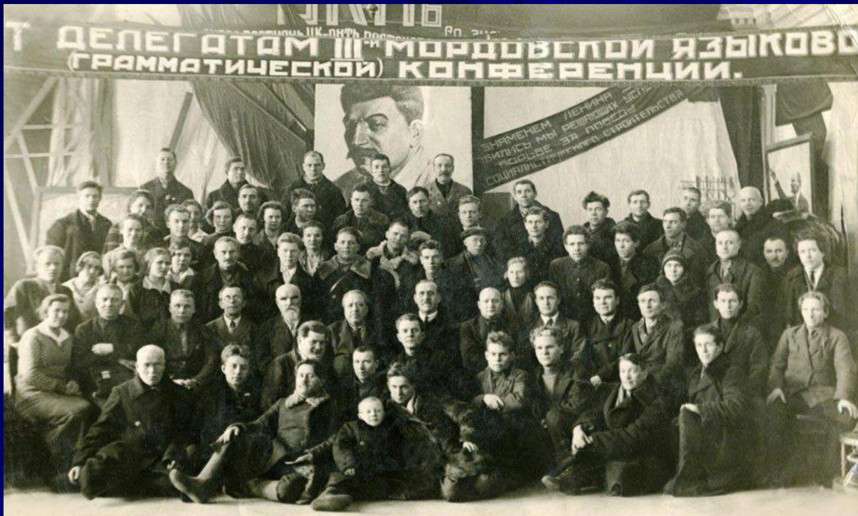
Делегаты 3-й Мордовской языковой научной конференции. Саранск. 31.12 1934 г. — 5.01. 1935 г.