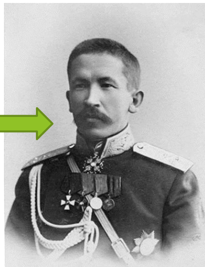
Корнилов Лавр Георгиевич