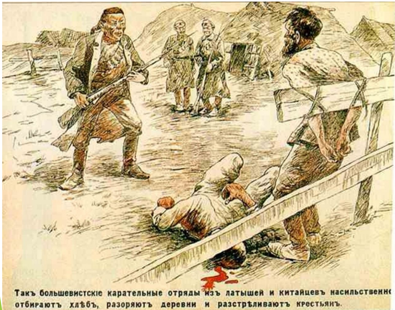
Такъ большевистскіе карательные отряды изъ латышей и китайцевъ насильственно отбираютъ хлѣбъ, разоряютъ деревни и расстрѣливаютъ крестьянъ.

Важная составляющая войны - это борьба двух идеологий (идей), большевистской и белогвардейской. И в этой борьбе важным элементом были агитационные плакаты. Перед вами плакаты Белых: