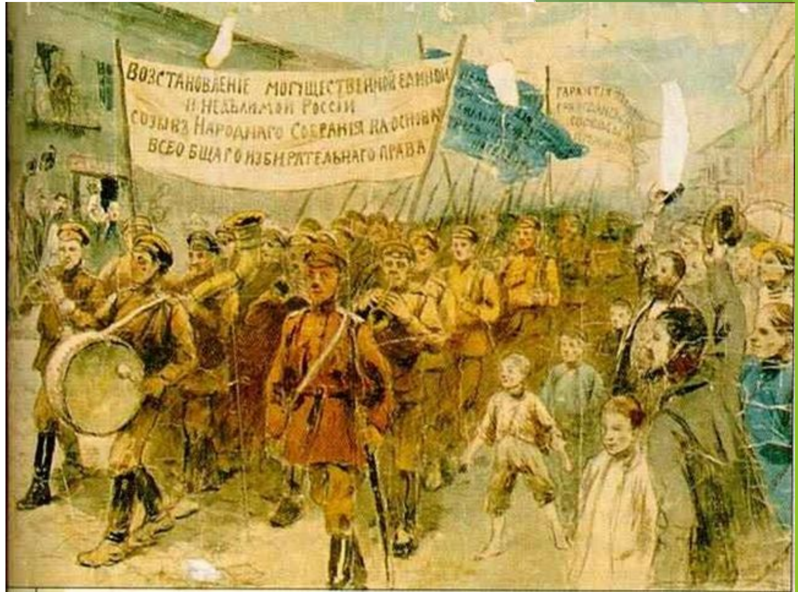
Восстановление могущественной единой и неделимой России. Созыв Народного Собрании на основании всеобщего избирательного права.