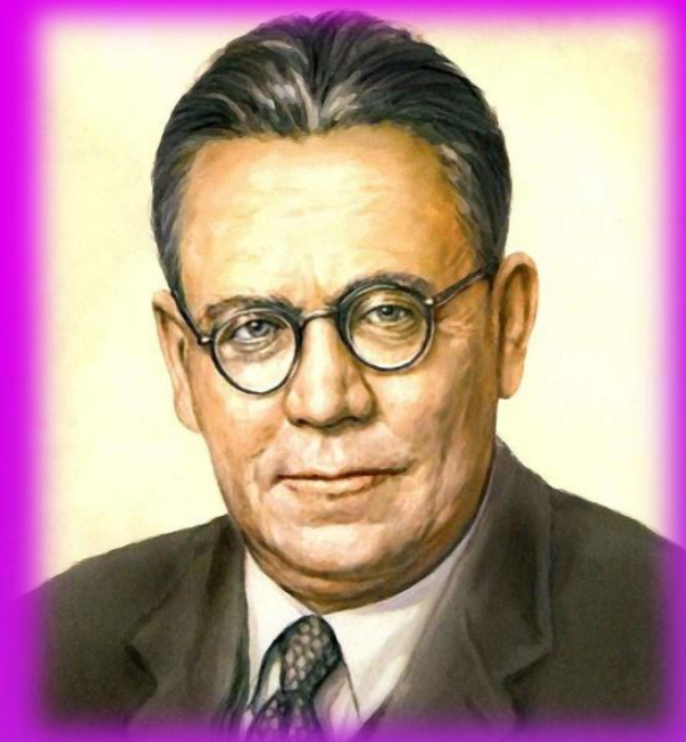
Самуил Яковлевич Маршак (3 ноября 1887 г. - 4 июля 1964 г.)