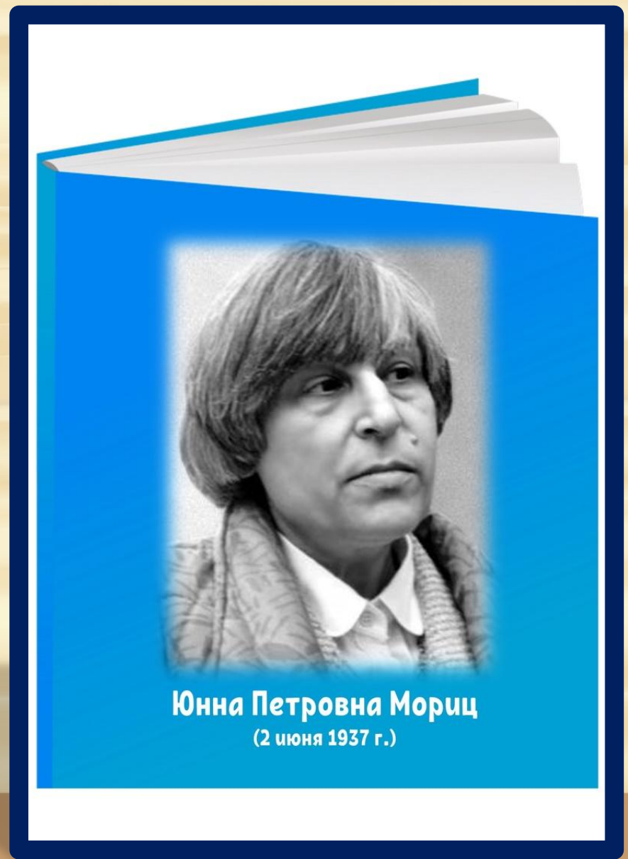
Юнна Петровна Мориц (2 июня 1937 г.)