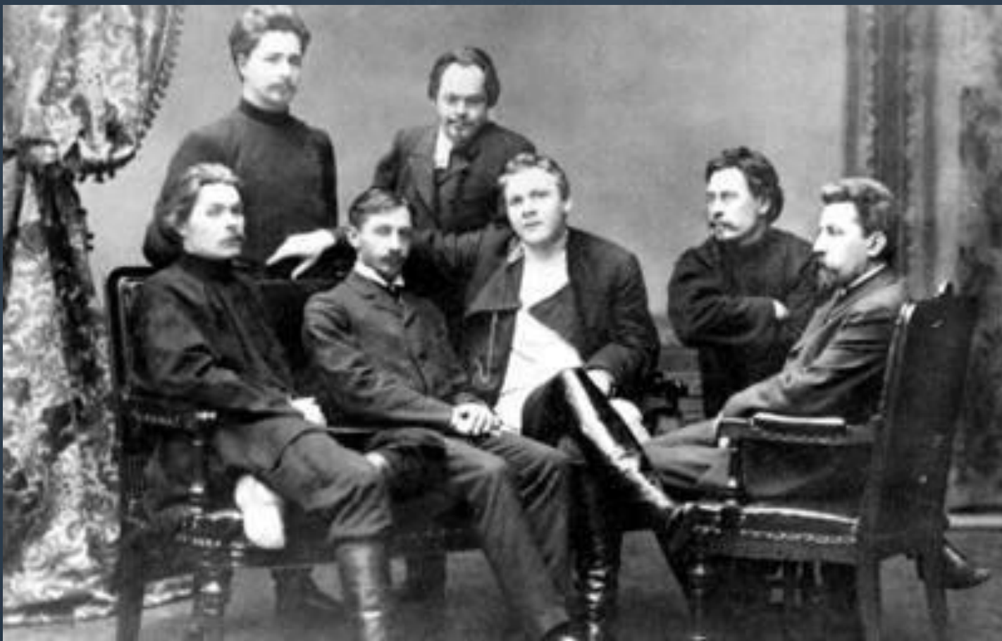
М. Горький, И. Бунин, Ф. Шаляпин. Скиталец (С. Петров), Н. Телешов, Л. Андреев, Е. Чириков.