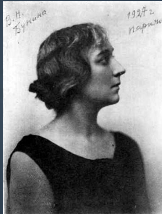
Дочь члена Московской городской управы и племянница председателя Первой Государственной Думы С.А. Муромцева.