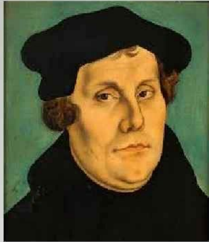
Мартин Лютер (1483-1546 г.)