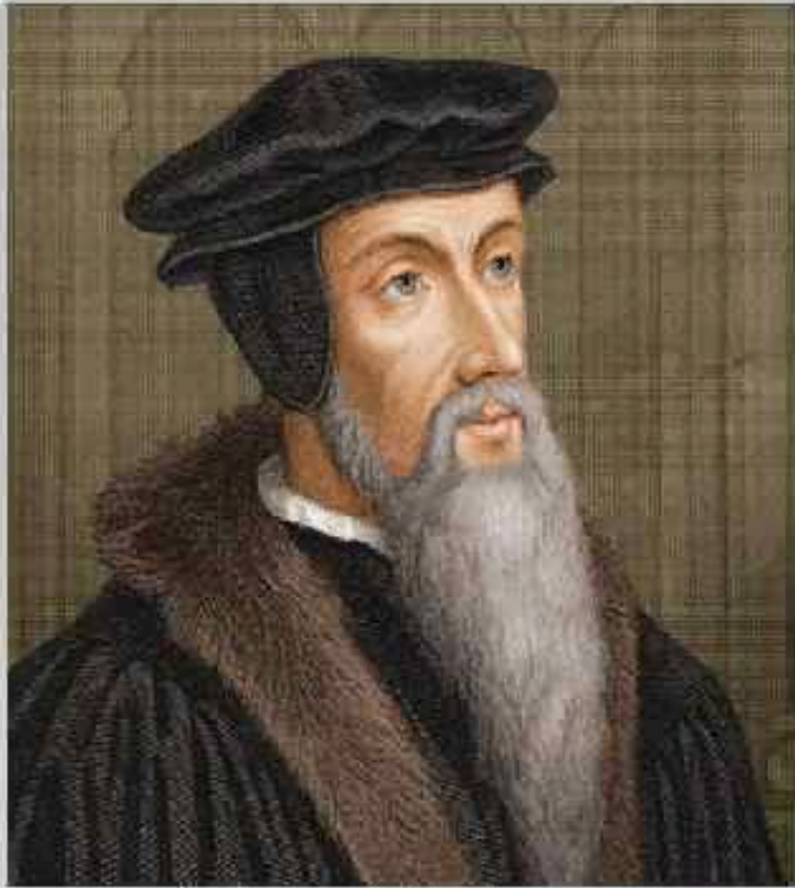
Жан Кальвин (1509-1564 г.)