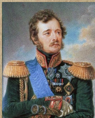
И.Ф. Паскевич-Эриванский (Варшавский)