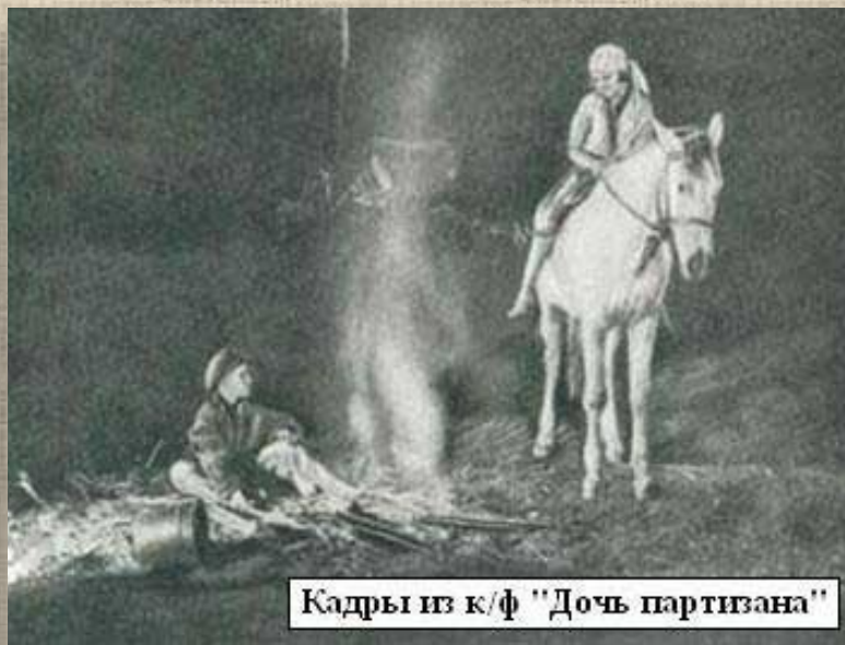
Кадры из к/ф "Дочь партизана"

Зато, когда работа над лентой была завершена, Гулю наградили путевкой в Артек. Так она взяла свою первую высоту.