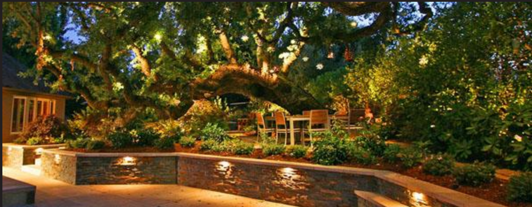
Фото объекта на котором применен аналогичный тип светильников