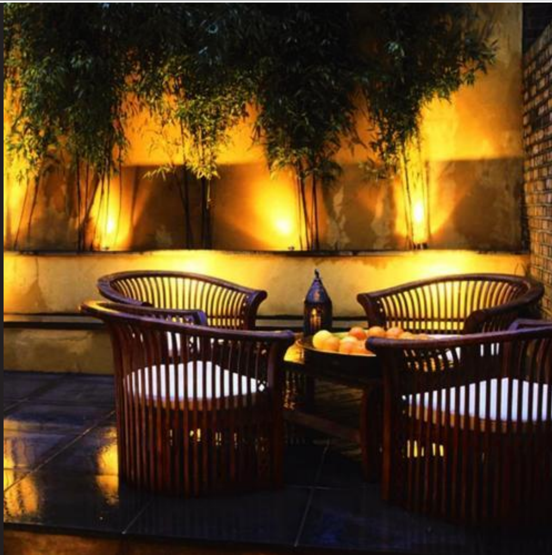
Свет отражается от поверхности ограждения и освещает дворовую территорию