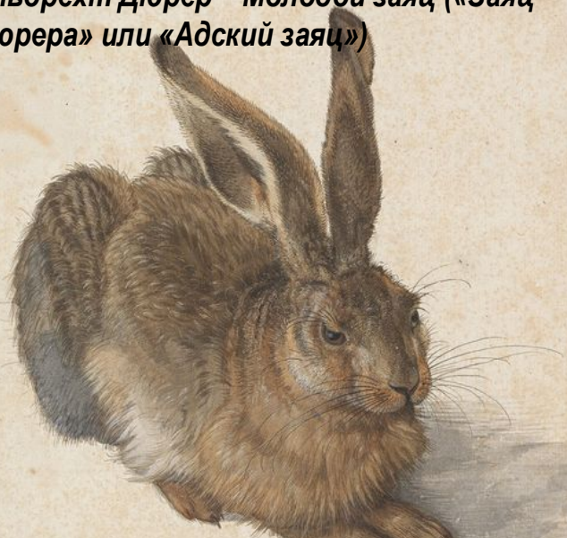
Альбрехт Дюрер – Молодой заяц («Заяц Дюрера» или «Адский заяц»)