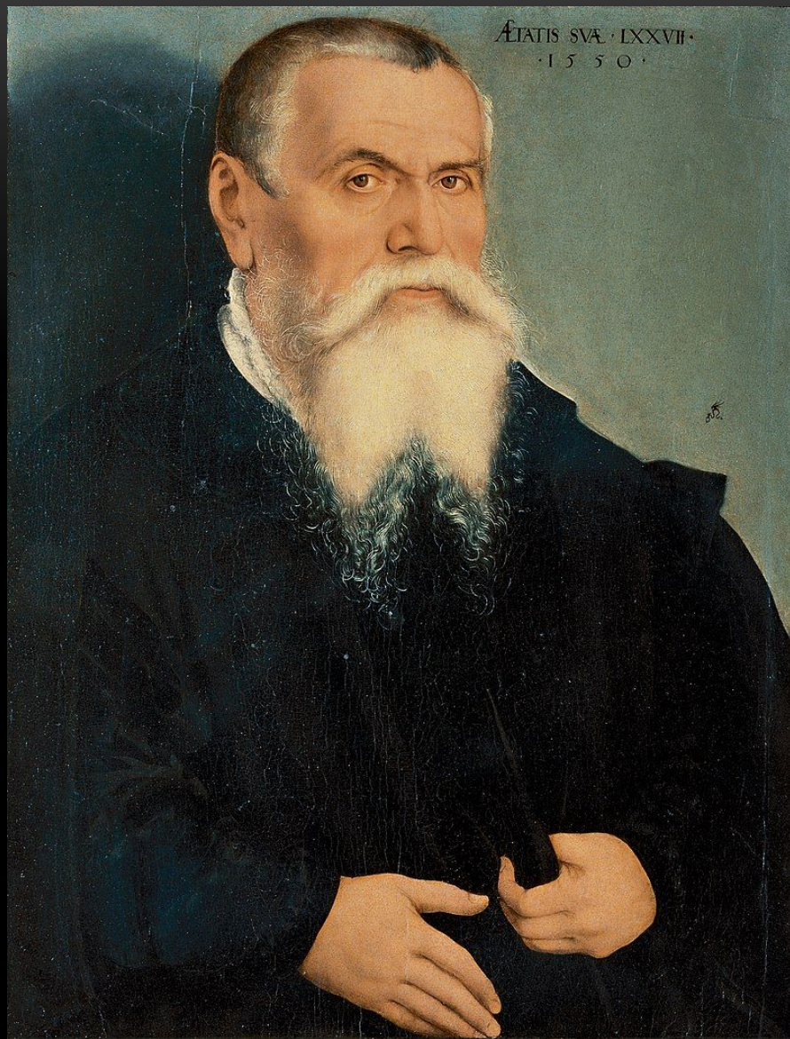
Л. Кранах. Автопортрет, 1550 год, Галерея Уффици, Флоренция