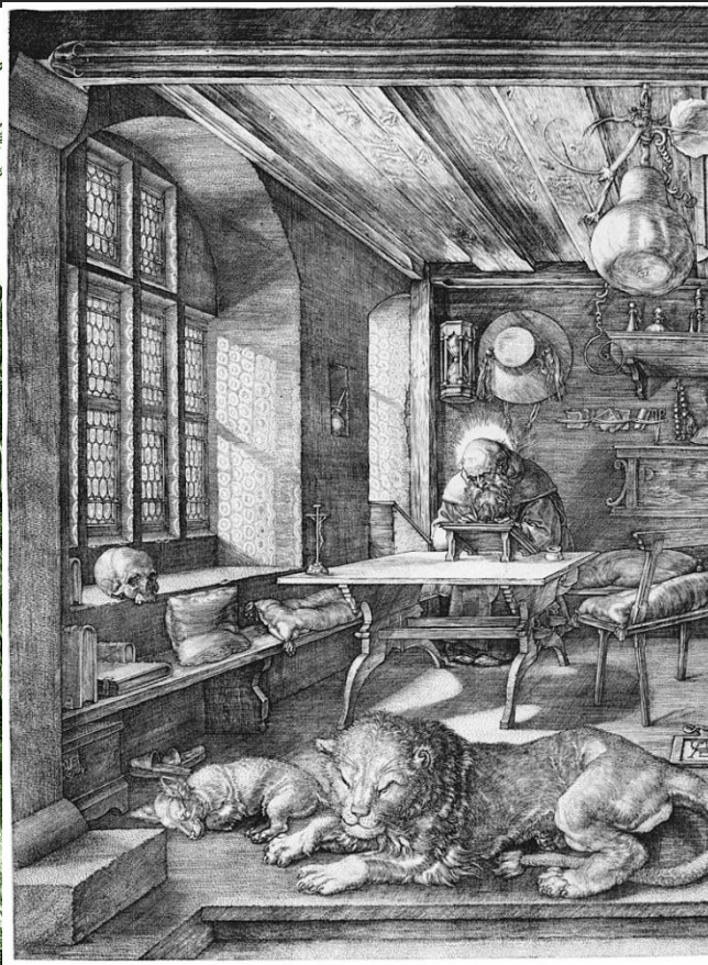
«Святой Иероним» (1514)