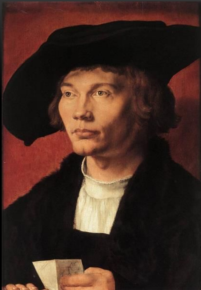
Бернгард фон Рестен (1521, Дрезден, Картинная галерея)