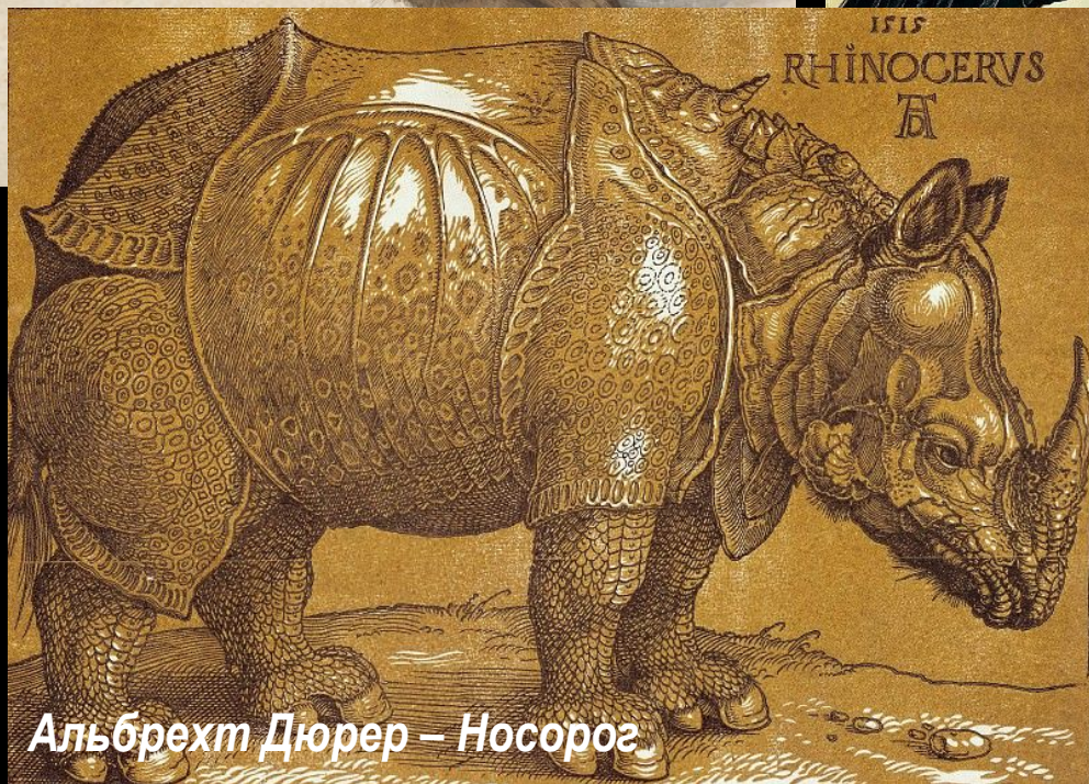
Альбрехт Дюрер – Носорог