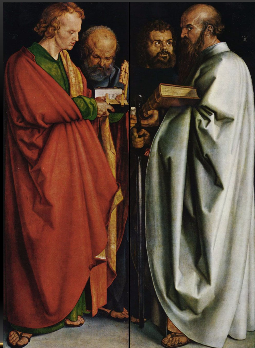
«Четыре апостола» (1526, Мюнхен, Старая пинакотекка)