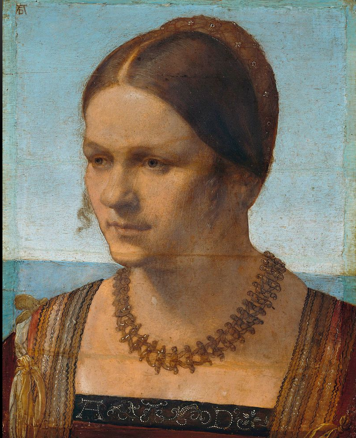
«Портрет молодой женщины», Альбрехт Дюрер, ок. 1506