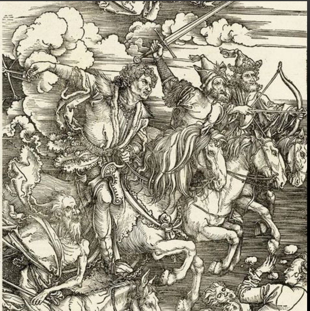
« Ч етыре в садника А покалипсиса (1498)