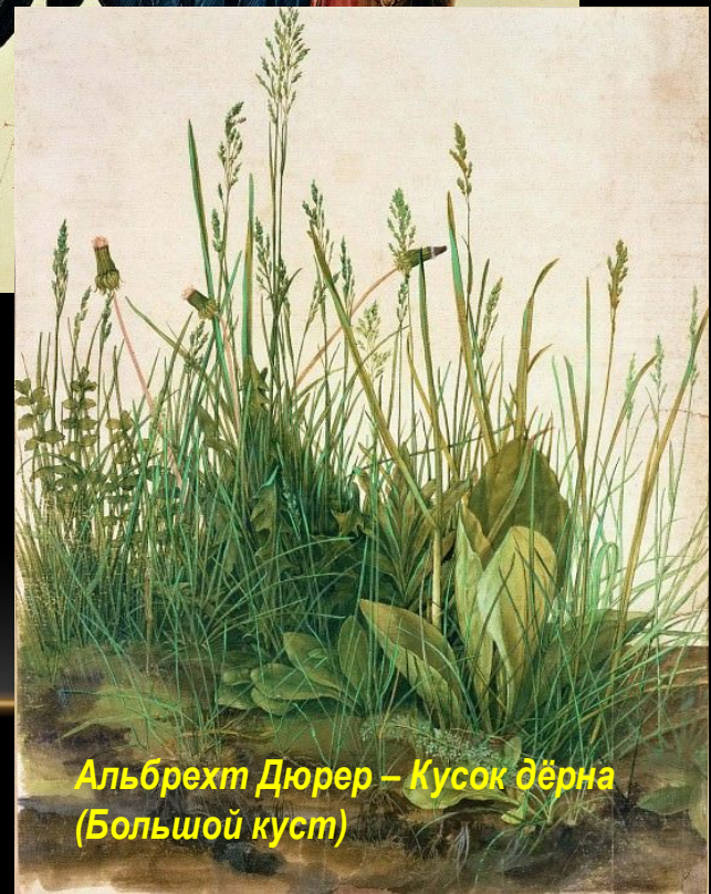
Альбрехт Дюрер – Кусок дёрна (Большой куст)