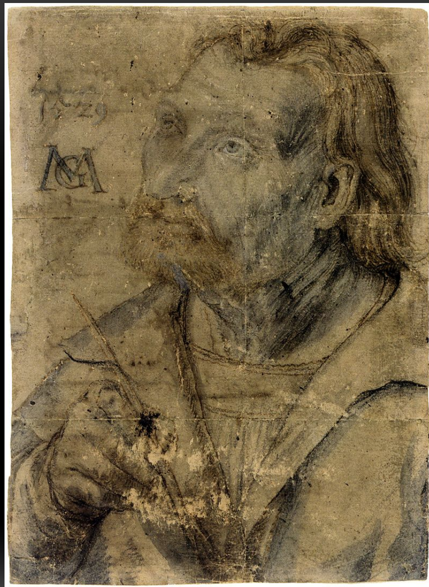
Маттпас Грюневальд (1475–1528)