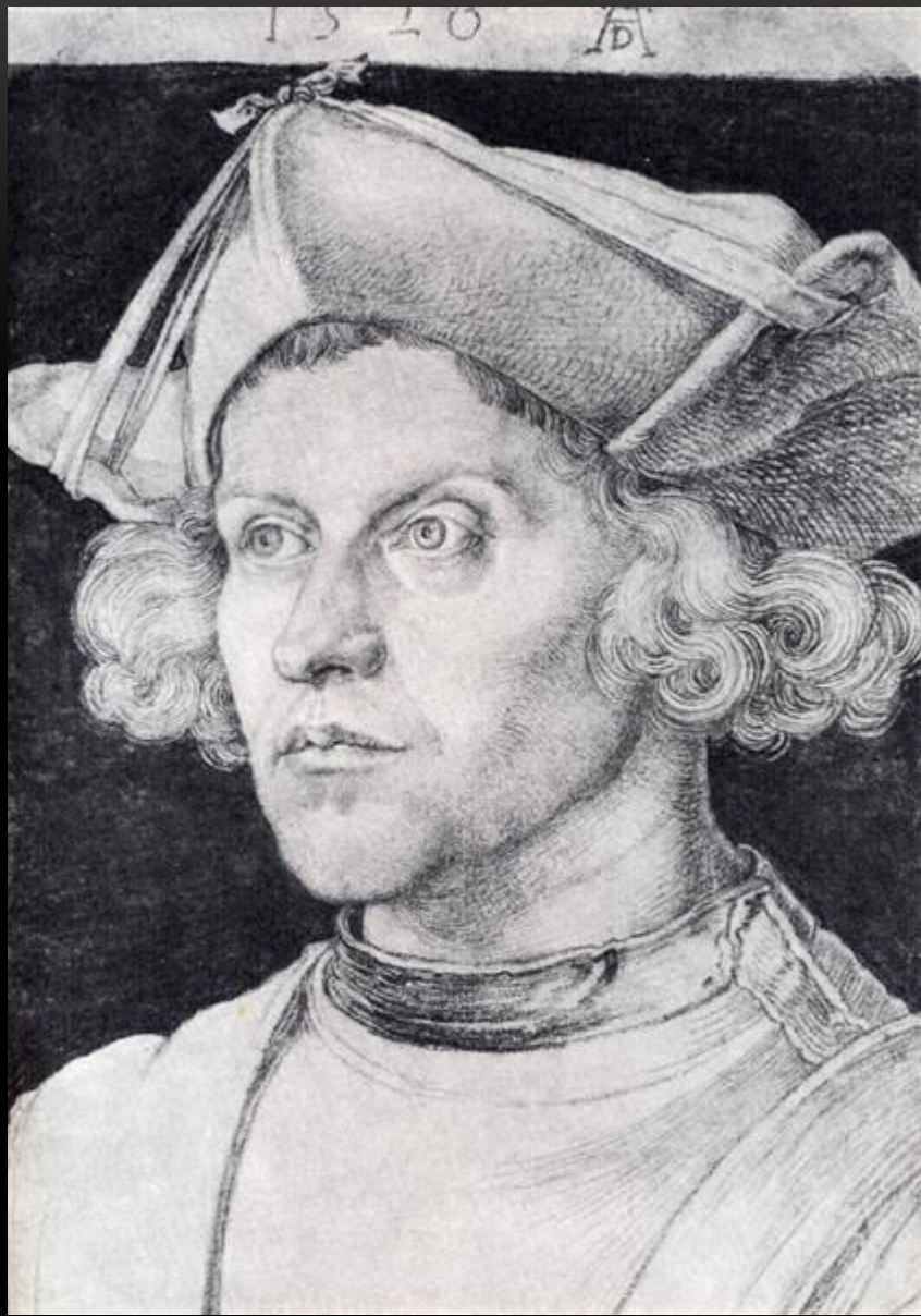
«Неизвестный в черном берете» (1524, Мадрид, Прадо)