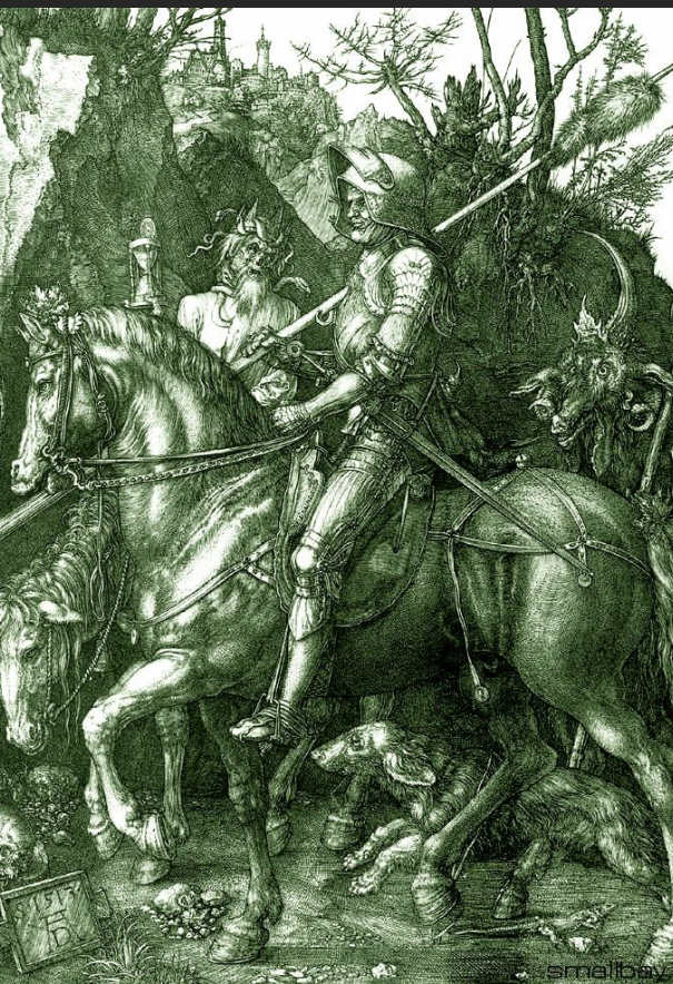
«Рыцарь, смерть и дьявол» (1513)