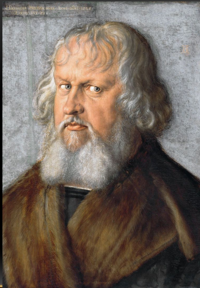
Портрет Иеронима Хольцшуэра 1526. Картинная галерея, Берлин, Германия