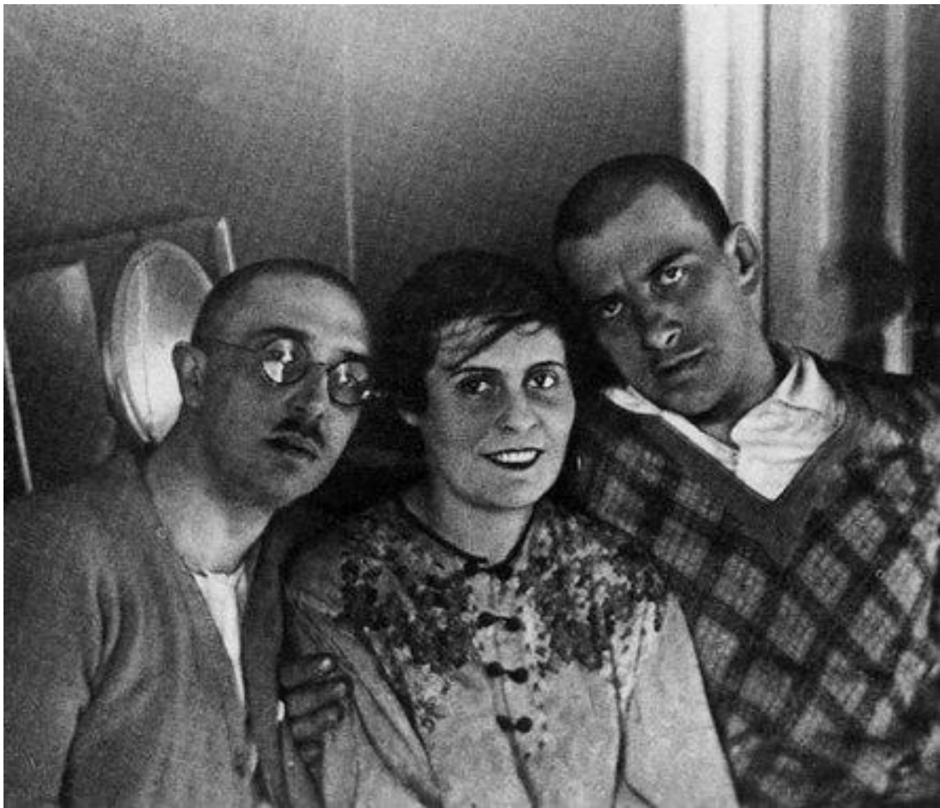
Осип Лилия Владимир Брик Брик