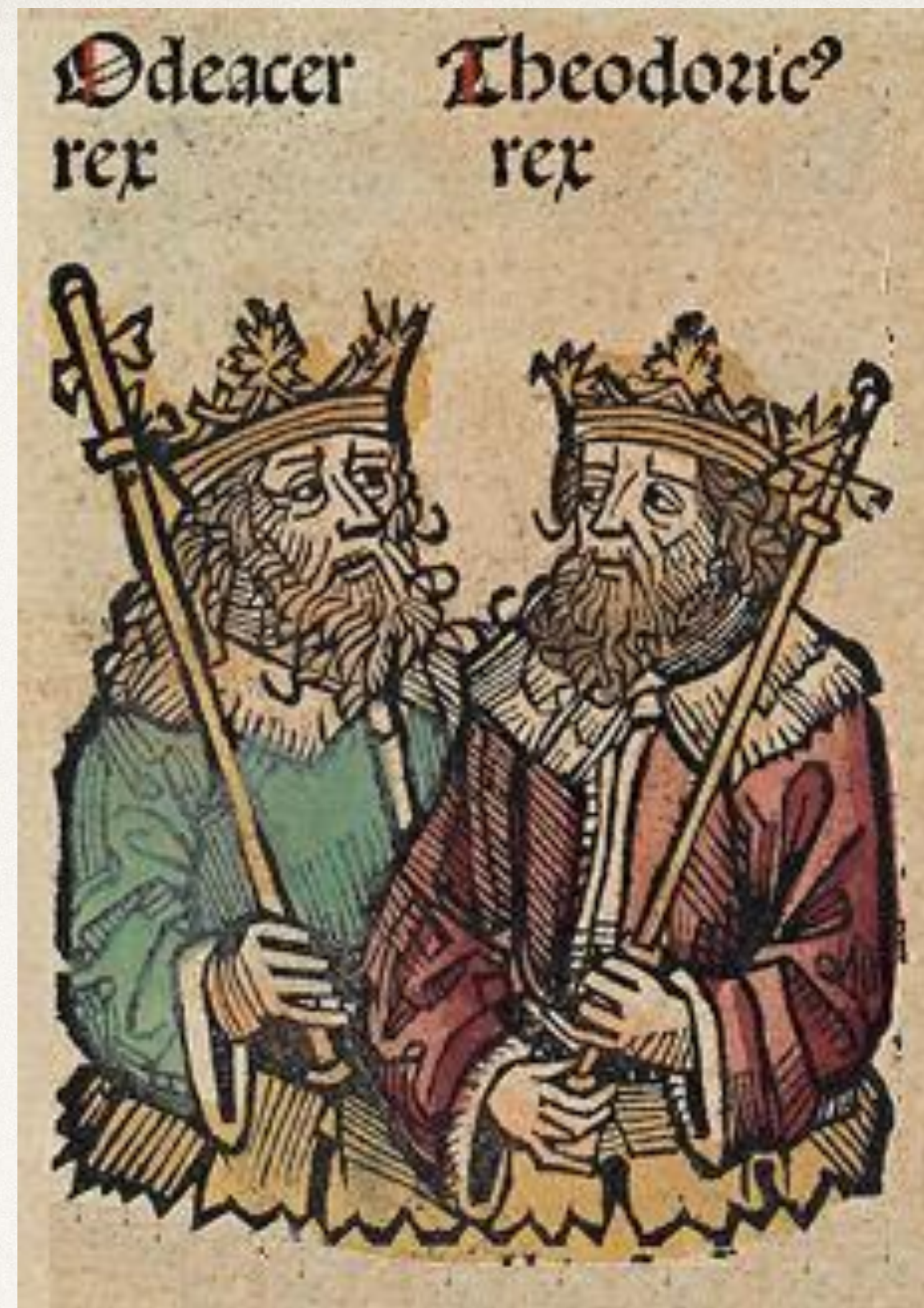
Гравюра Одоакра и Теодориха, 1493. Ксилография, Нюрнбергская хроника

Вернувшись на родину Теодорих становится королем остготов. Теодорих находился на службе у византийского императора и с его согласия он отправился в поход против Италии, где правил тогда Одоакр.