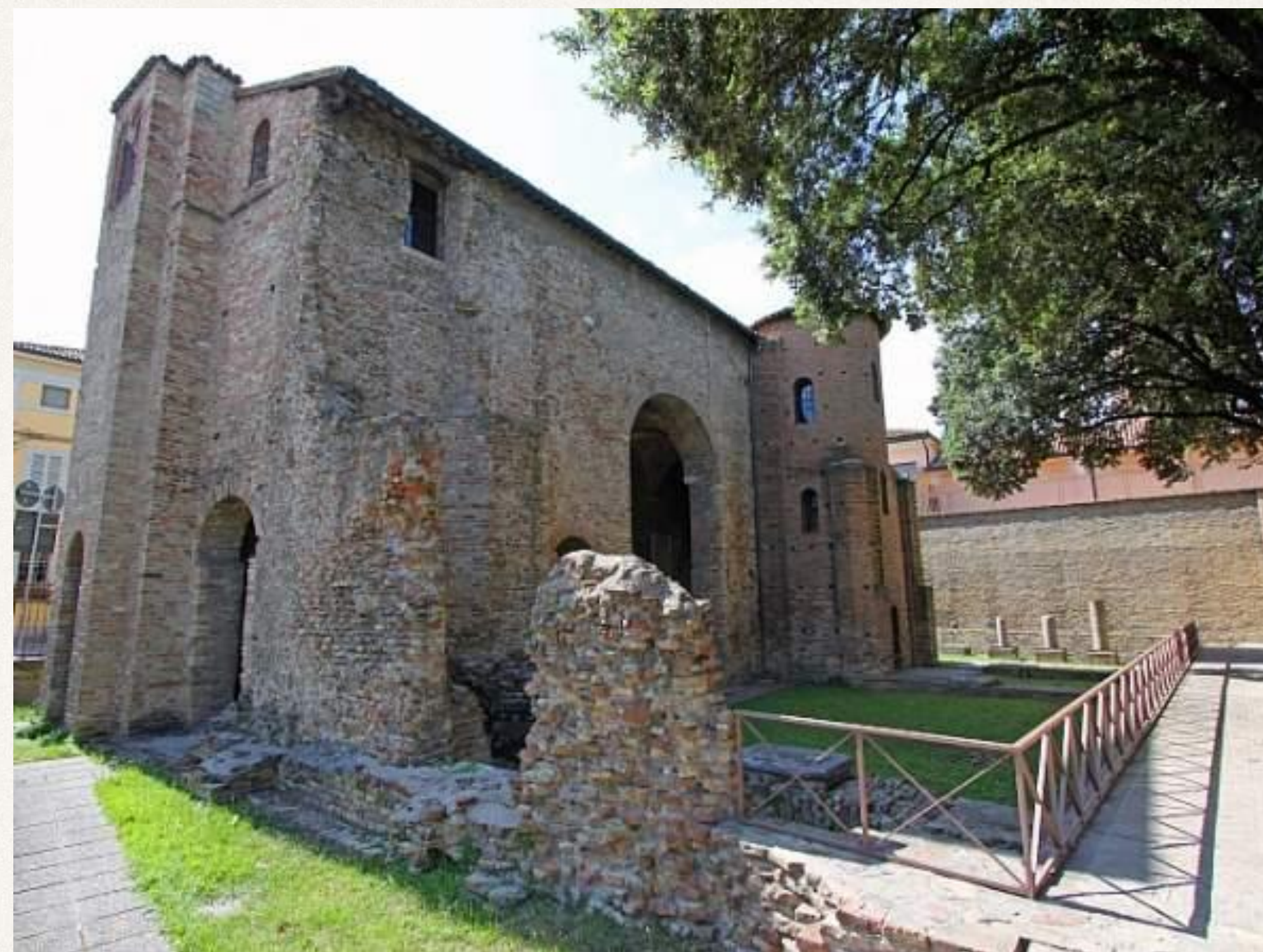
Дворец Теодориха Великого в Равенне. Современные фотографии