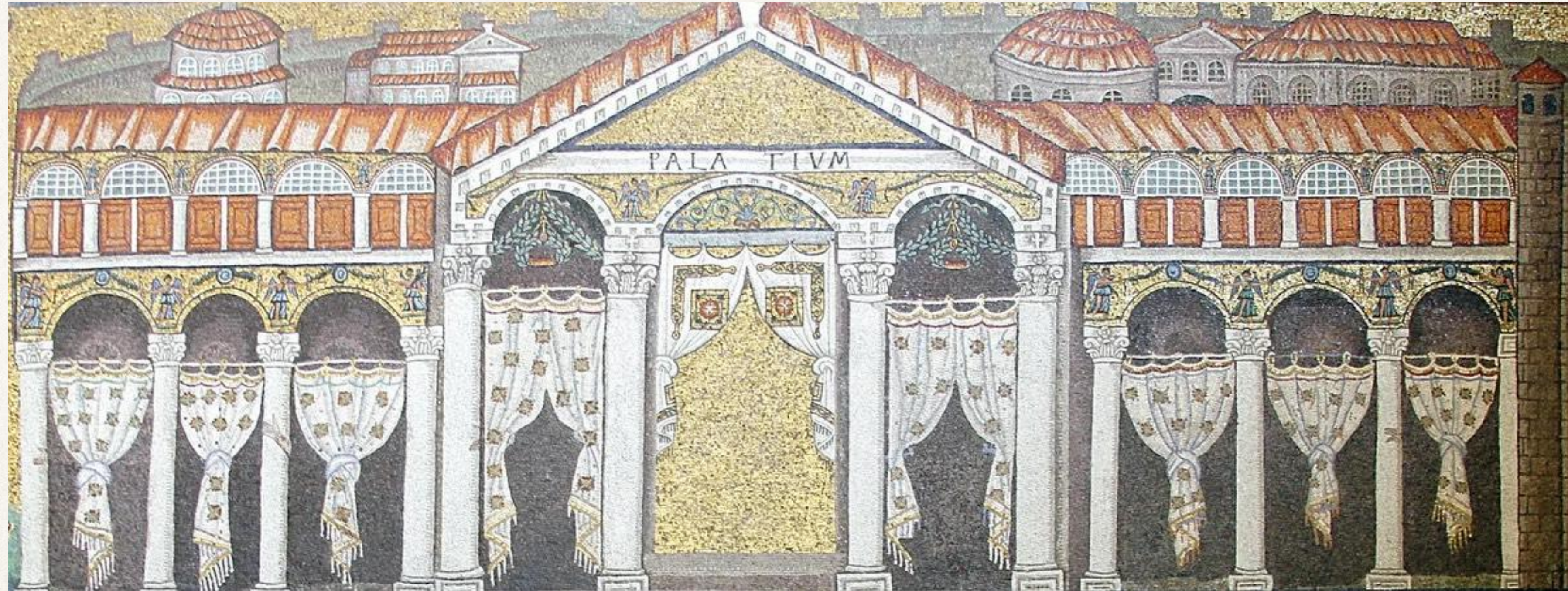
Дворец Теодориха Великого в Равенне. Мозаика в церкви Сант-Аполлинаре-Нуово

Теодорих не стал жить в Риме, он поселился в Равенне и стал управлять Италией.