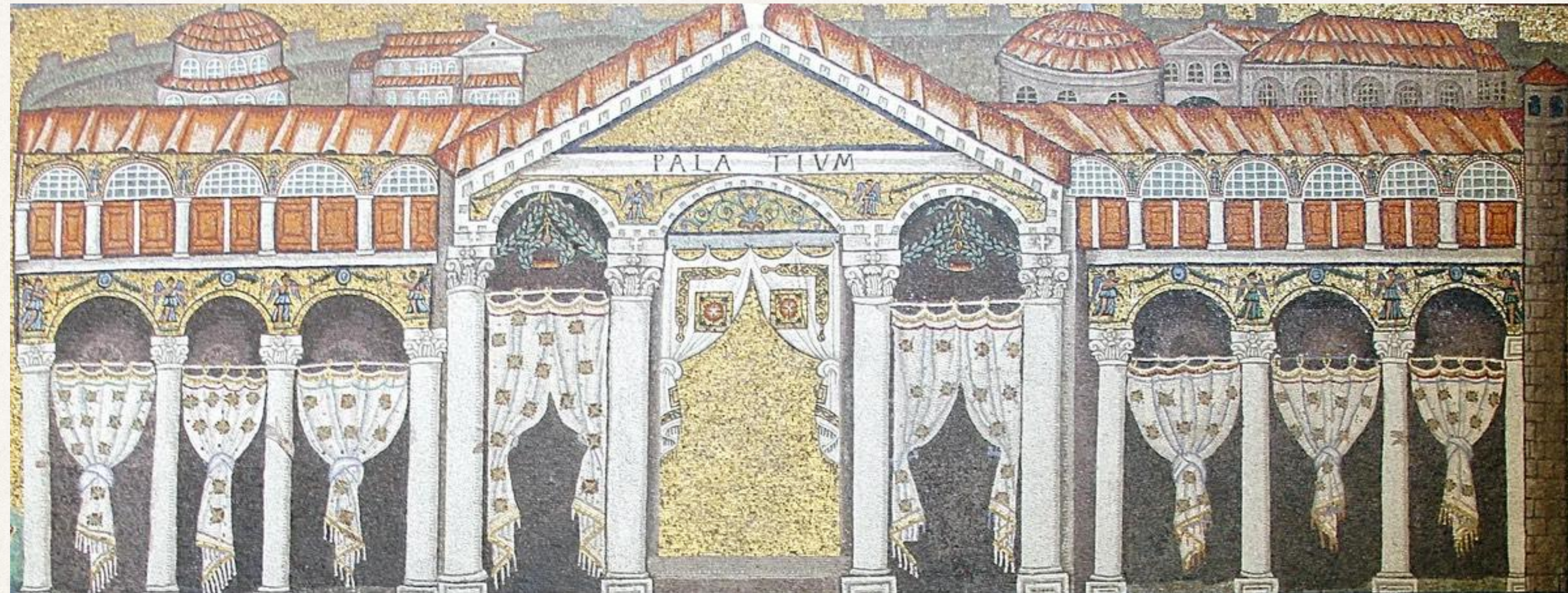
Дворец Теодориха Великого в Равенне. Мозаика в церкви Сант-Аполлинаре-Нуово

Теодорих не стал жить в Риме, он поселился в Равенне и стал управлять Италией.