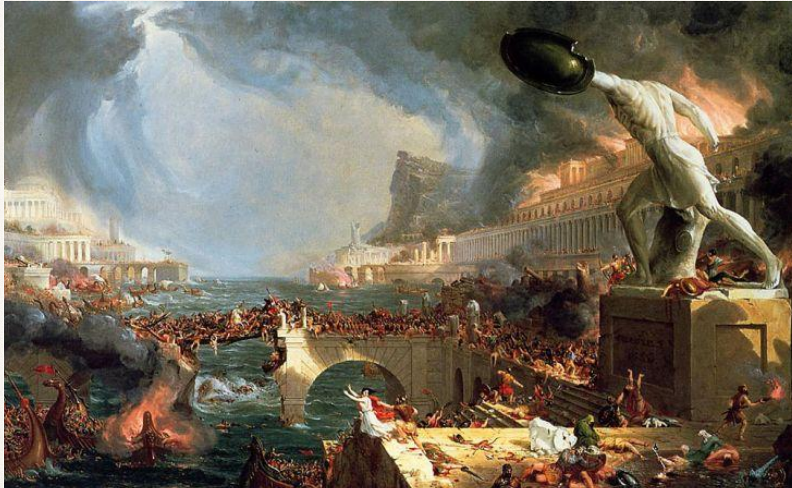
Томас Коул. Путь Империи. «Крушение»

В V веке прекратила свое существование Западная Римская империя.