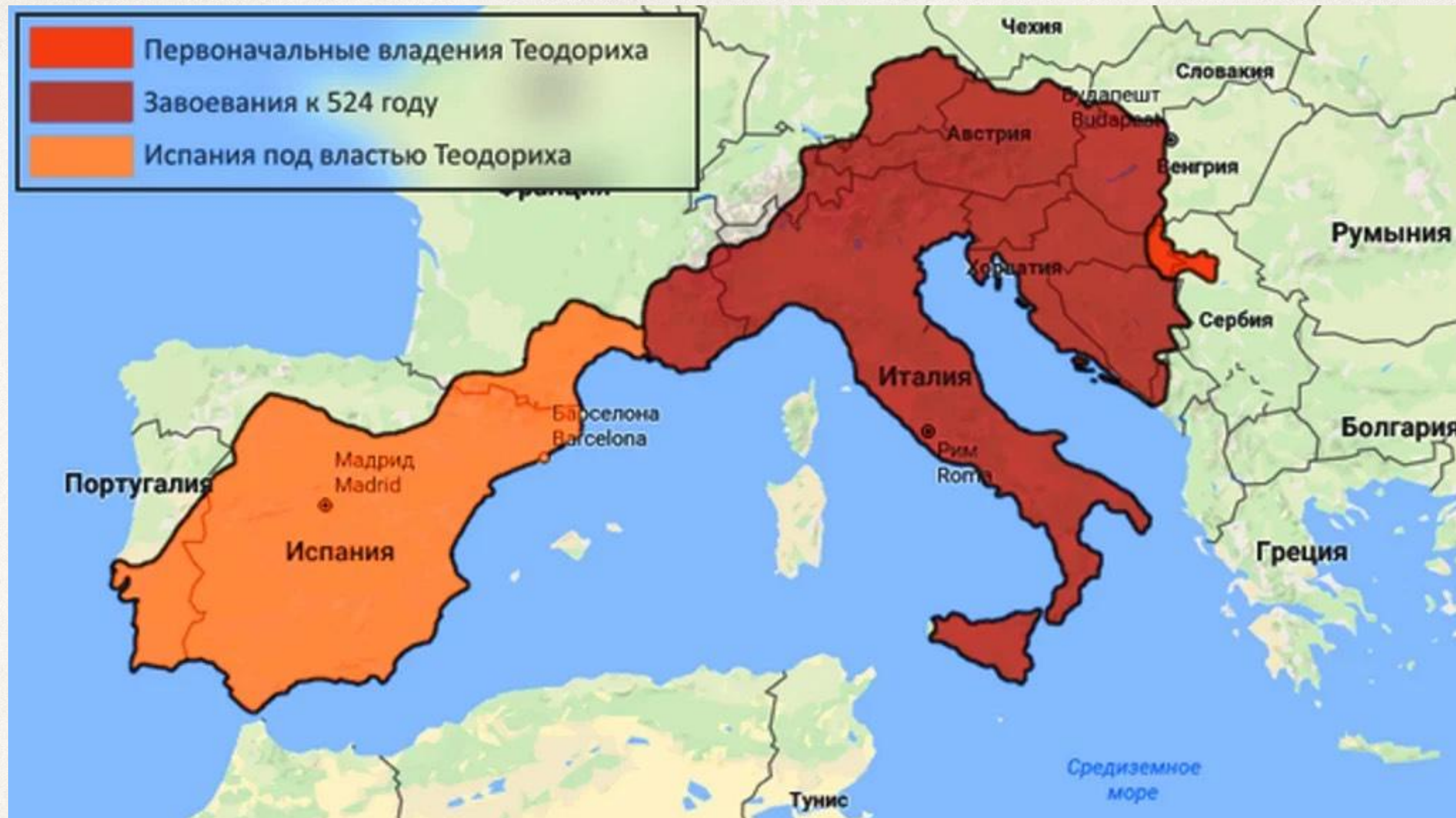
Рост территории Королевства остготовов в период правления Теодориха Великого