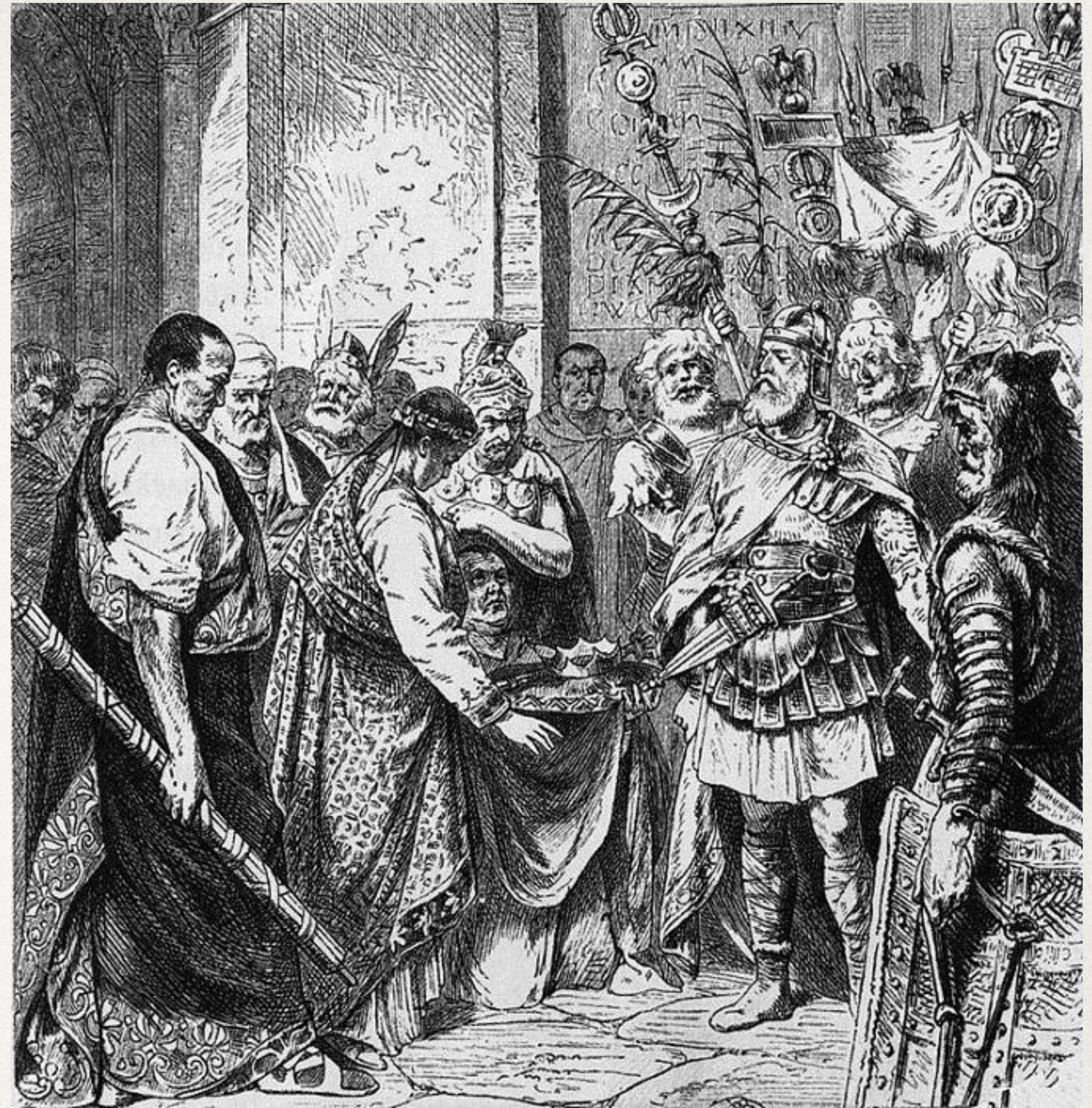
Ромул Август и Одоакр

Варварский вождь Одоакр сверг последнего императора Западной Римской империи Ромула Августула и отправил знаки его власти в Константинополь.