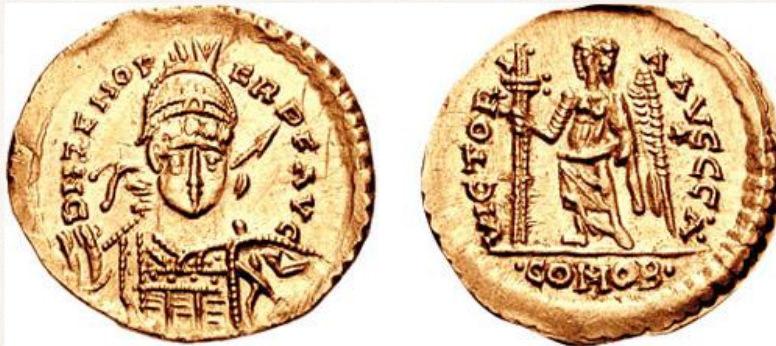
Золотая монета с изображением Одоакра