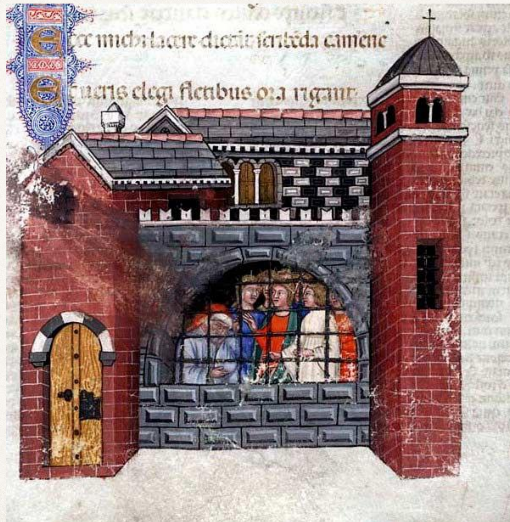
Бозций в тюрьме. Миниатюра из средневековой рукописи «Утешения философией», 1385

Бозций был обвинён в государственной измене и заключён в тюрьму.