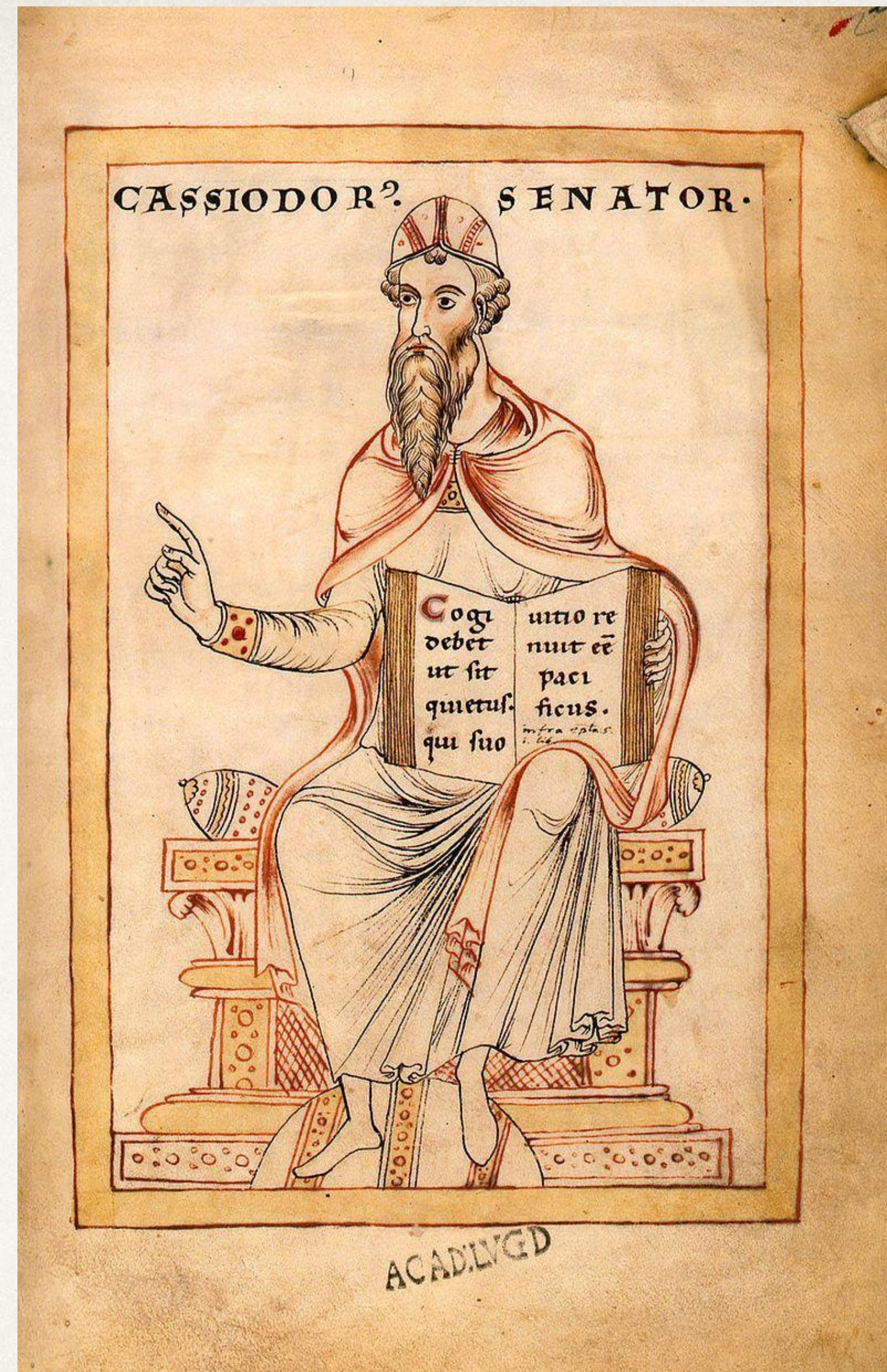
Изображение Кассиодора в рукописи Gesta Theodorici (1170-е годы, Фульдское аббатство)

Кассиодор - римский писатель, историк и государственный деятель во время правления Теодориха Великого и его преемников.