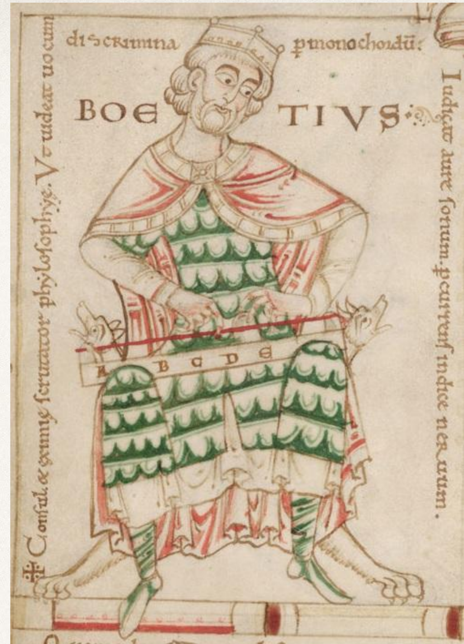
Боэций с монохордом. Фрагмент книжной миниатюры в кембриджской рукописи, около 1150 г.

Главным римлянином при дворе Теодориха был Боэций.