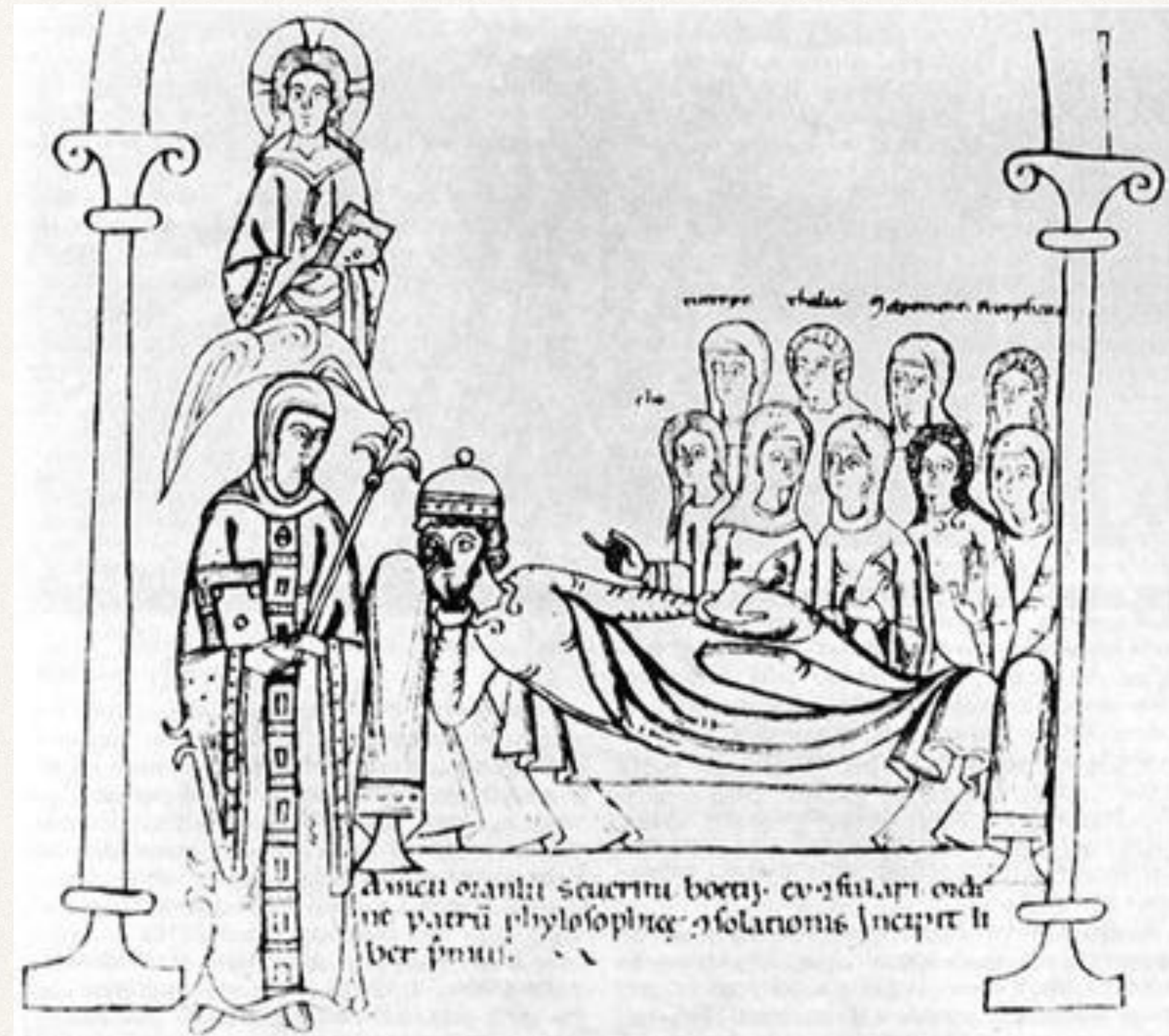
Боэций, утешаемый Философией. Миниатюра XII в. из трактата «Утешение философией»