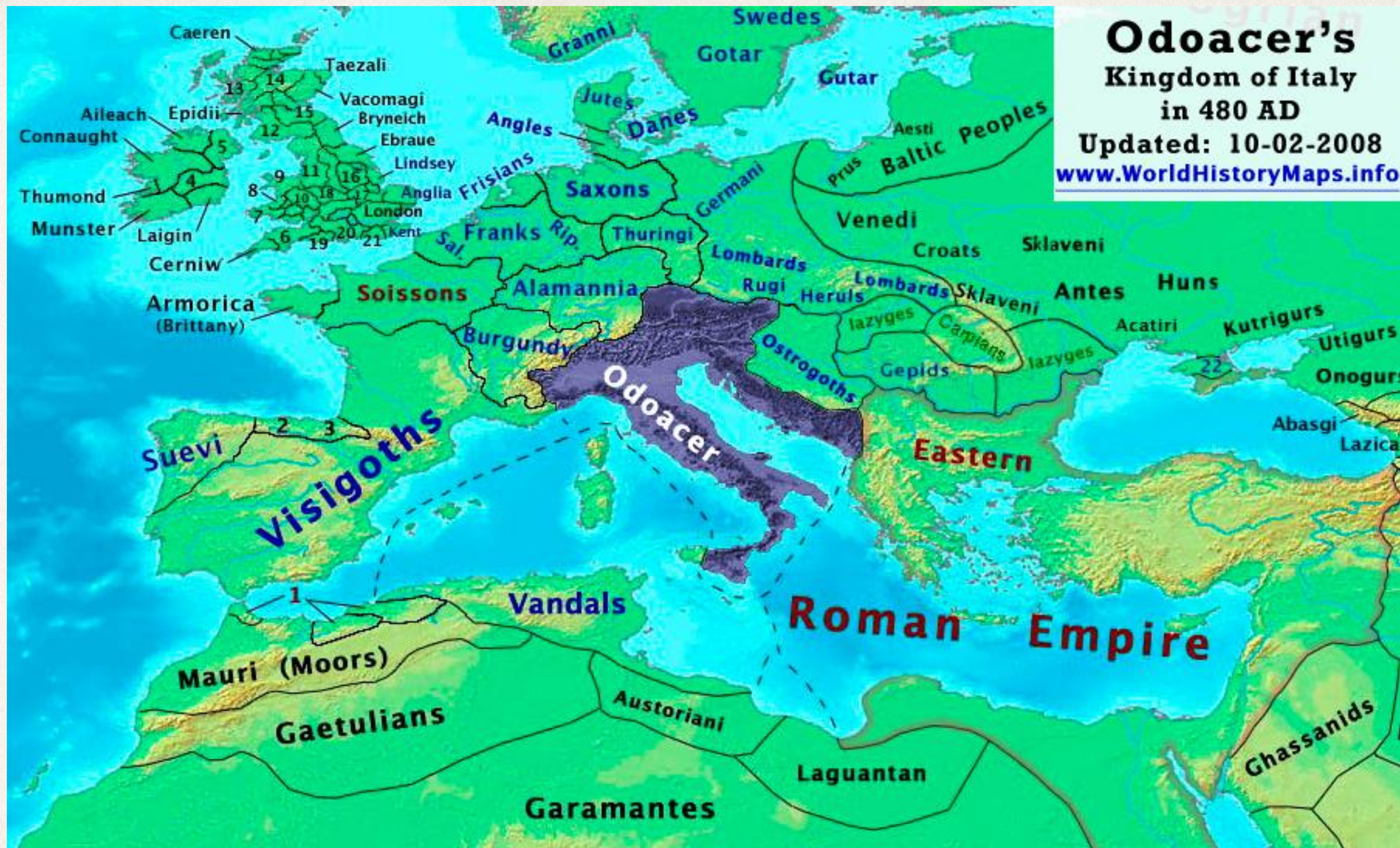
Королевство Одоакра в 480 году