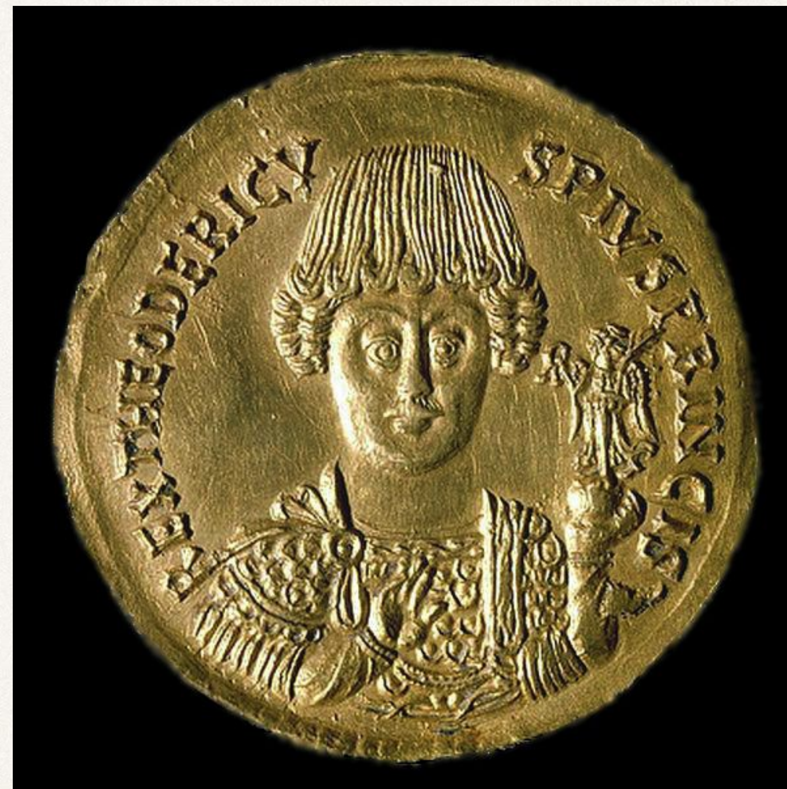
Золотая монета с изображением Теодориха Великого

Возглавлял остготов Теодорих, впоследствии прозванный Великим.