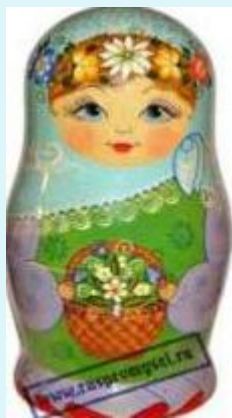
Роспись русской матрешки (Московская и Нижегородская обл. )