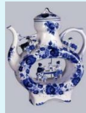
Гжельская роспись, или гжель. Подмосковной деревне Гжель.