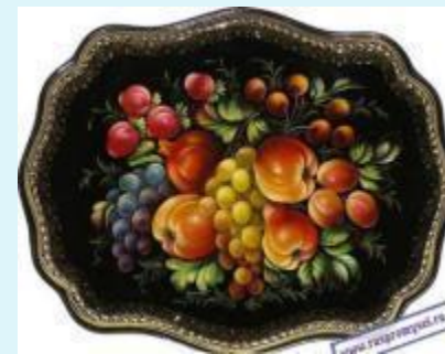
▣ Жостовская роспись. Подмосковное село Жостово Мытищинского района