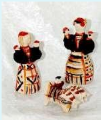
Чернышенская глиняная игрушка (Орловская область Новосильский район)