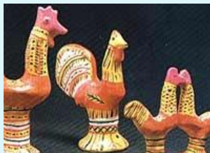
Филимоновская игрушка (д. Филимонова, г. Одоев Тульской области)