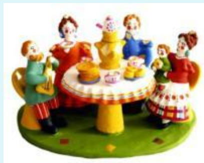
Дымковская игрушка. Дымковская слобода, г.Киров, на берегу реки Вятки