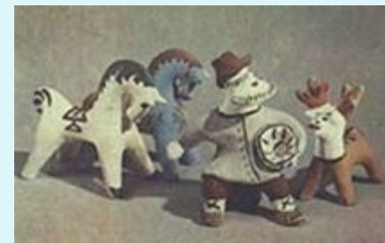
Каргопольская игрушка (г.Каргополь Архангельской области)