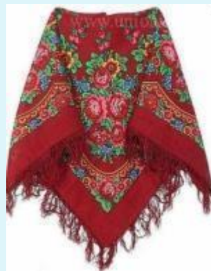
Платки Павлов Посад (Московская обл.)