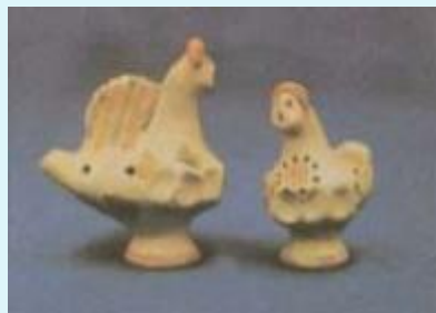
Плешковская игрушка (Ливенский район Орловской области)