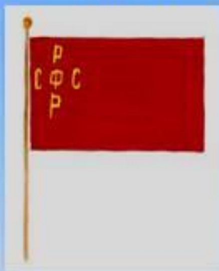
Государственный флаг РСФСР 1918г.

С установлением советской власти Государственным флагом стал флаг красного цвета с изображением серпа и молота.