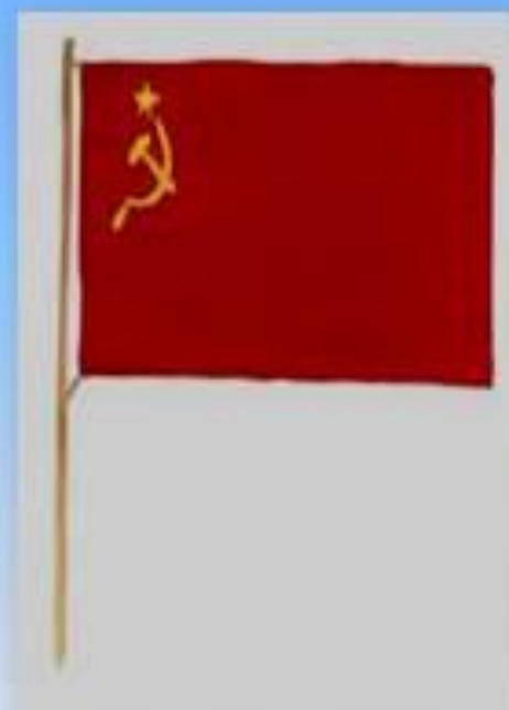
Государственный флаг СССР