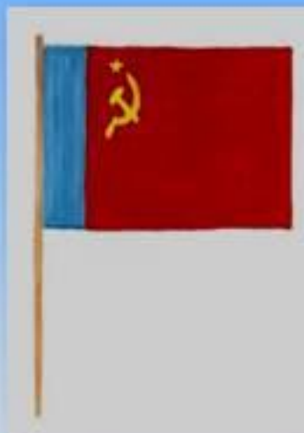
Государственный флаг РСФСР 1954г.