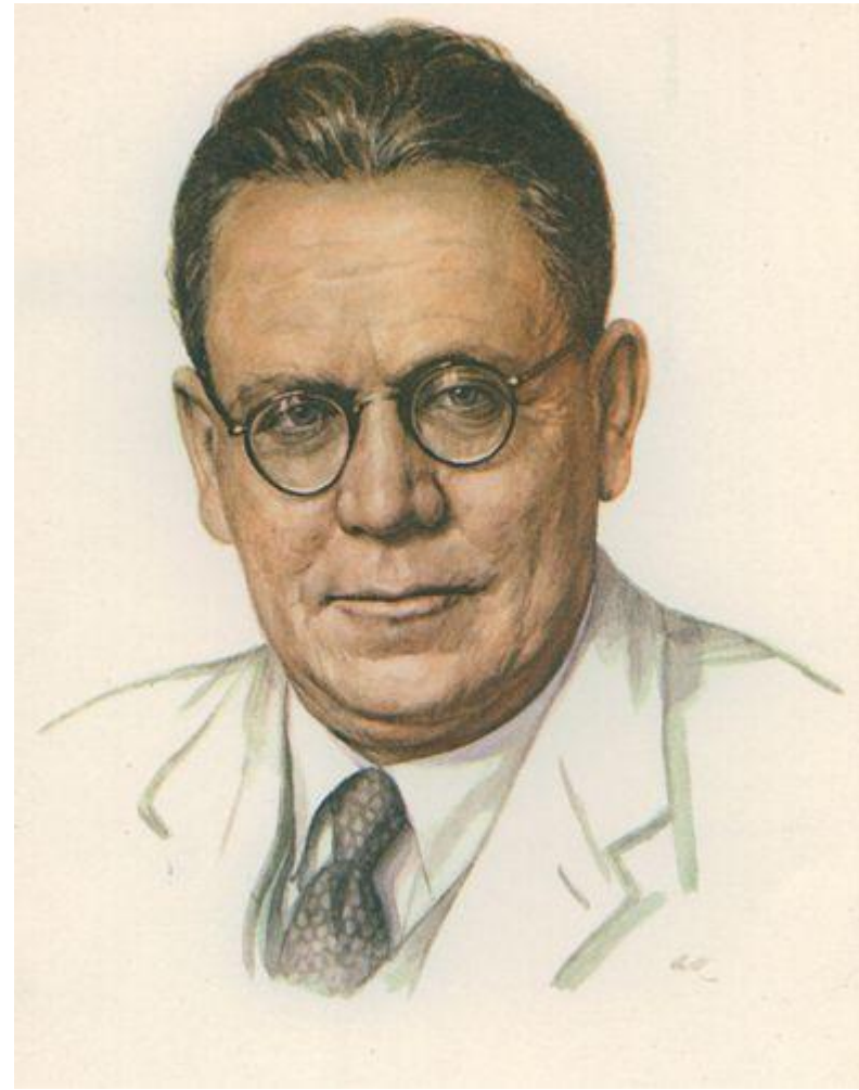
С. Я. Маршак

Случай свёл его с Самуилом Яковлевичем Маршаком, который посоветовал всерьёз заняться поэтическим творчеством.