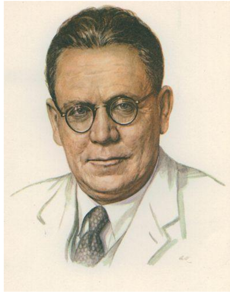
С. Я. Маршак

Случай свёл его с Самуилом Яковлевичем Маршаком, который посоветовал всерьёз заняться поэтическим творчеством.