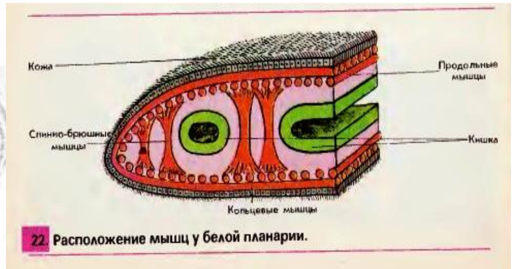
22. Расположение мышц у белой планарии.

Ткань — это совокупность однородных клеток, выполняющих определенную функцию.