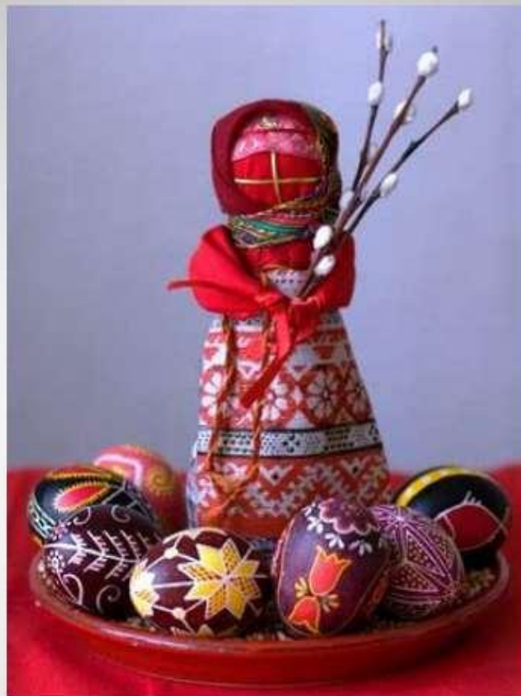
Кукла - Пасха