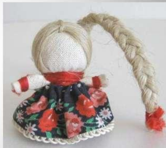
Куколка на здоровье, счастье