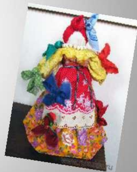
Кукла - Радость