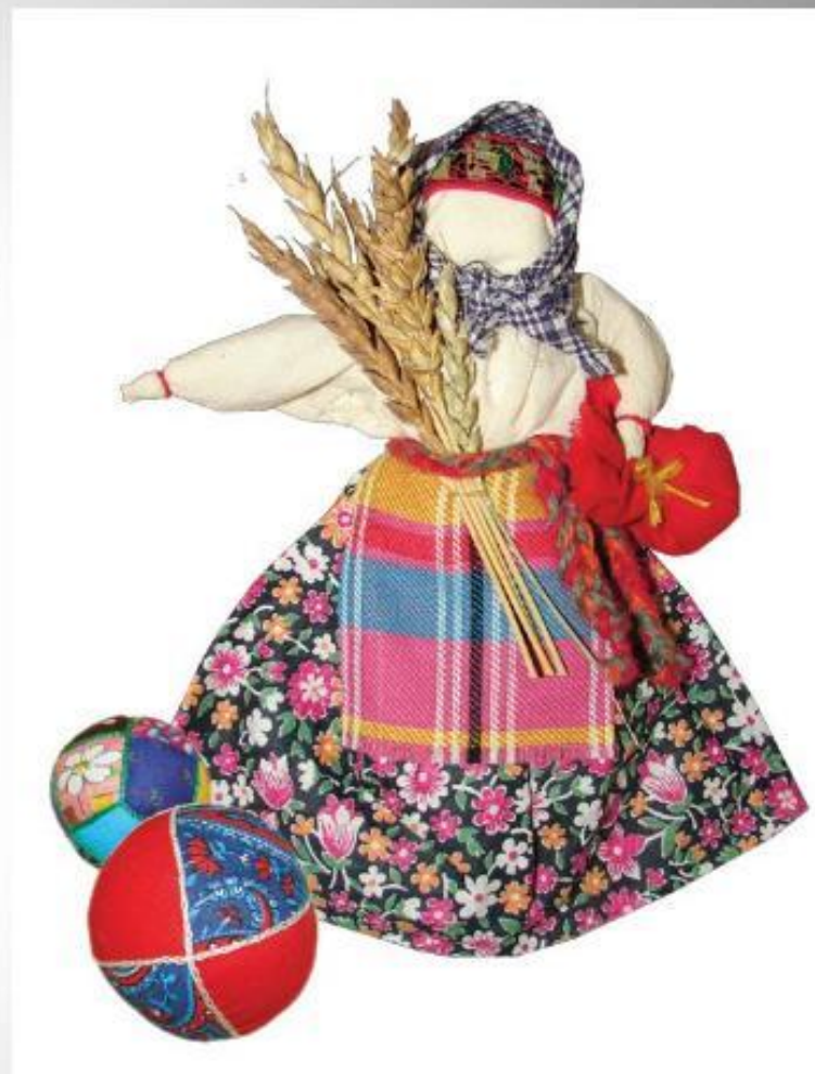
Кукла - Жница