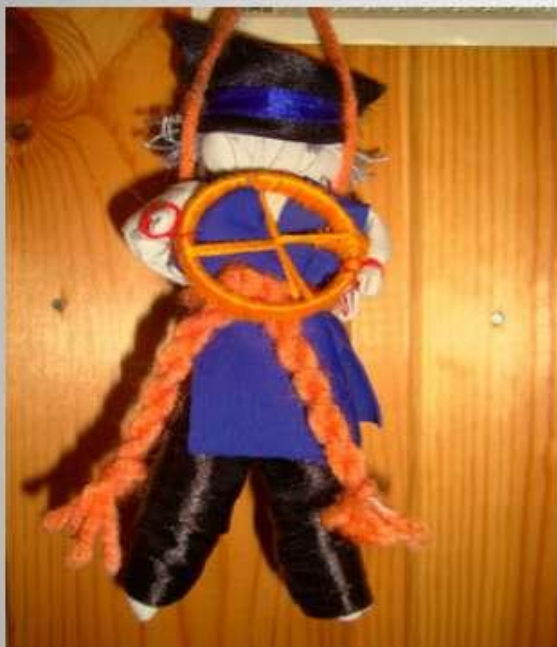
Спиридон - Солнцеворот