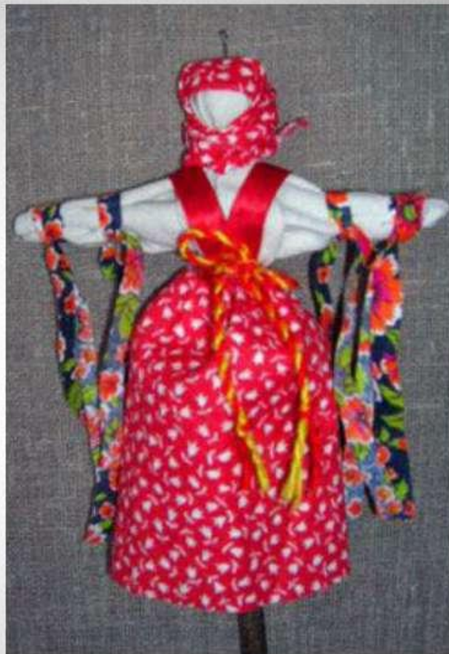
Кукла - Купавка