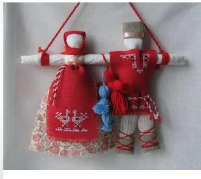
Куклы - Неразлучники