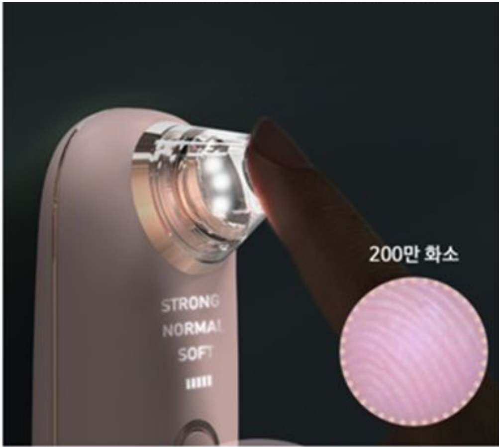
Smart Camera App