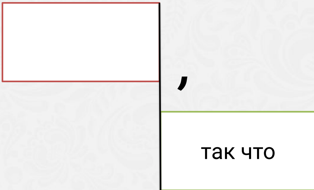
Схема придаточного следствия

В СПП придаточные следствия могут стоять только после главного предложения.