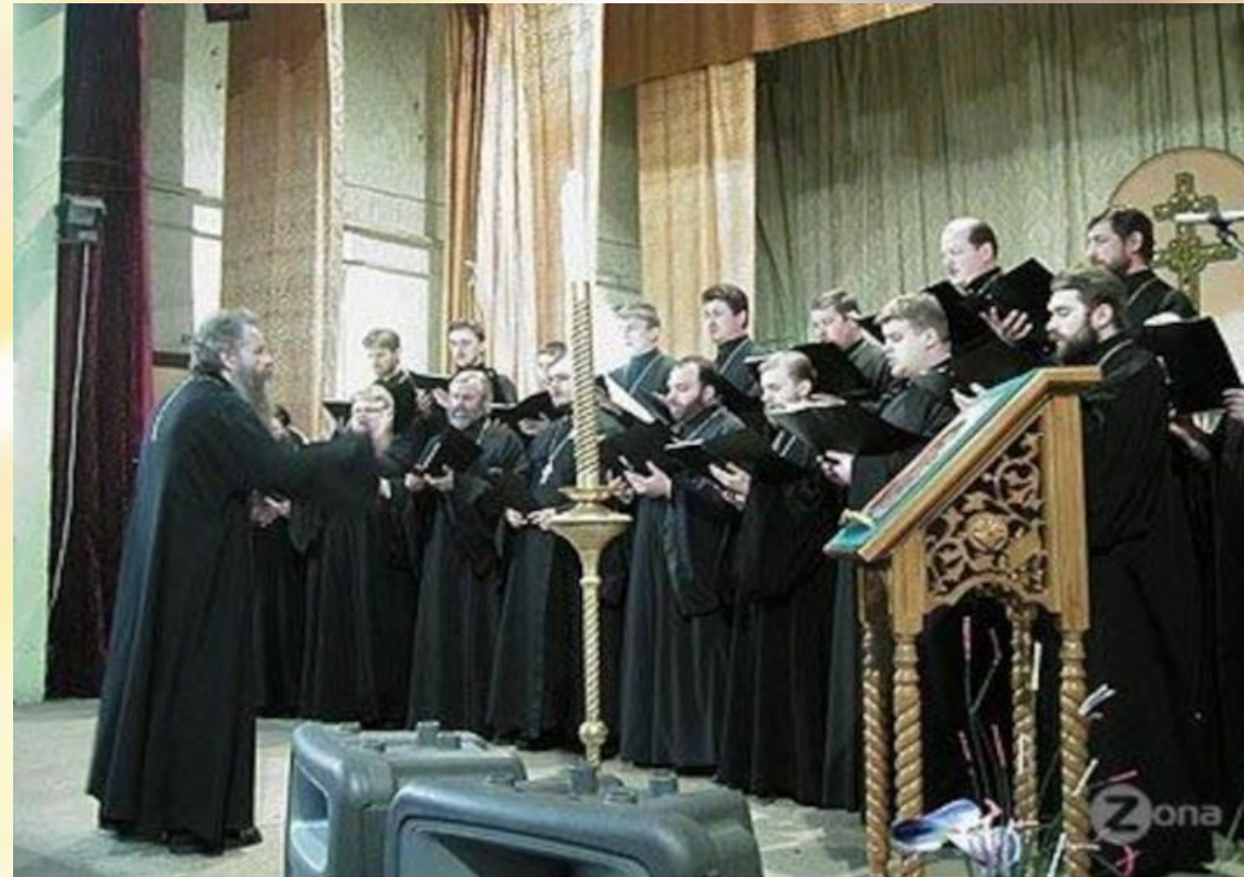
Партесное пение (лат. partes - голоса) - тип церковного пения, • в основе которого положено многоголосное хоровое исполнение композиции.