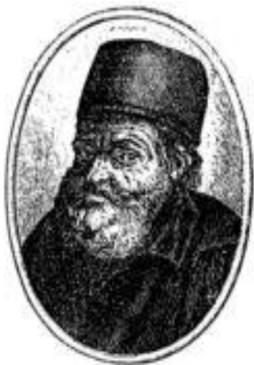
Nicolas Flamel 1330 — 1418