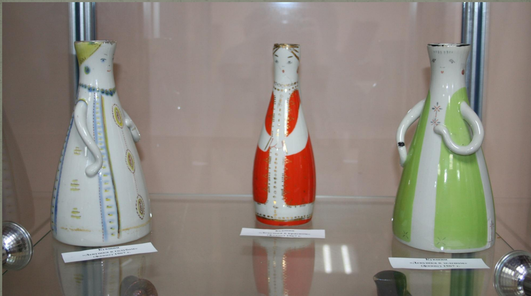
Кувшины «Девушки в голубых» Фабрика 1967 г.