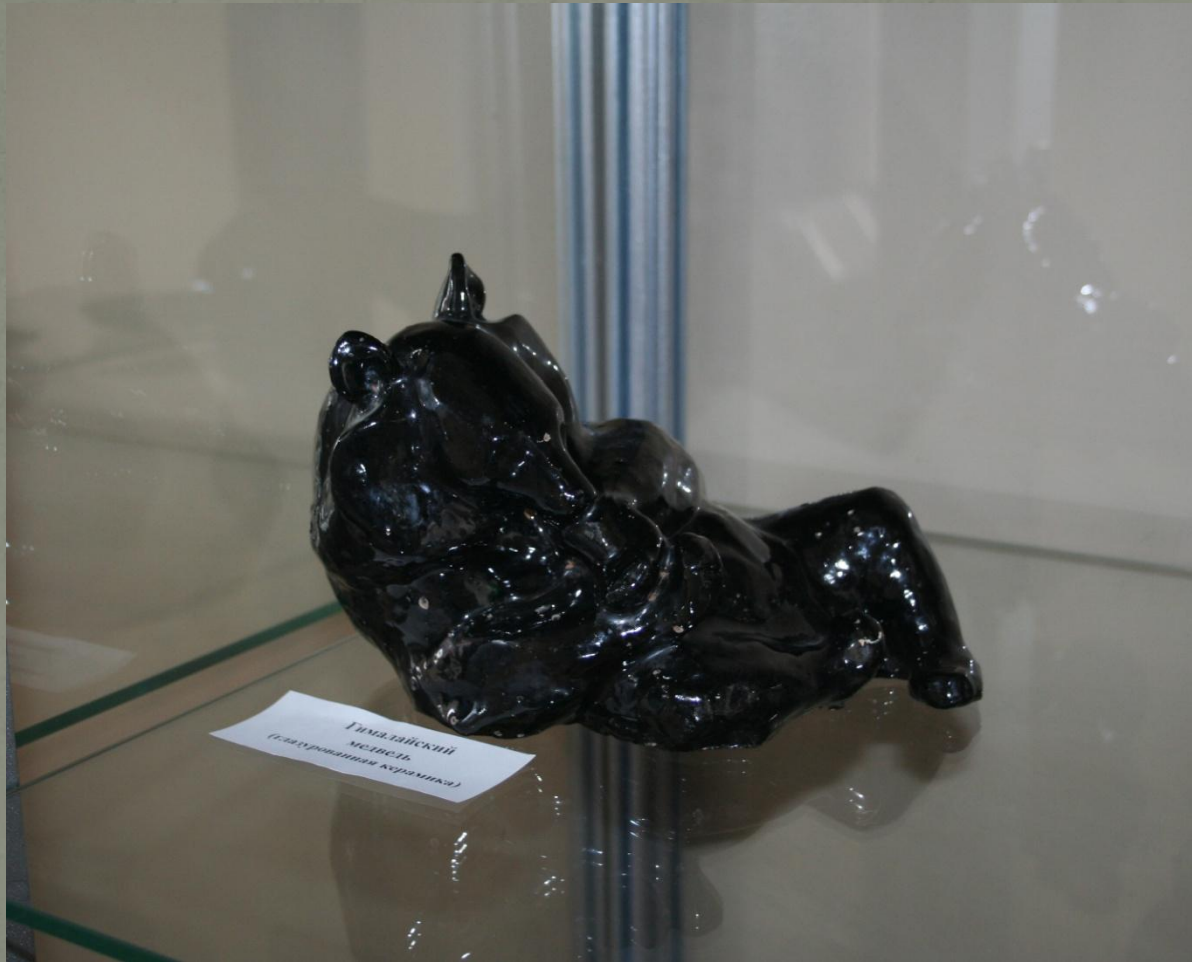
Гималайский медведь (керамическая керамика)