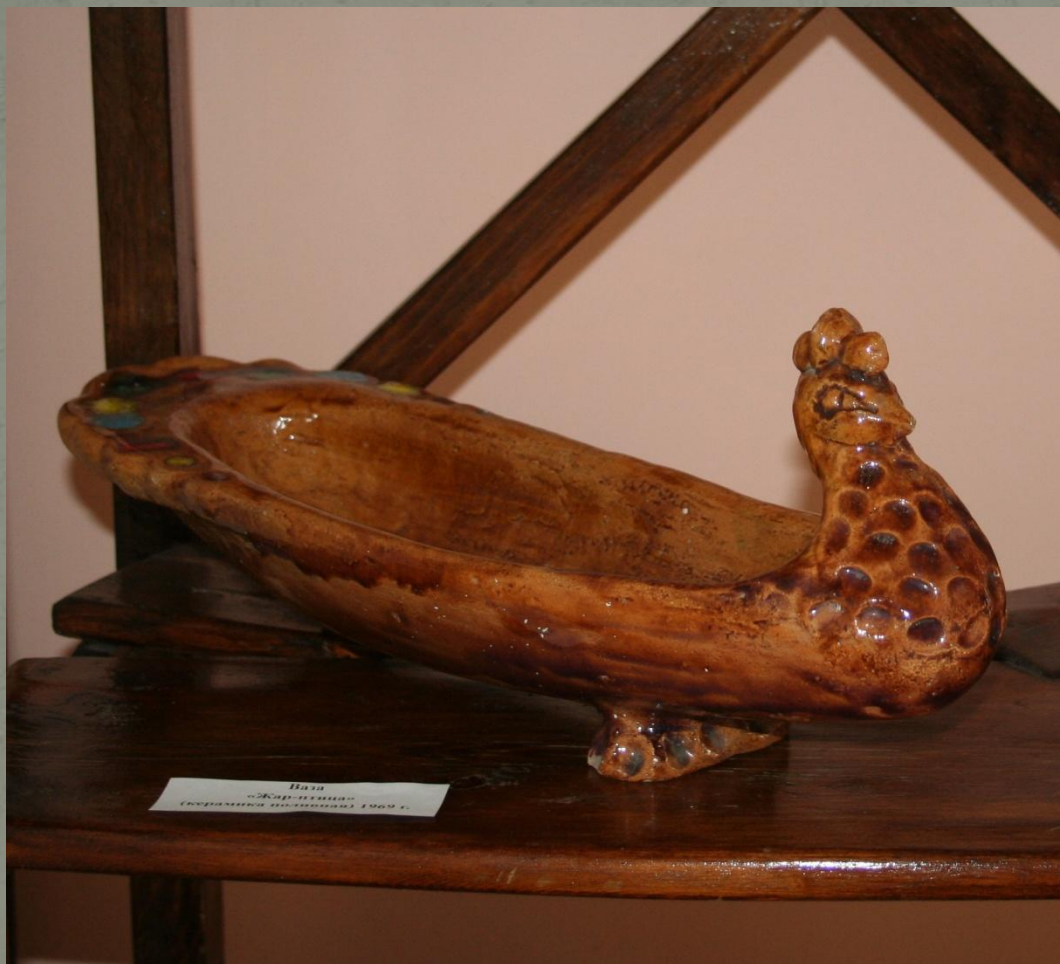
Ваза «Жар-птица» Секретарской коллекции ЕММХ.