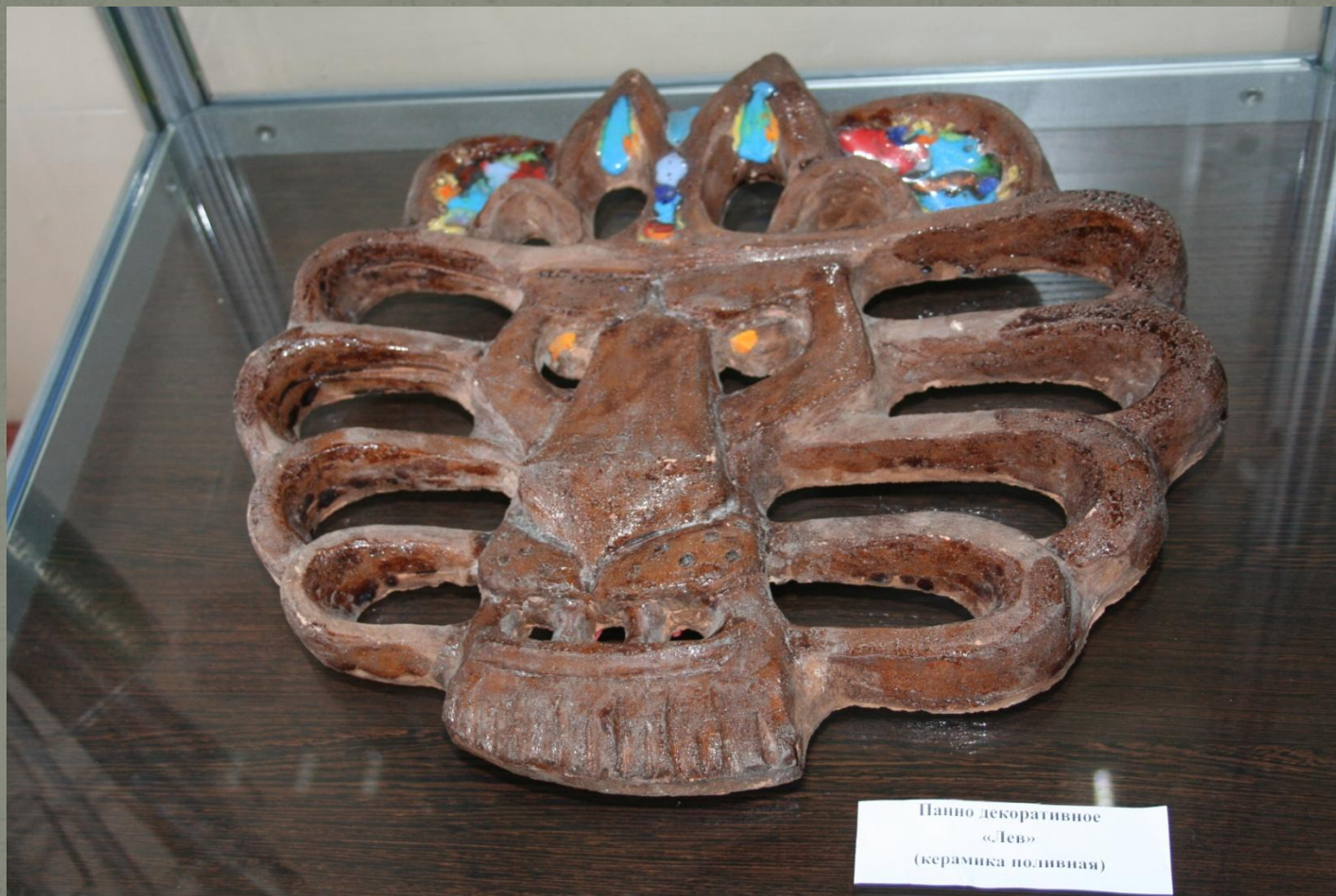
Панно декоративное «Лев» (керамика поливная)