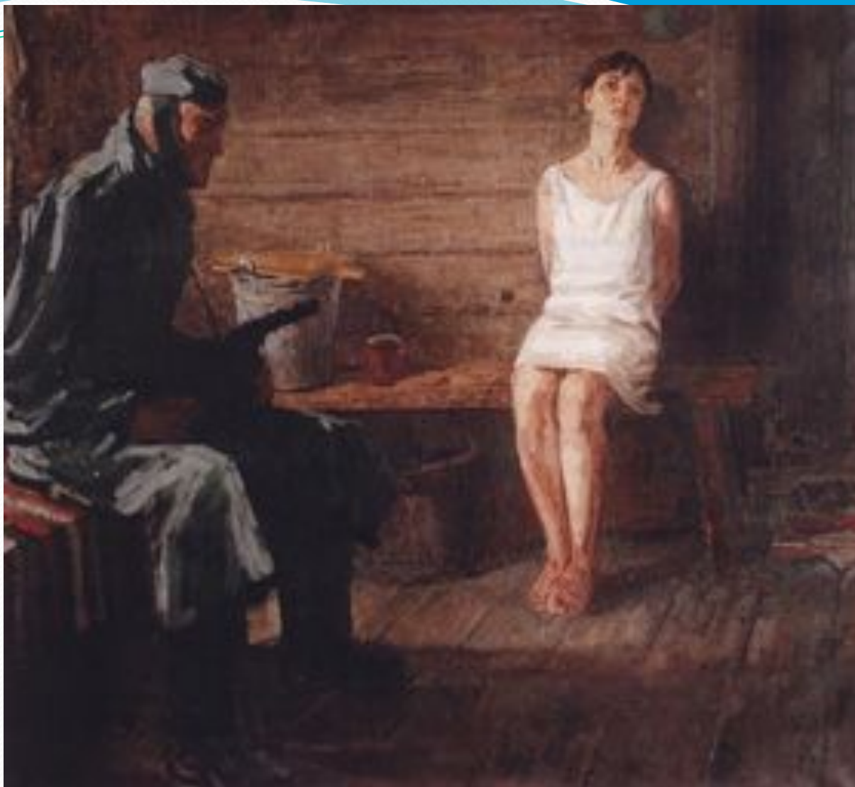
Щукин В.Г. Зоя Космодемьянская - холст, масло