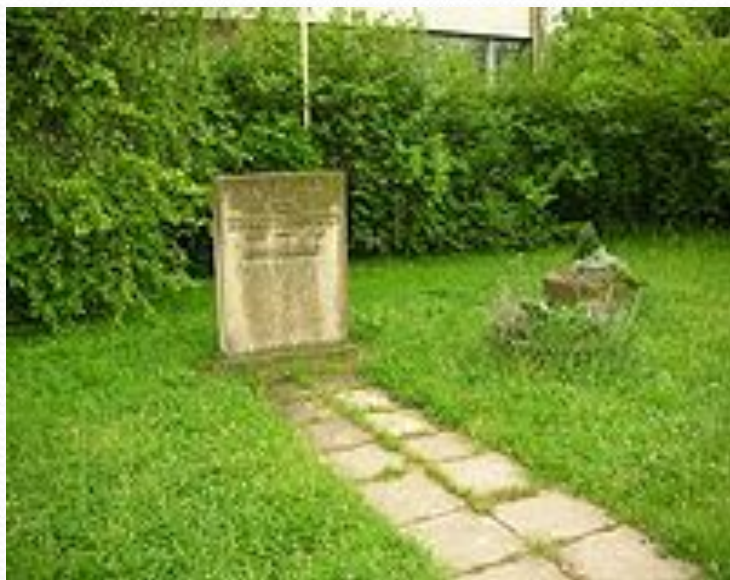
Обелиск в память Зои Космодемьянской перед 46 средней школой в г. Дрезден