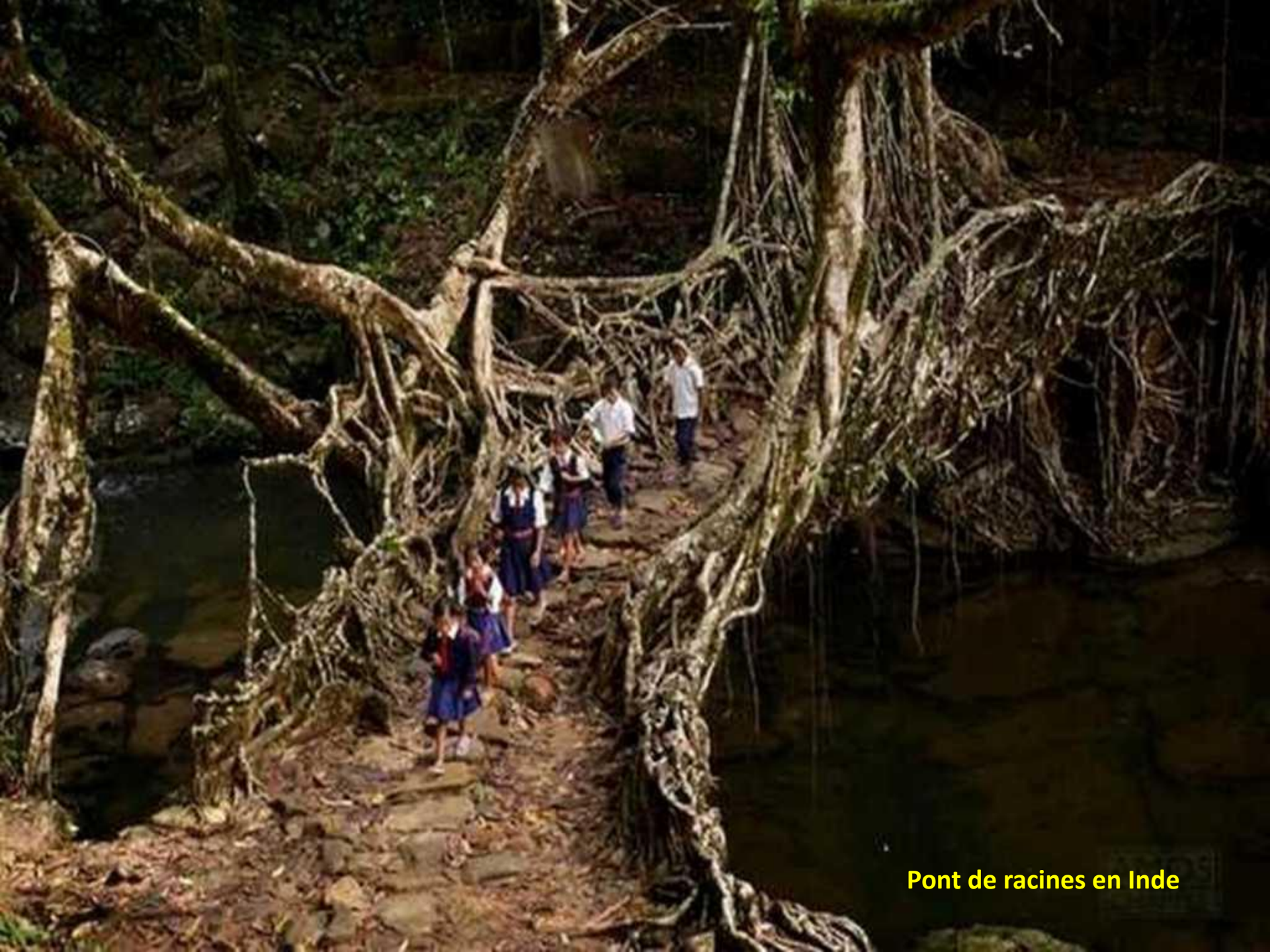
Pont de racines en Inde