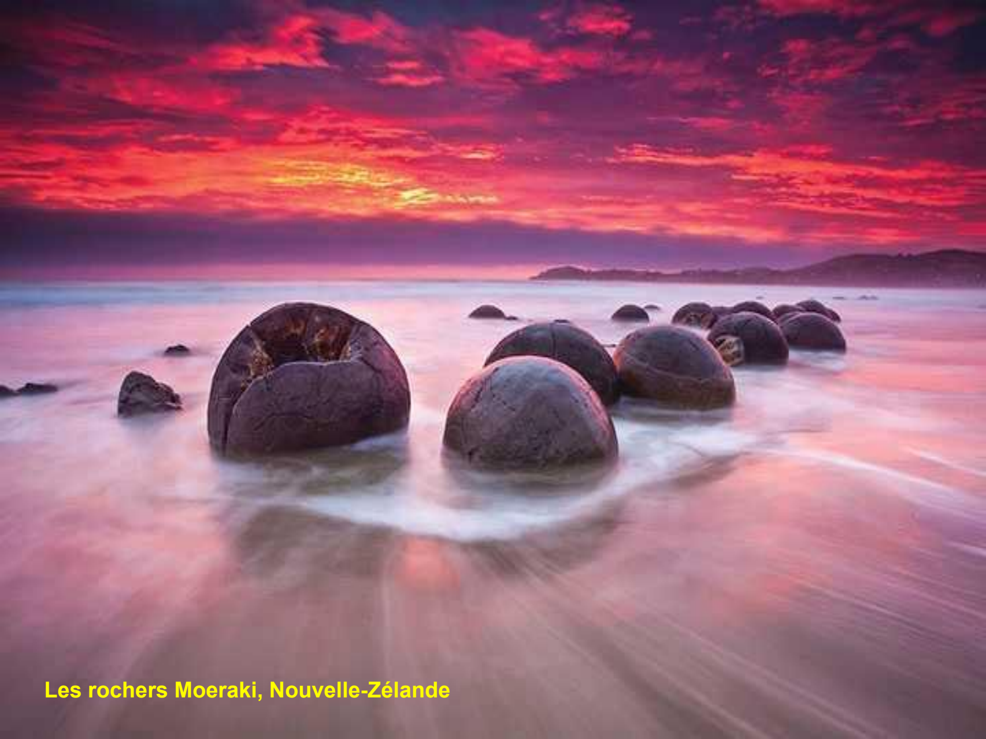
Les rochers Moeraki, Nouvelle-Zélande