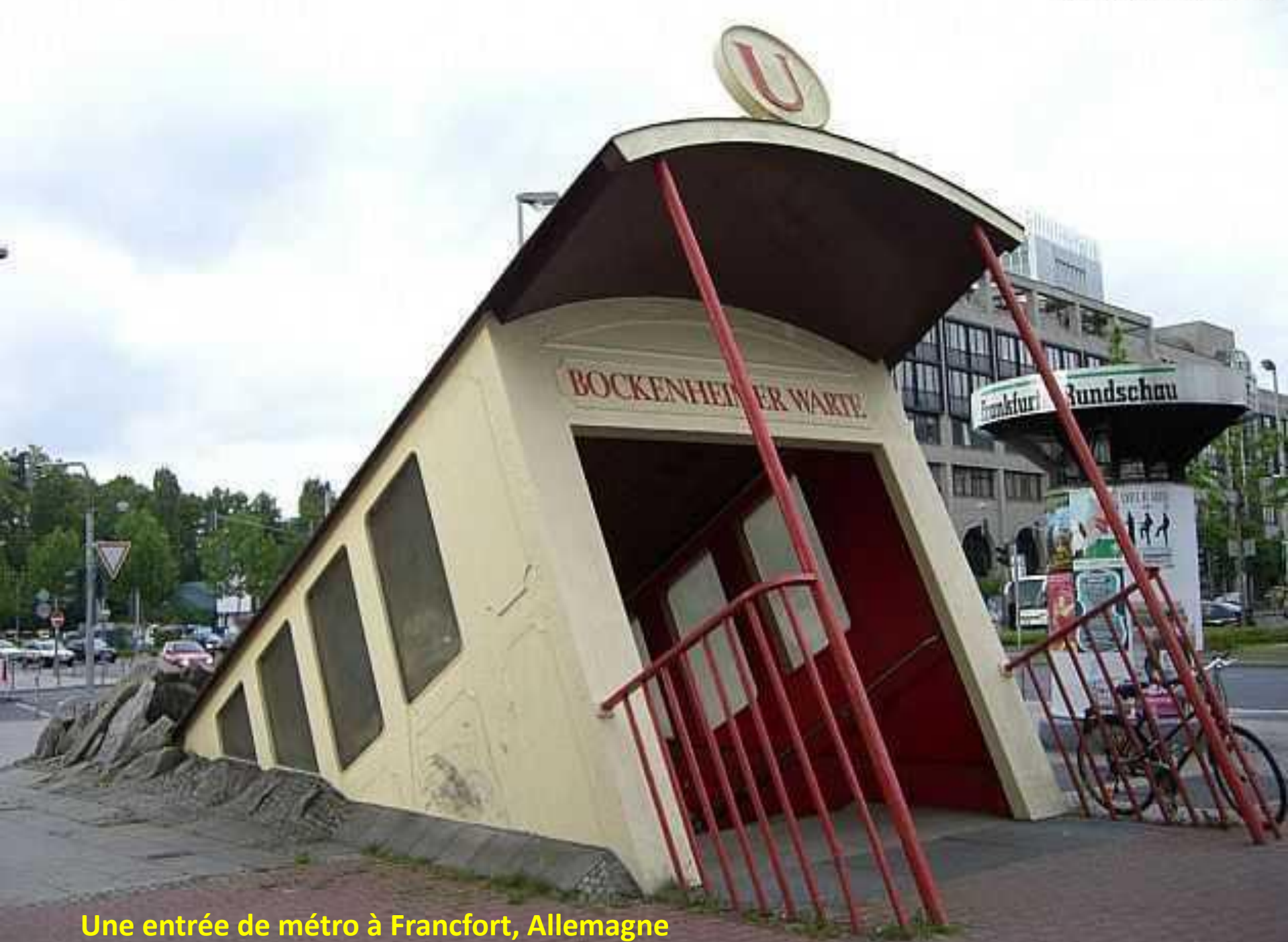
Une entrée de métro à Francfort, Allemagne