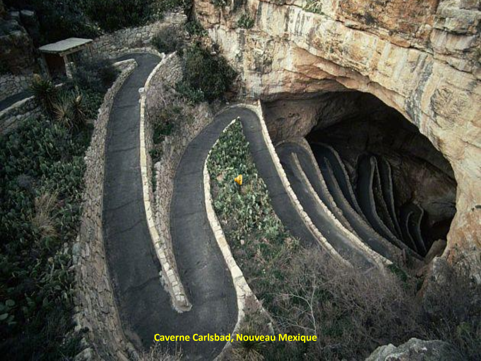
Caverne Carlsbad, Nouveau Mexique