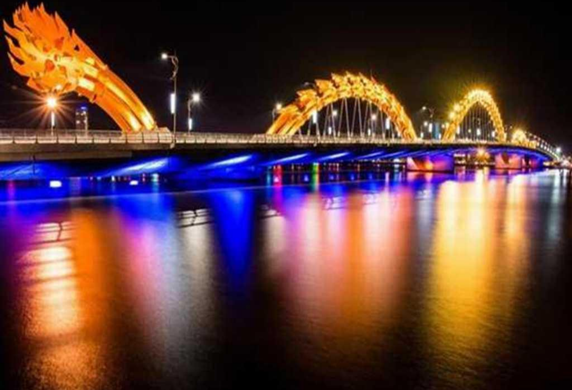
Pont Dragon à Da Nang, Vietnam