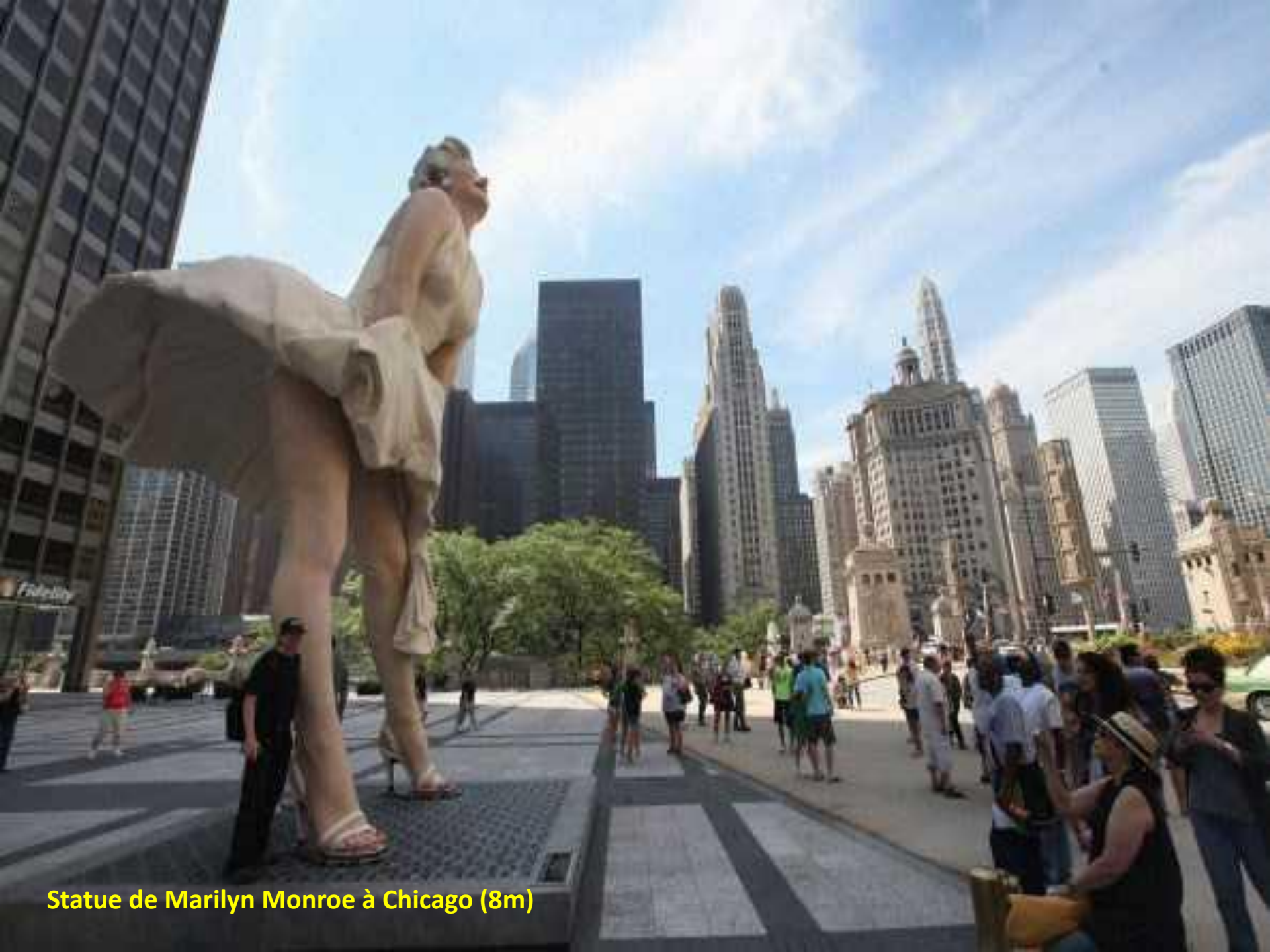
Statue de Marilyn Monroe à Chicago (8m)