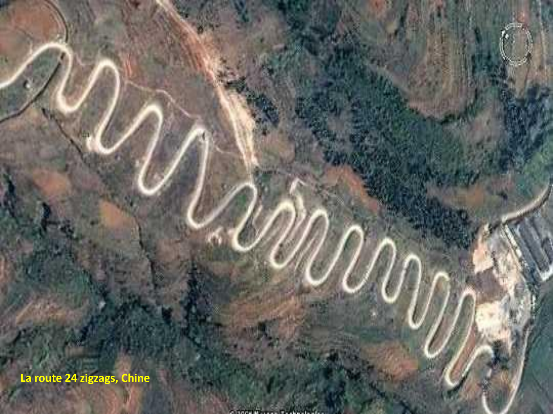
La route 24 zigzags, Chine