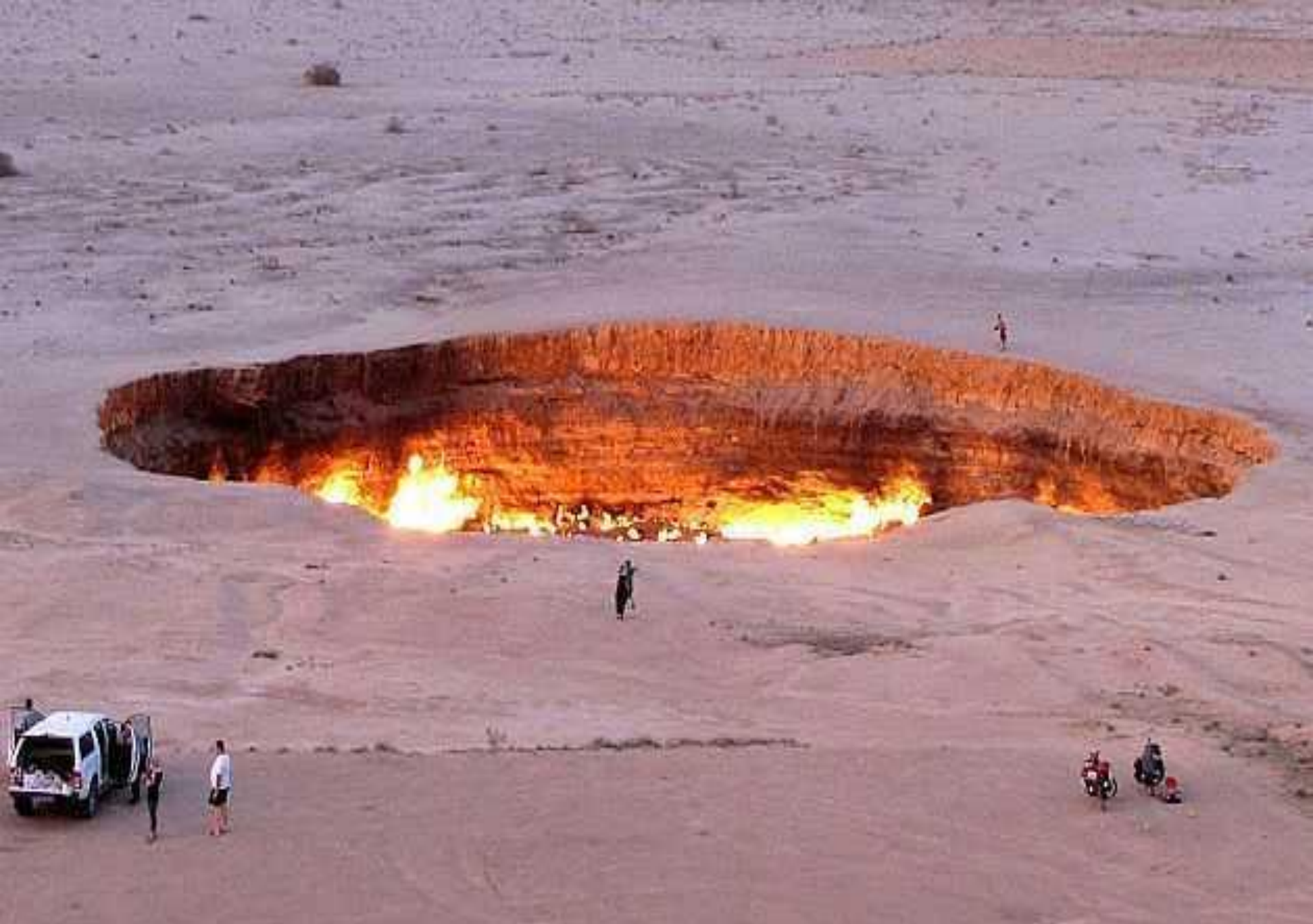
Les portes de l'enfer (dépôt de gaz) à Derweze, Turkmenistan