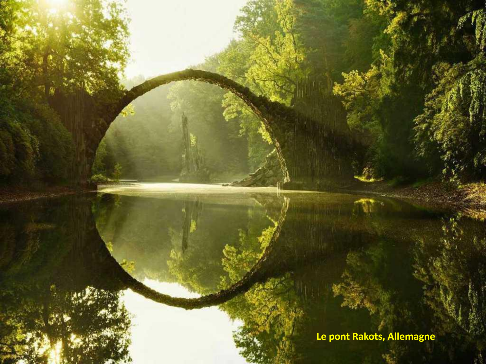
Le pont Rakots, Allemagne