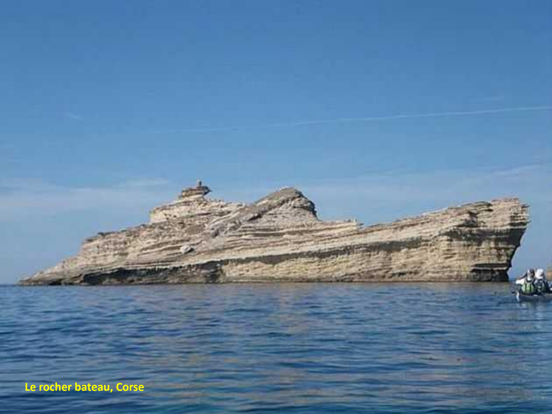
Le rocher bateau, Corse