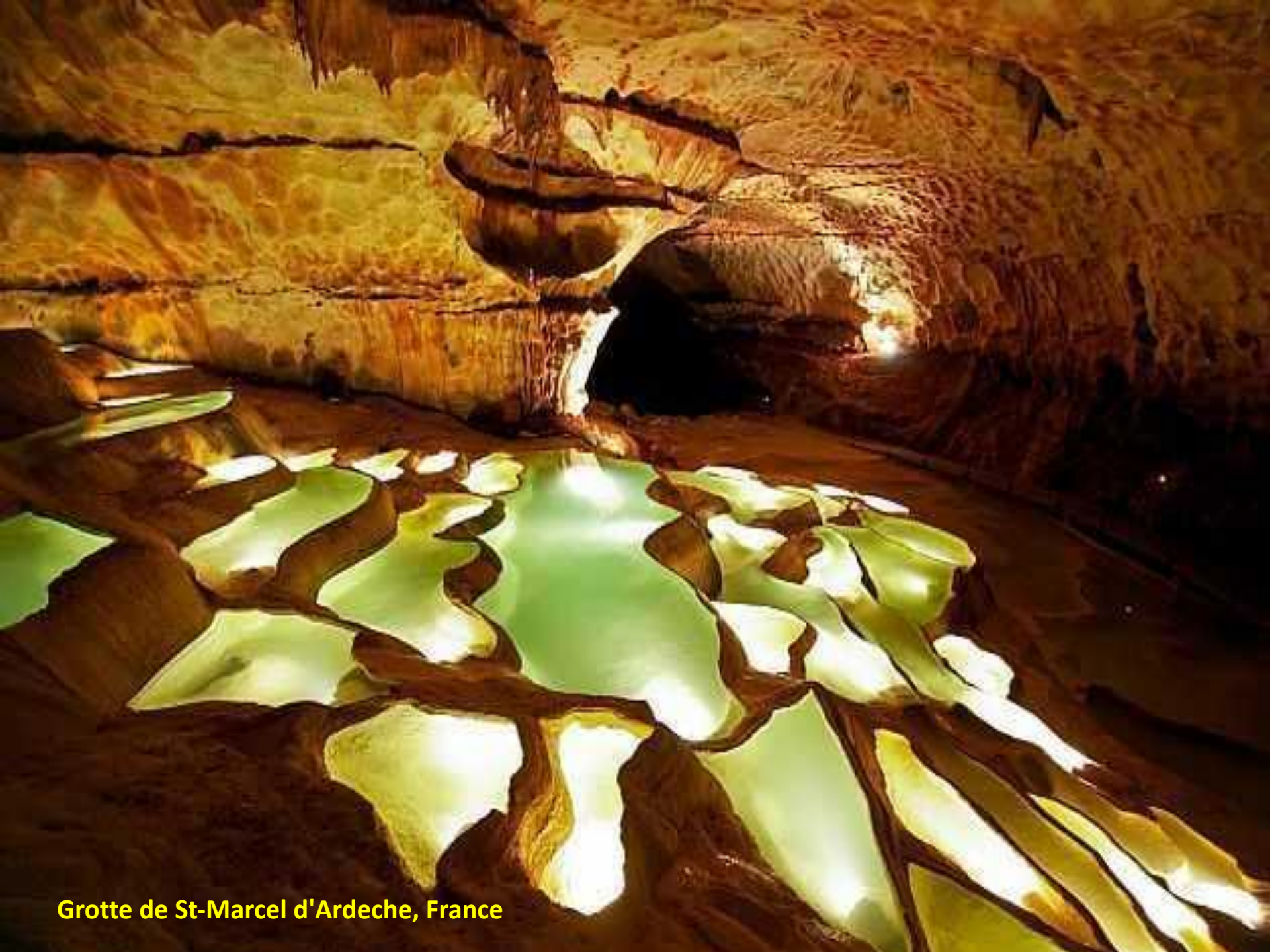
Grotte de St-Marcel d'Ardeche, France