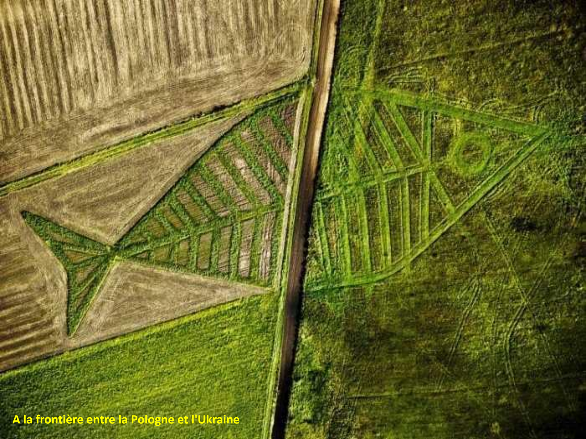
A la frontière entre la Pologne et l'Ukraine