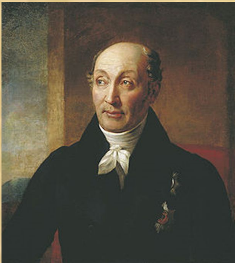
Михаил Михайлович Сперанский (1772 – 1839)

Карьера Михаила Сперанского в 1797 – 1808 гг.: