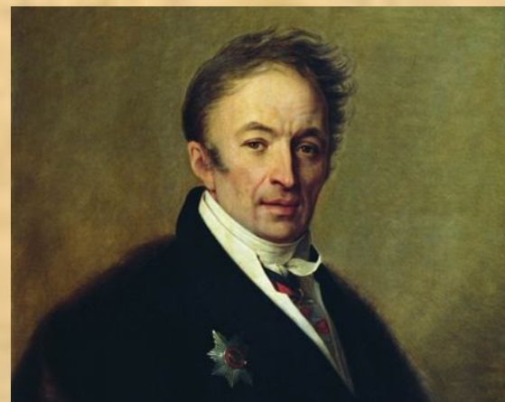
Николай Михайлович Карамзин (1766 – 1826), историк, писатель

Точку зрения консервативно настроенных кругов общества выразил Николай Михайлович Карамзин в своей «Записке о древней и новой России» .