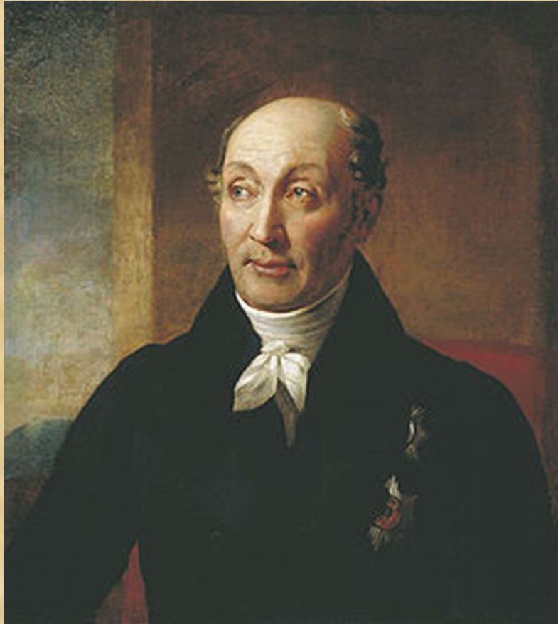
Михаил Михайлович Сперанский (1772 – 1839)

Какие положения проекта реформ М. М. Сперанского вы считаете главными?