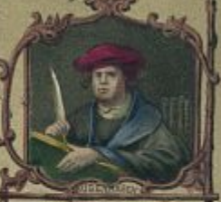
TO JOHN & SALOMON'S BROTHERS