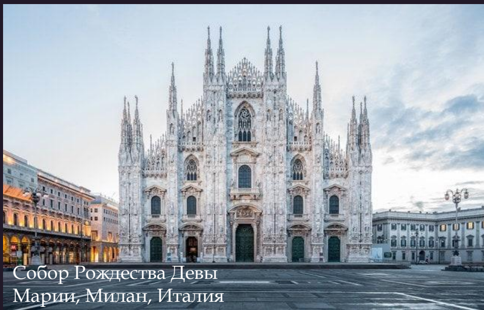
Собор Рождества Девы Марии, Милан, Италия

В середине XII века в Европе происходит скачок в развитии ремесла и техники. Параллельно расширяются города, формируются централизованные государства, зарождаются светские силы, смягчаются нравы. Соединение этих факторов повлияло на градостроительство того времени. Храмы, соборы, монастыри потянулись вверх к небу и Богу, возводятся каменные общественные и жилые здания. Появляется привычная нашим современникам мебель.