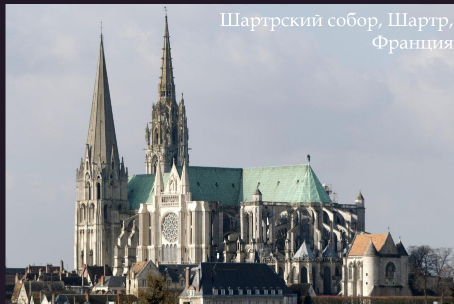
Шартрский собор, Шартр, Франция