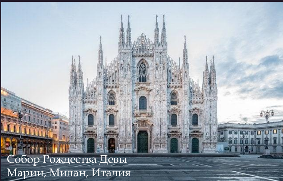
Собор Рождества Девы Марии, Милан, Италия

В середине XII века в Европе происходит скачок в развитии ремесла и техники. Параллельно расширяются города, формируются централизованные государства, зарождаются светские силы, смягчаются нравы. Соединение этих факторов повлияло на градостроительство того времени. Храмы, соборы, монастыри потянулись вверх к небу и Богу, возводятся каменные общественные и жилые здания. Появляется привычная нашим современникам мебель.