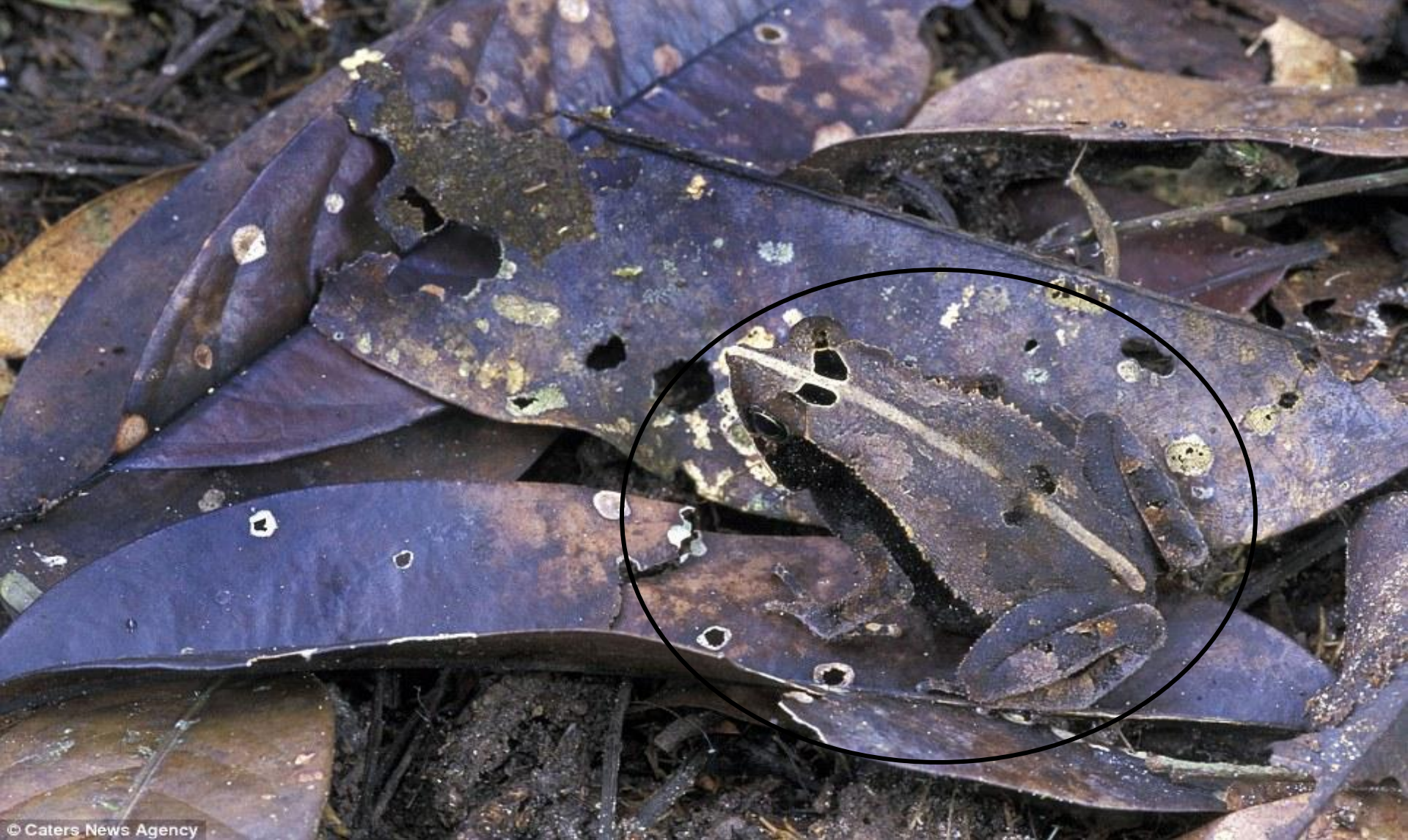
Un crapaud au visage chauve-souris se cache parmi les feuilles mortes dans le parc national amacayacu en Colombie.