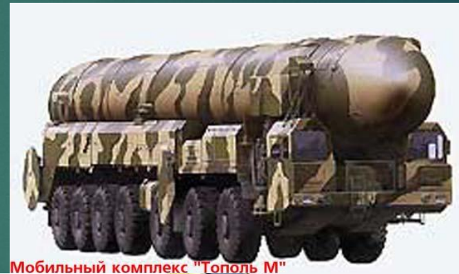
Мобильный комплекс "Тополь М"