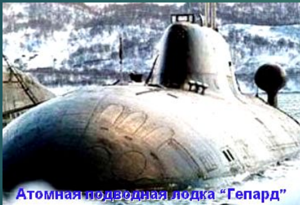
Атомная подводная лодка "Гепард"