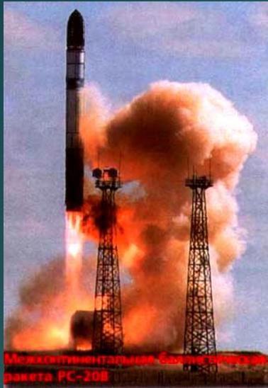
Межконтинентальная баллистическая ракета РС-20В