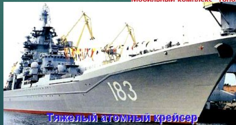
Тяжелый атомный крейсер