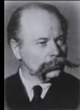
Статья К.Н. Корнилова «Воспитание моральных качеств»

Абсолютное большинство работ данного направления выполнено на основе бесед с фронтовиками, анализа героических подвигов советских воинов, запечатленных в различных документах.