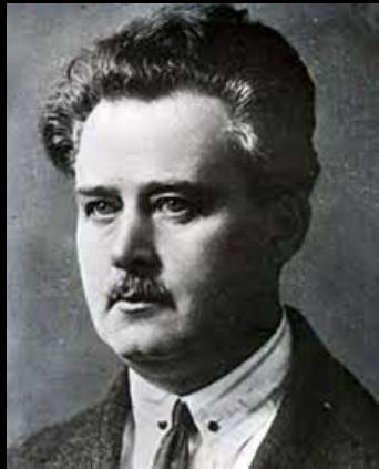
М.М. Рубинштейна «Смелость и ее воспитание»

Одним из важных направлений в работе психологов в годы Великой Отечественной войны были поиски психологически обоснованных путей формирования у воинов высоких морально-политических и боевых качеств, анализ психологических основ воспитания и обучения личного состава. В числе работ этого направления были: