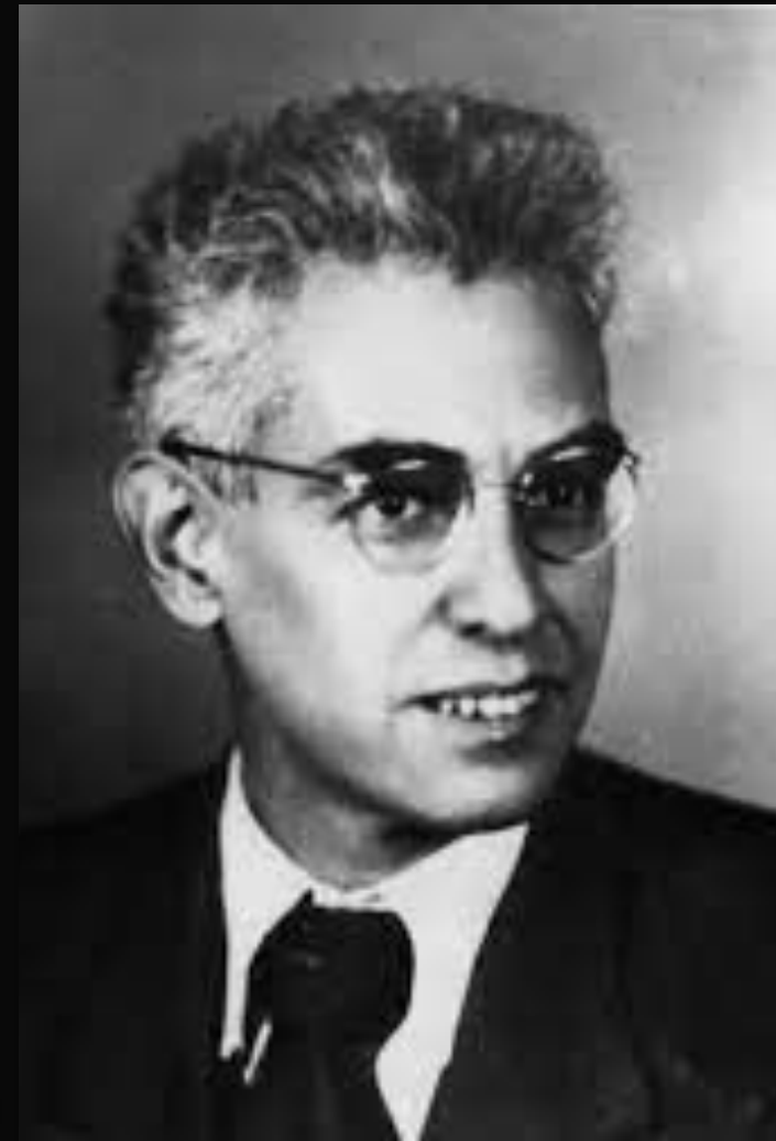
Александр Романович Лурия

Существенным образом изменялись и задачи психологов, работавших в области практического здравоохранения и посттравматической реабилитации . Если в мирное время основная задача состояла в том, чтобы в ходе всестороннего изучения больного установить "малейшие функциональные и органические изменения в организме" для проведения профилактики, то в военных условиях, когда речь идет по существу о здоровом, но получившем травму человеке, задача заключается в установлении того, "насколько раненый или больной боец может, вернувшись в ряды армии, в строй или на нестроевую работу, выполнять свой долг перед страной в грозные годы Великой Отечественной войны" Возглавил работу А.Р. Лурия