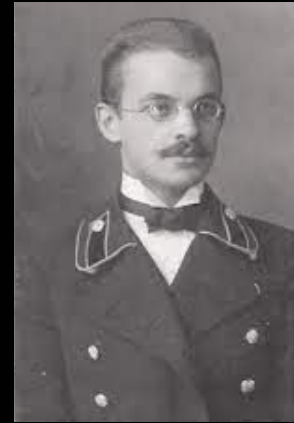
Н.Д. Левитова «Воля и характер бойца»