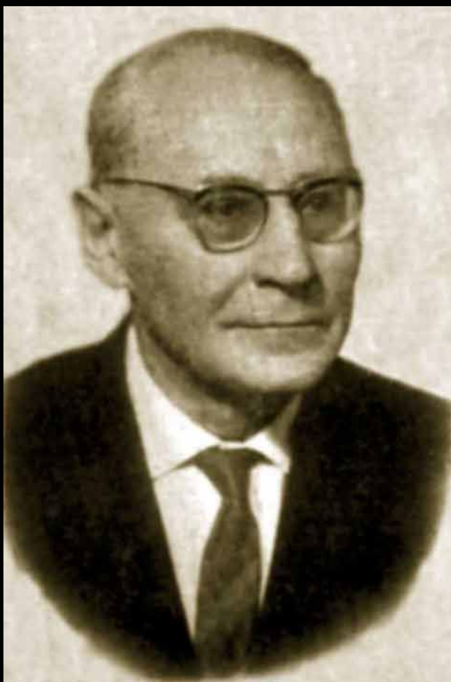
Мясищев Владимир Николаевич