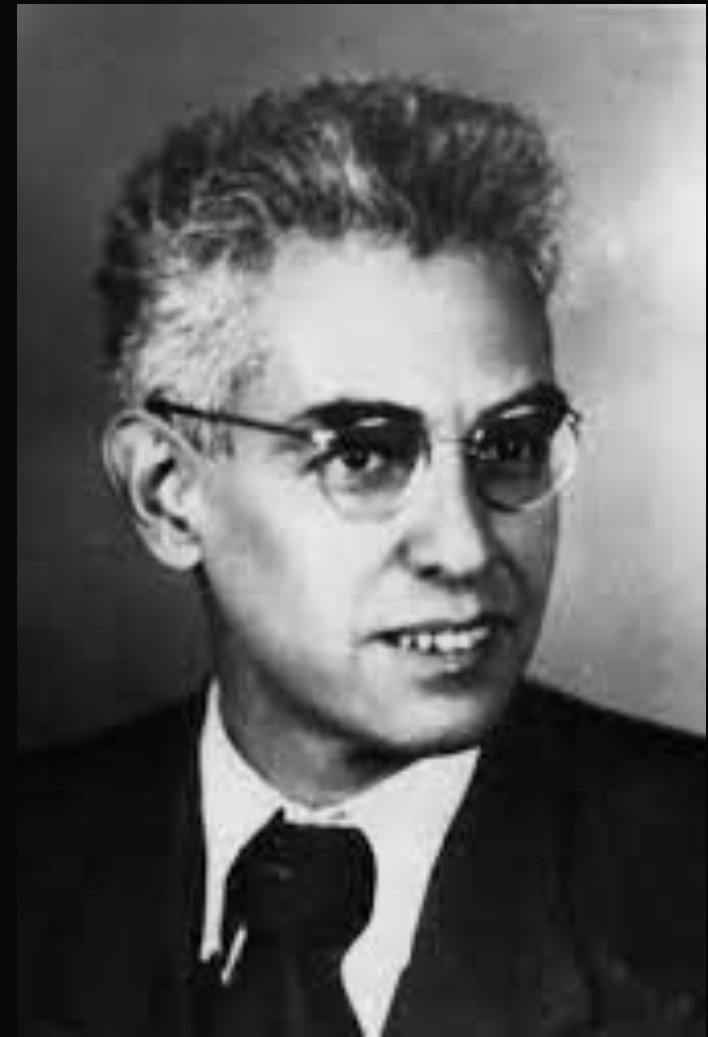
Александр Романович Лурия

Существенным образом изменялись и задачи психологов, работавших в области практического здравоохранения и посттравматической реабилитации . Если в мирное время основная задача состояла в том, чтобы в ходе всестороннего изучения больного установить "малейшие функциональные и органические изменения в организме" для проведения профилактики, то в военных условиях, когда речь идет по существу о здоровом, но получившем травму человеке, задача заключается в установлении того, "насколько раненый или больной боец может, вернувшись в ряды армии, в строй или на нестроевую работу, выполнять свой долг перед страной в грозные годы Великой Отечественной войны" Возглавил работу А.Р. Лурия