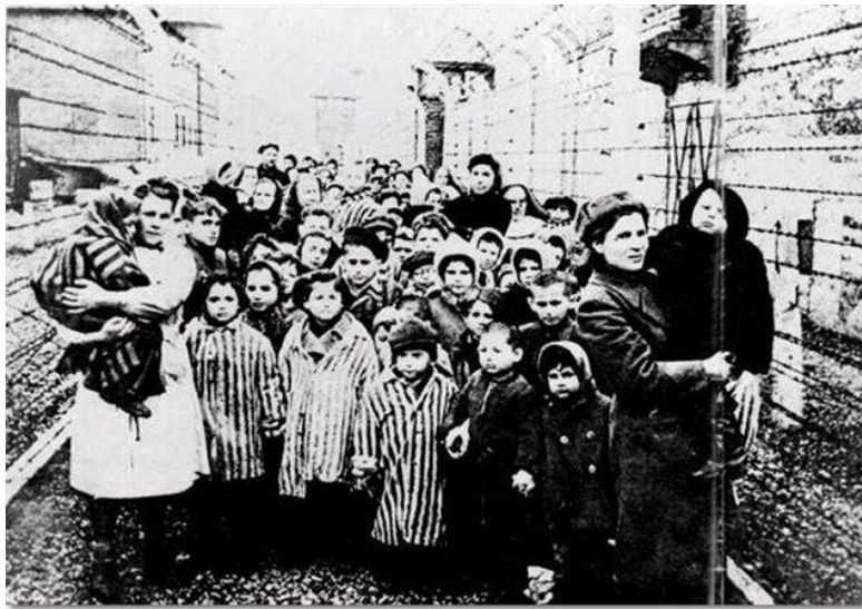
Освобожденные узники Освенцима