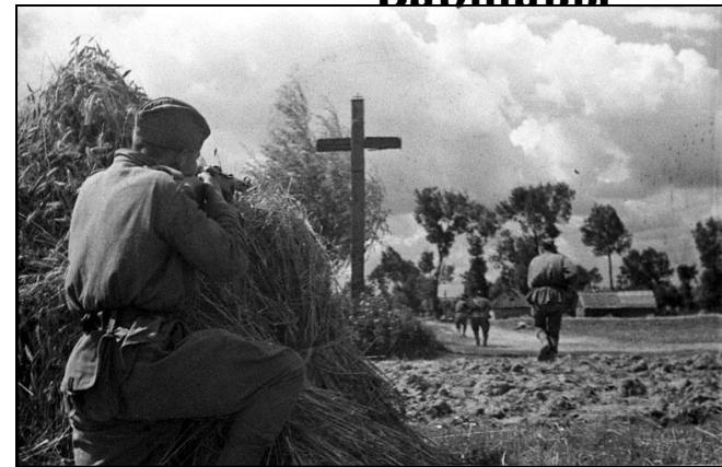
Бои у г. Познань