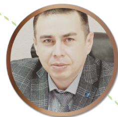
Игнатьичев Алексей Иванович Начальник управления образования Администрации Княгининского мун. района