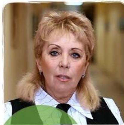
Романова Клара Заслуженный эколог России