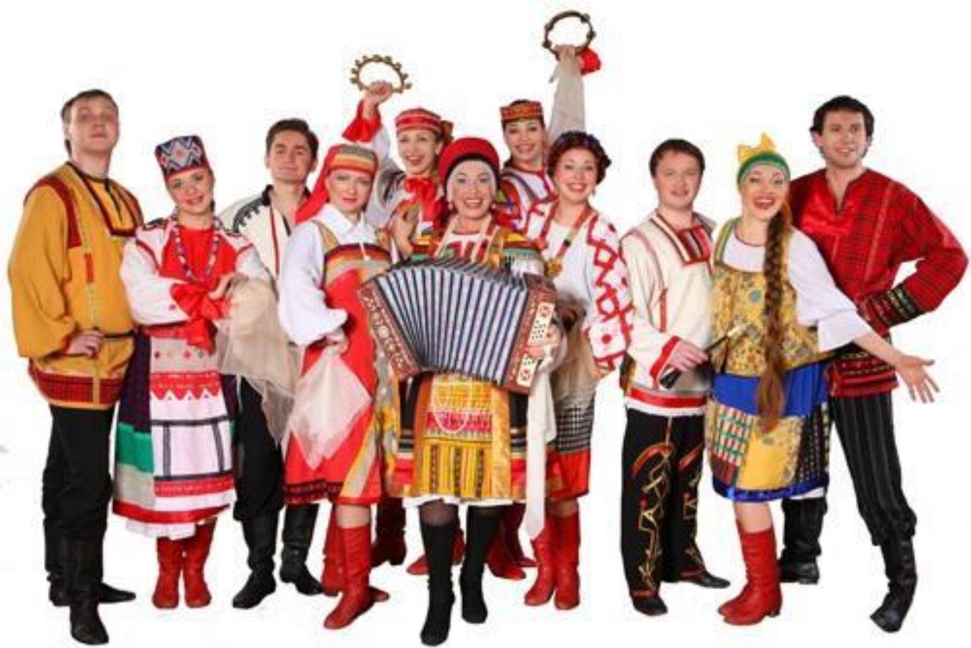
Надежда Бабкина и ансамбль «Русская досица»