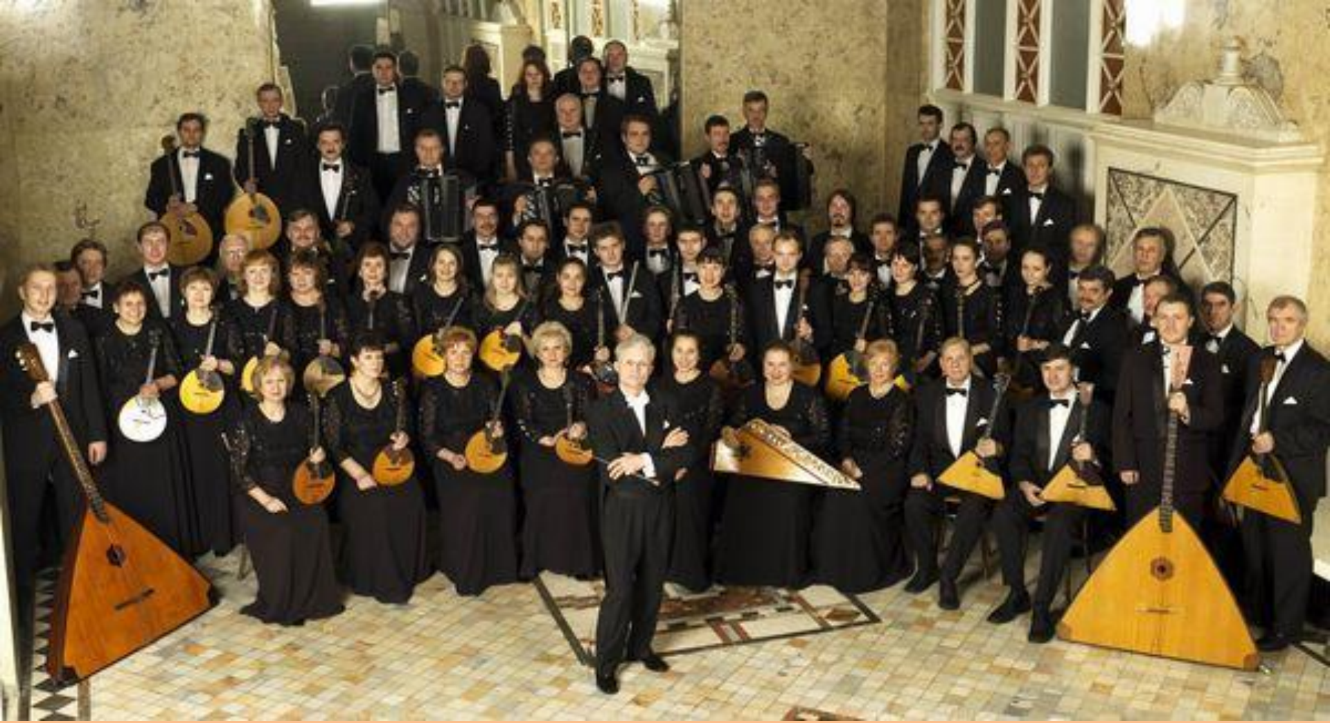
Академический Русский Народный Оркестр имени Н.П.Осипова