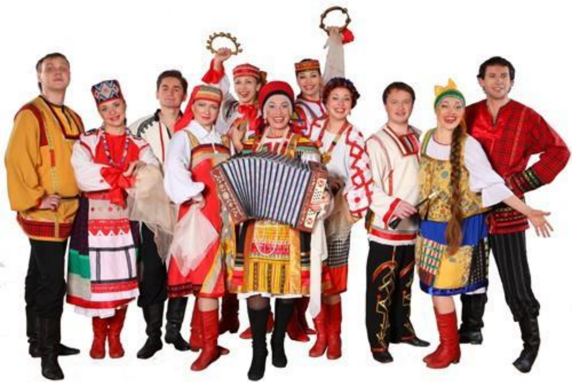
Надежда Бабкина и ансамбль «Русская досида»