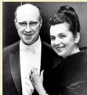
Ростропович и Галина Вишневская, 1965 год