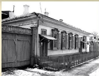
Дом Ростроповичей в Оренбурге