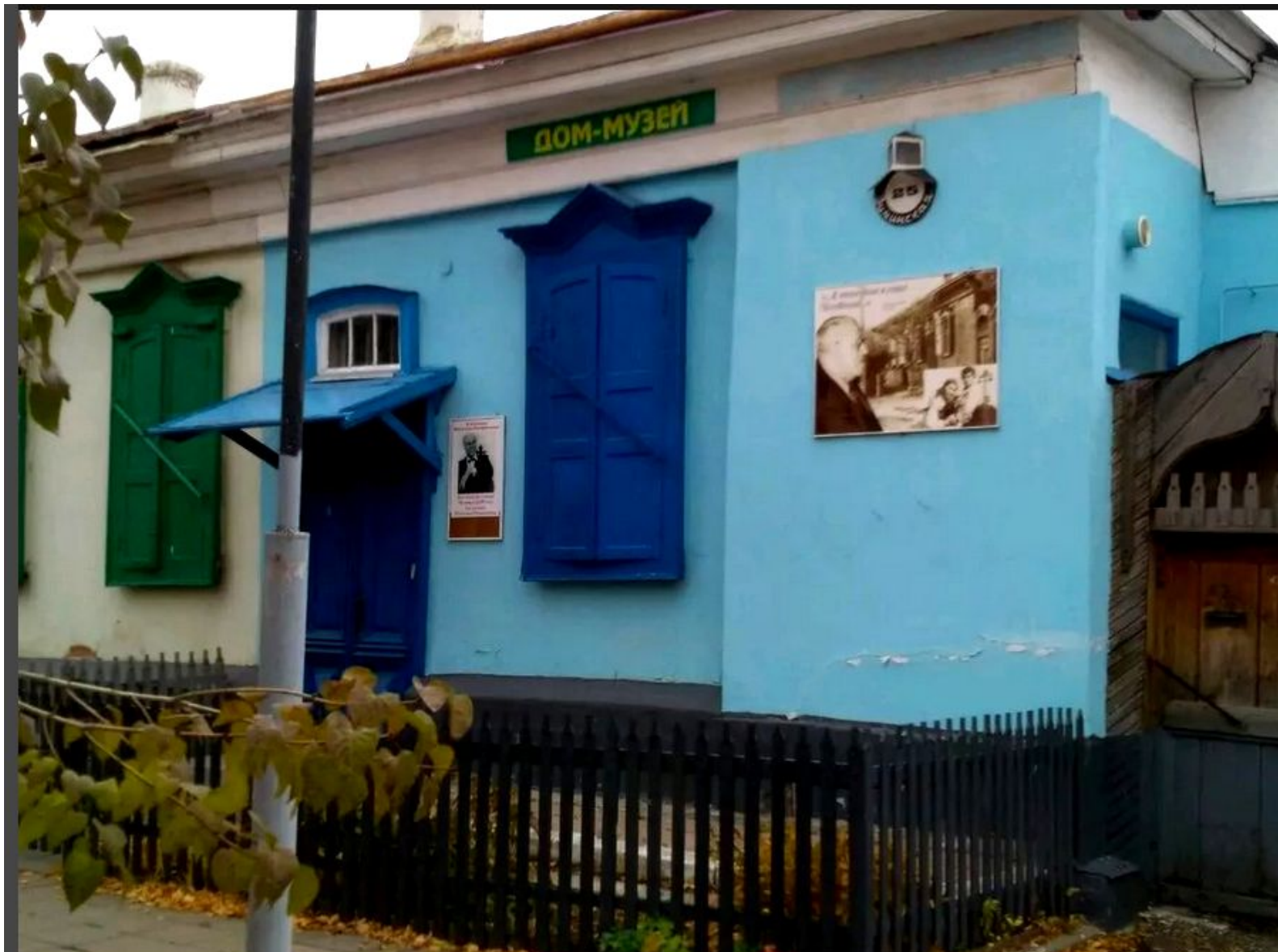
Вход в музей