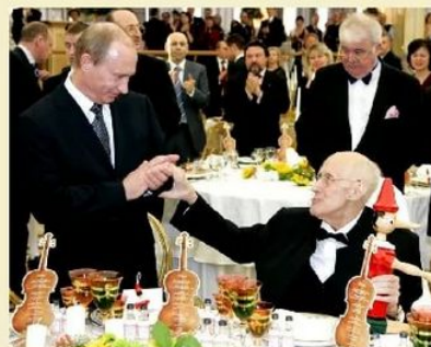
Награду вручает В.Путин