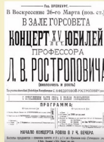
Афиша юбилейного концерта Л.В. Ростроповича в Оренбурге.