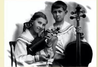
Вероника и Мстислав Ростроповичи