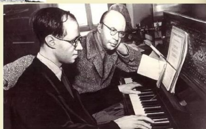
Мстислав Ростропович и Сергей Сергеевич Прокофьев