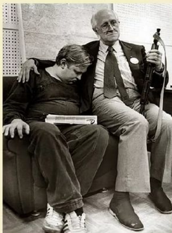
Фото «охранника», спящего на плече маэстро, август 1991 г