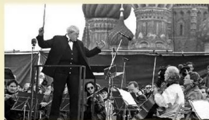
На Красной площади