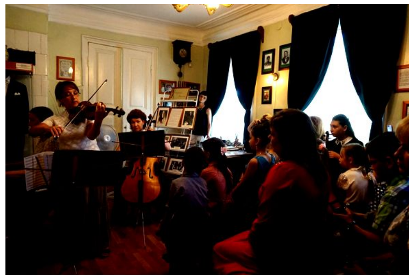
Концерт в музее