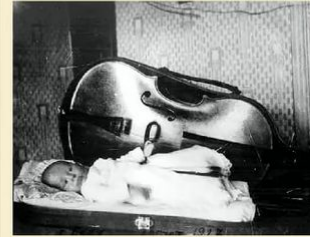
Мстислав Ростропович, Баку, август 1927 года