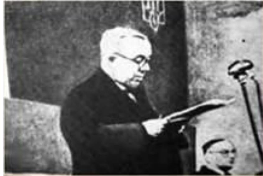
А. Волошин проголошує незалежність Карпатської України. 15 березня 1939 р.