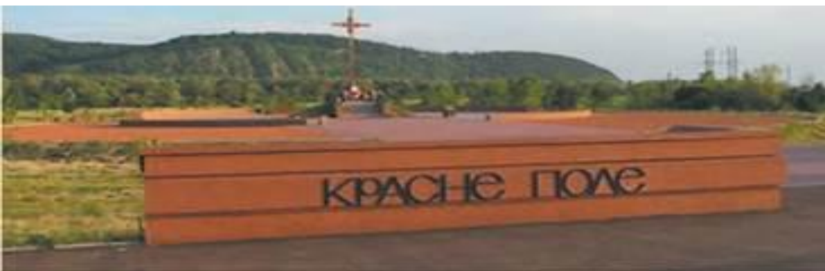
Меморіал на Красному полі (Закарпатська область).