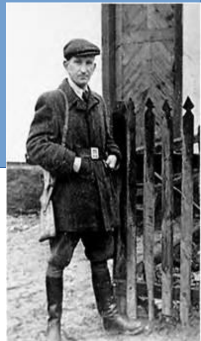
Роман Шухевич — командир УПА.

14 жовтня 1942 р.* у лісах Полісся була створена Українська повстанська армія (УПА). Вона вела боротьбу як проти Німеччини, так і проти сталінського режиму, що почав відновлюватися в Україні з 1943 р. У 1944 р. УПА налічувала приблизно 100 тисяч бійців. Вона звільнила від окупантів значні райони на Правобережжі, ІВолині та в Галичині.