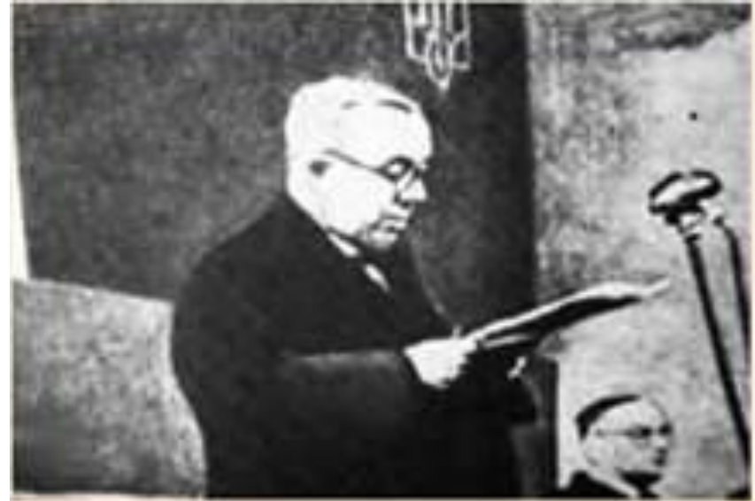
А. Волошин проголошує незалежність Карпатської України. 15 березня 1939 р.