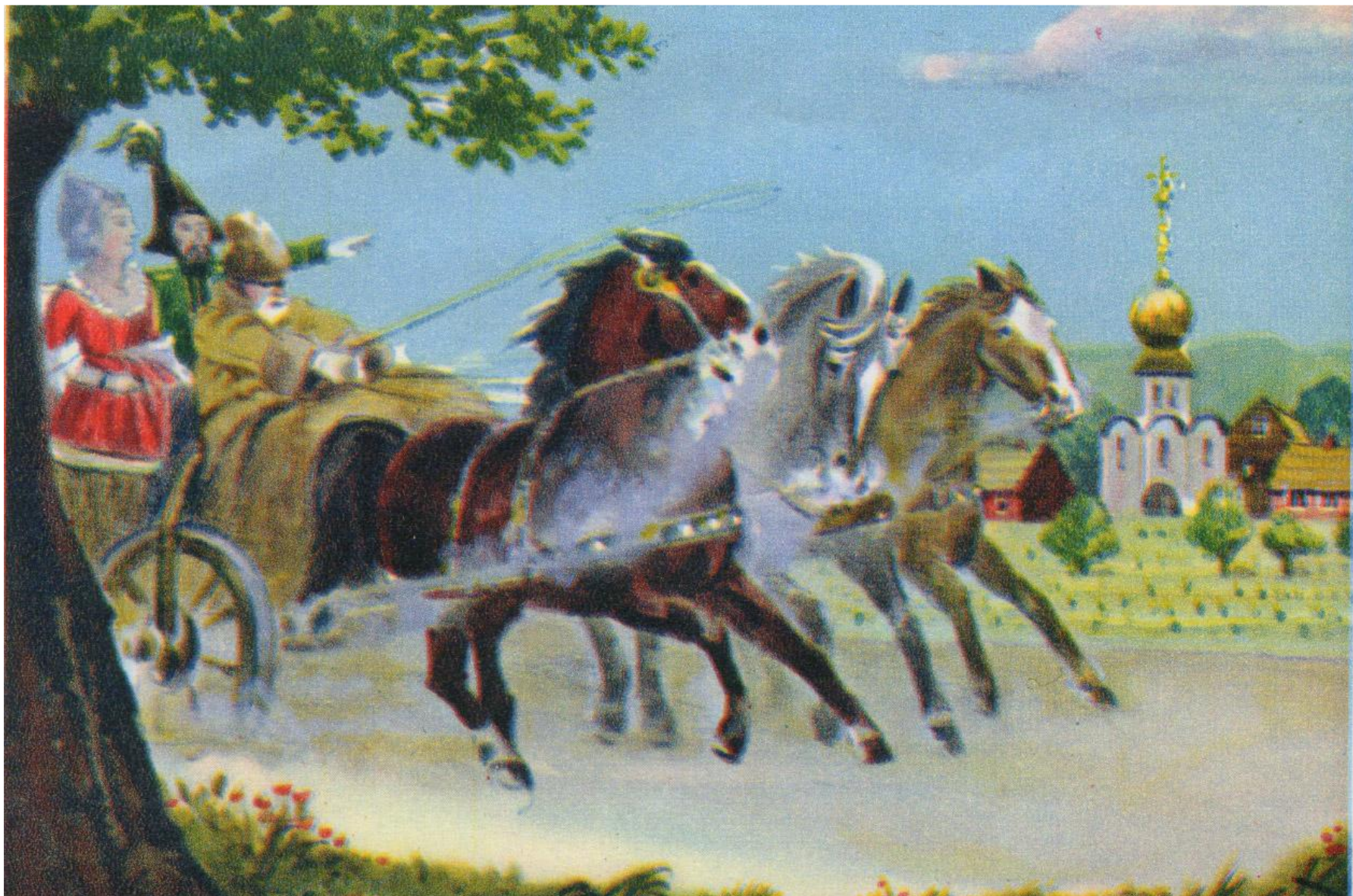
Григорий Потемкин показывает Екатерине II мнимые поселения