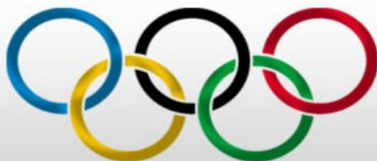
Первый российский Олимпийский чемпион - Николай Панин-Коломенкин