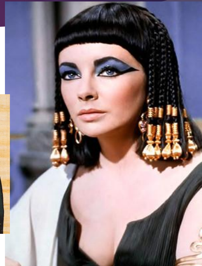
Элизабет Тейлор в роли Клеопатры, 1963 год