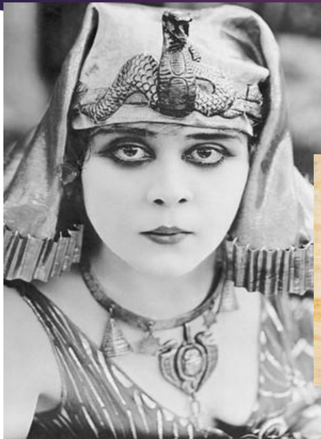
Теда Бара в роли Клеопатры, 1930 год