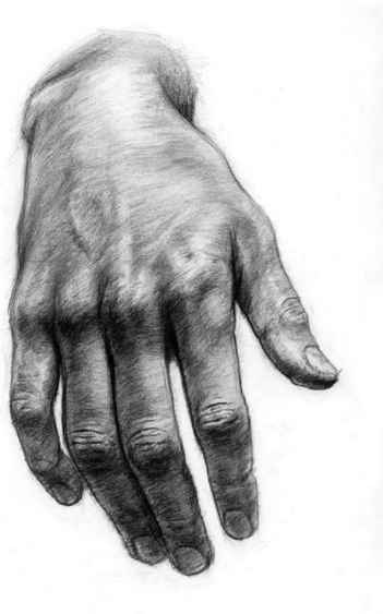
Рисунок кистей рук

Министерство науки и высшего образования Российской Федерации федеральное государственное бюджетное образовательное учреждение высшего образования «Санкт-Петербургский государственный университет промышленных технологий и дизайна» Инженерная школа одежды (колледж)