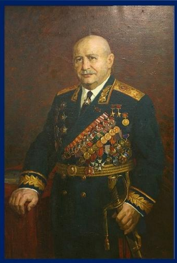
Иван Христофорович Баграмян (1897-1982)

Войска под командованием маршала Ивана Христофоровича Баграмяна участвовали активно в разгроме немецко-фашистских войск на Курской дуге, в Белорусской, Прибалтийской, Восточно-Прусской и других операциях и в овладении крепостью Кенигсберг.