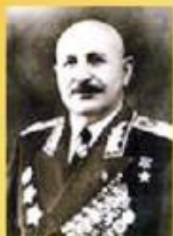
Баграмян Иван Христофорович (1897-1982)