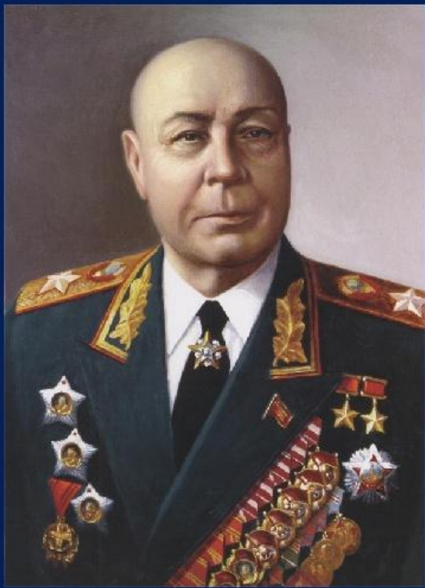
Тимошенко Семён Константинович (1895-1970)

Испытав на себе весь гнев Сталина в первые дни кошмарных провалов на фронтах, Тимошенко Семён Константинович попросил направить его на наиболее опасный участок. Впоследствии маршал командовал стратегическими направлениями и фронтами. Под его командованием шли тяжелые оборонительные бои на территории Белоруссии в июле - августе 1941 года. С его именем связаны героическая оборона Могилева и Гомеля, контрудары под Витебском и Бобруйском. Под руководством Тимошенко развернулось самое большое и упорное сражение первых месяцев войны - Смоленское. В июле 1941 г. войска Западного направления под командованием маршала Тимошенко остановили наступление группы армий "Центр" ..