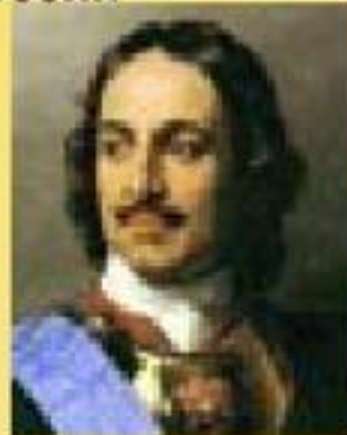
Пётр Первый Великий (1672-1725)