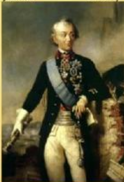
Суворов Александр Васильевич (1730-1800)

русский полководец, один из основоположников русского военного искусства