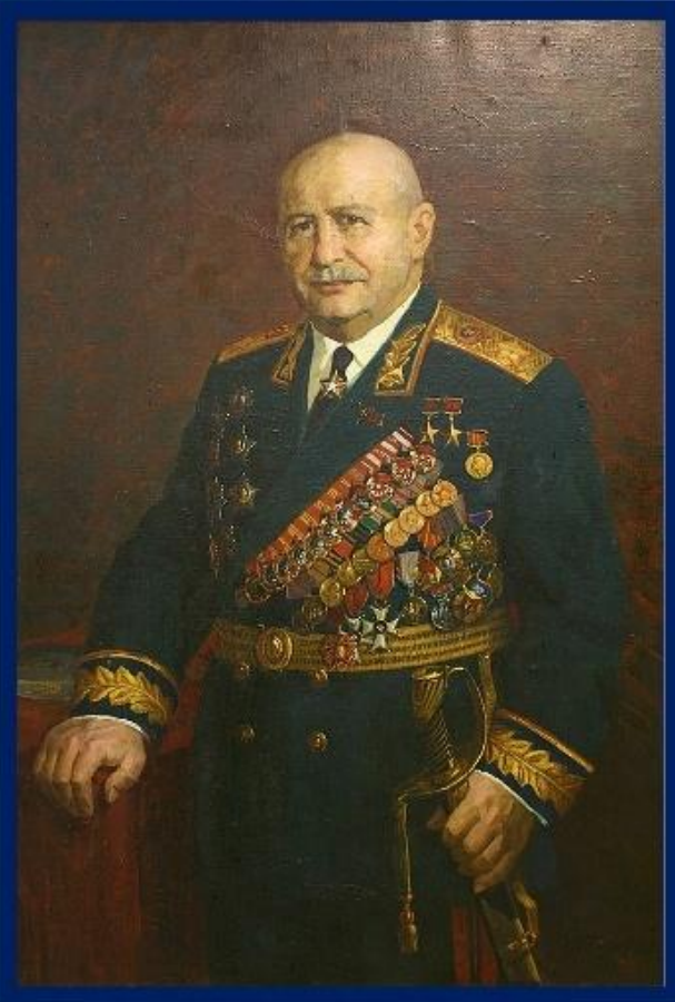
Иван Христофорович Баграмян (1897-1982)

Войска под командованием маршала Ивана Христофоровича Баграмяна участвовали активно в разгроме немецко-фашистских войск на Курской дуге, в Белорусской, Прибалтийской, Восточно-Прусской и других операциях и в овладении крепостью Кенигсберг.