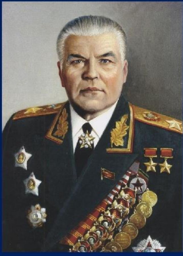
Малиновский Родион Яковлевич (1898-1967)

Характерной чертой настоящего полководца является неординарность замысла и действий, уход от шаблона, военная хитрость, в чем преуспел великий полководец А. В. Суворов. В годы Великой Отечественной войны этими качествами отличался Малиновский Родион Яковлевич. На протяжении почти всей войны примечательной особенностью его полководческого таланта было то, что он в замысел каждой операции закладывал какой-либо неожиданный для противника способ действий, умел целой системой хорошо продуманных мер ввести противника в заблуждение.