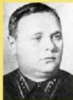
Мерецков Кирилл Афанасьевич (1897-1968)