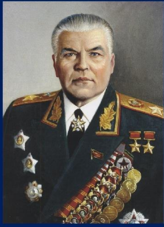
Малиновский Родион Яковлевич (1898-1967)

Характерной чертой настоящего полководца является неординарность замысла и действий, уход от шаблона, военная хитрость, в чем преуспел великий полководец А. В. Суворов. В годы Великой Отечественной войны этими качествами отличался Малиновский Родион Яковлевич. На протяжении почти всей войны примечательной особенностью его полководческого таланта было то, что он в замысел каждой операции закладывал какой-либо неожиданный для противника способ действий, умел целой системой хорошо продуманных мер ввести противника в заблуждение.