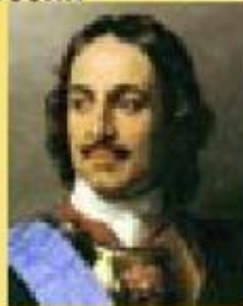
Пётр Первый Великий (1672-1725)