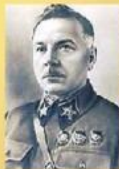
Ворошилов Климент Ефремович (1881-1969)