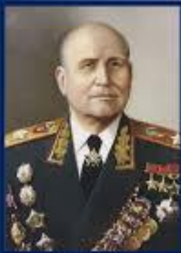
Конева Иван Степанович (1897-1973)

Важной чертой полководческого таланта является интуиция, позволяющая добиться внезапности удара. Этим редким качеством обладал Конева Иван Степанович. Его полководческий талант наиболее убедительно и ярко проявился в наступательных операциях, в ходе которых было одержано много блестящих побед. При этом он всегда стремился не ввязываться в затяжные бои в больших городах и обходными маневрами вынуждал противника покинуть город. Это позволяло ему уменьшить потери своих войск, не допустить больших разрушений и жертв среди мирного населения.