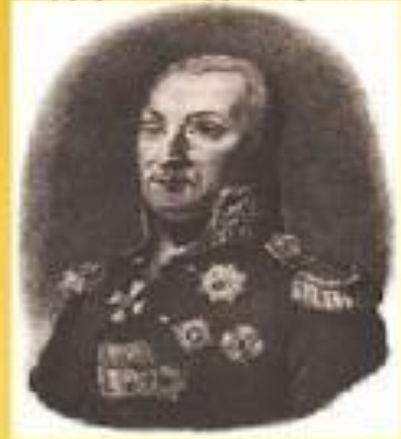
Кутузов Михаил Илларионович (1745—1813)