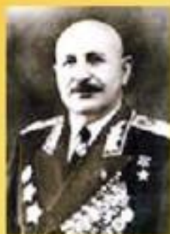
Баграмян Иван Христофорович (1897-1982)