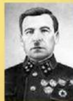
Говоров Леонид Александрович (1897-1955)