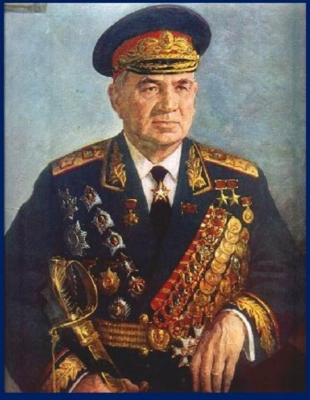
Василий Иванович Чуйкова (1900-1982)

В годы Великой Отечественной войны Василий Иванович Чуйков командовал 62-й (8-й гвардейской) армией, которая навечно вписана в летопись героической обороны города Сталинграда. Командарм Чуйков ввел в войска новую тактику- тактику ближнего боя. В Берлине В.И.Чуйкова называли: «Генерал - Штурм». После победы в Сталинграде были удачно проведены операции: Запорожье, форсирование Днепра, Никополь, Одесса, Люблин, форсирование Вислы, Познаньская цитадель, Кюстринская крепость, Берлинская и др.