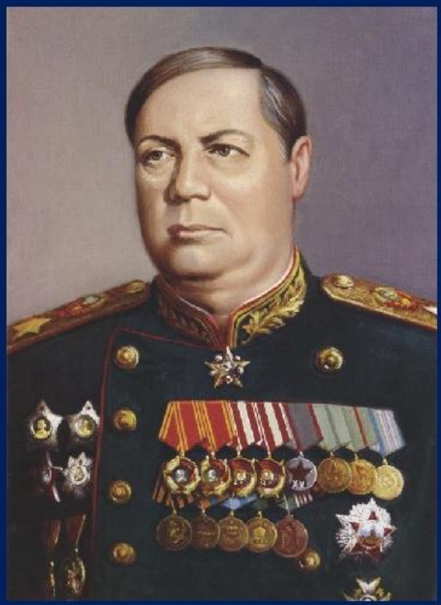
Толбухин Федор Иванович (1894-1949)

В памяти сослуживцев и подчиненных запечатлелись такие замечательные черты этого доблестного сына России, как верность долгу и беспредельная преданность Родине, добросовестность и трудолюбие. Для успешного руководства войсками немаловажное значение имели его большой опыт оперативной работы, глубокое понимание ее сущности и важности. По умению опереться на свой штаб, максимально использовать его возможности вряд ли можно сыскать равного Федору Ивановичу среди командующих фронтами Великой Отечественной войны. Демократизм начальника в повседневной жизни, при выработке решения на операцию сочетался с его твердостью и настойчивостью при достижении поставленной цели.