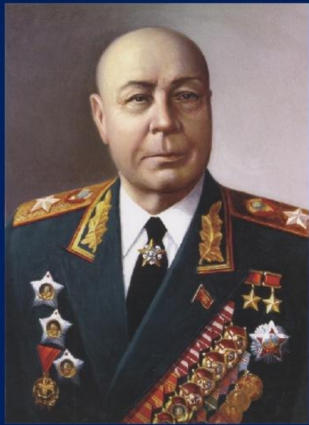
Тимошенко Семён Константинович (1895-1970)

Испытав на себе весь гнев Сталина в первые дни кошмарных провалов на фронтах, Тимошенко Семён Константинович попросил направить его на наиболее опасный участок. Впоследствии маршал командовал стратегическими направлениями и фронтами. Под его командованием шли тяжелые оборонительные бои на территории Белоруссии в июле - августе 1941 года. С его именем связаны героическая оборона Могилева и Гомеля, контрудары под Витебском и Бобруйском. Под руководством Тимошенко развернулось самое большое и упорное сражение первых месяцев войны - Смоленское. В июле 1941 г. войска Западного направления под командованием маршала Тимошенко остановили наступление группы армий "Центр" ..