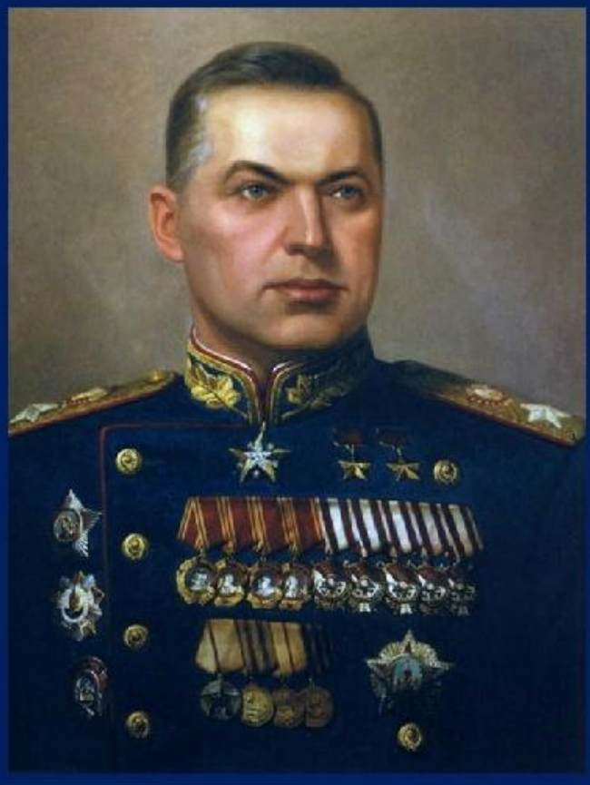
Константин Константинович Рокоссовский (1896-1968)

Черта полководческого таланта Константина Константиновича Рокоссовского — способность к разумному риску, что являлось неоценимым качеством советских полководцев. Одна из замечательных страниц полководческой деятельности К. К. Рокоссовского — Белорусская операция, в которой он командовал войсками 1-го Белорусского фронта. Дважды Герой Советского Союза, Маршал Советского Союза