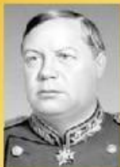
Толбухин Фёдор Иванович (1894-1949)