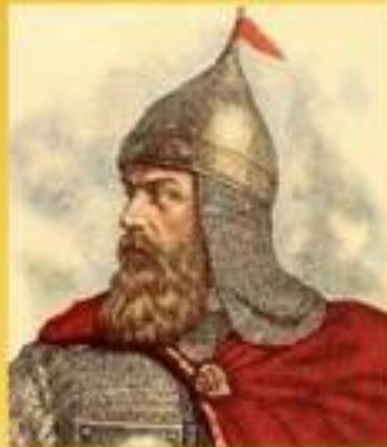
АЛЕКСАНДР НЕВСКИЙ , св. благоверный великий князь (1220-1263). Выдающийся русский полководец