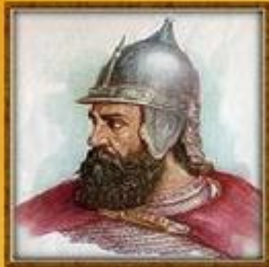
1350-1389 Дмитрий Донской Русский полководец. Великий князь московский (с 1359 года) и владимирский