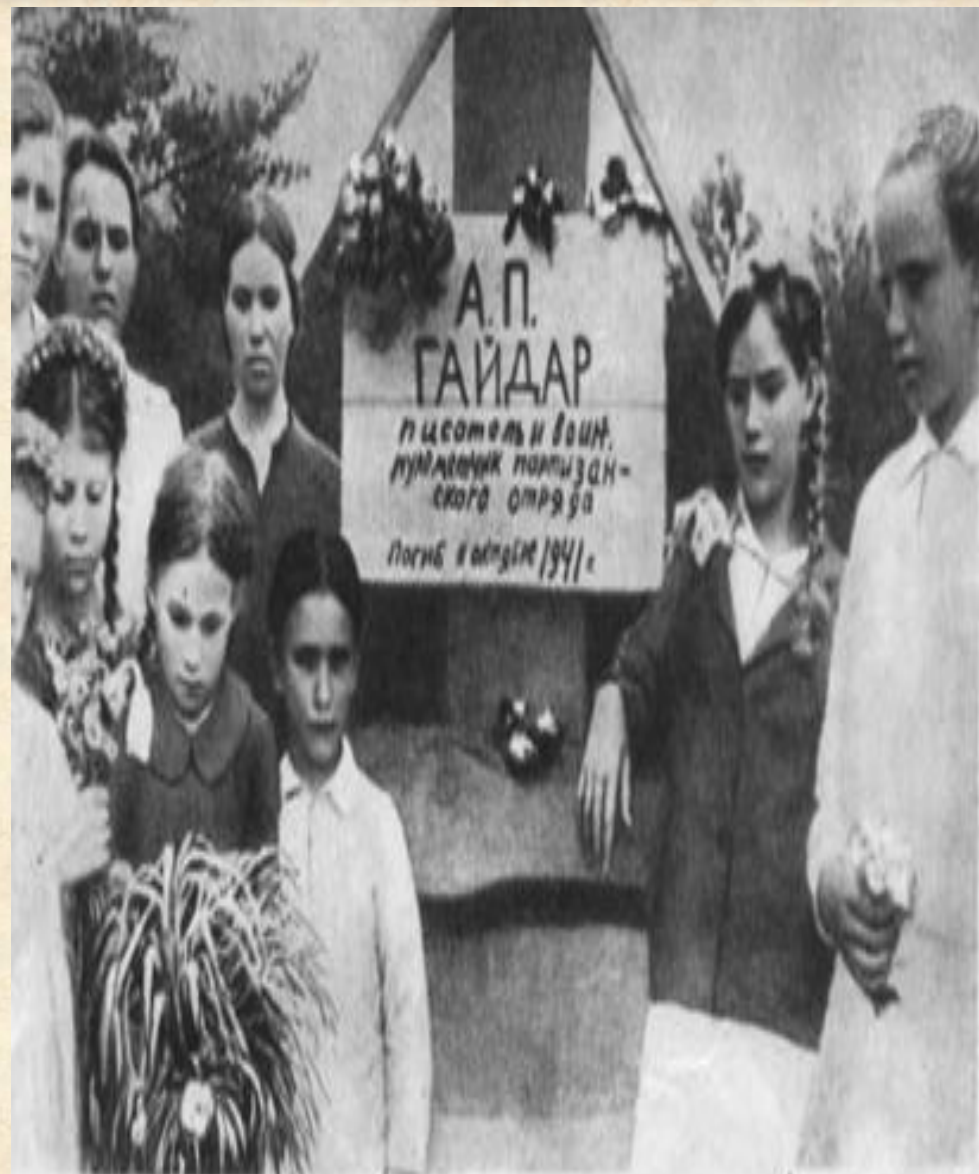
Место, где первоначально был похоронен А. П. Гайдар.

Он погиб, выручая товарищей. Это случилось 26 октября 1941 в бою под деревней Леплява. Маленькая группа партизан, возвращаясь с боевого задания, наткнулась на засаду. Похоронен Гайдар на высоком берегу Днепра в г. Каневе.