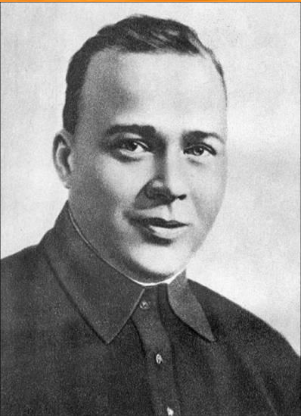
Аркадий Петрович Гайдар (Голиков) 1904 – 1941