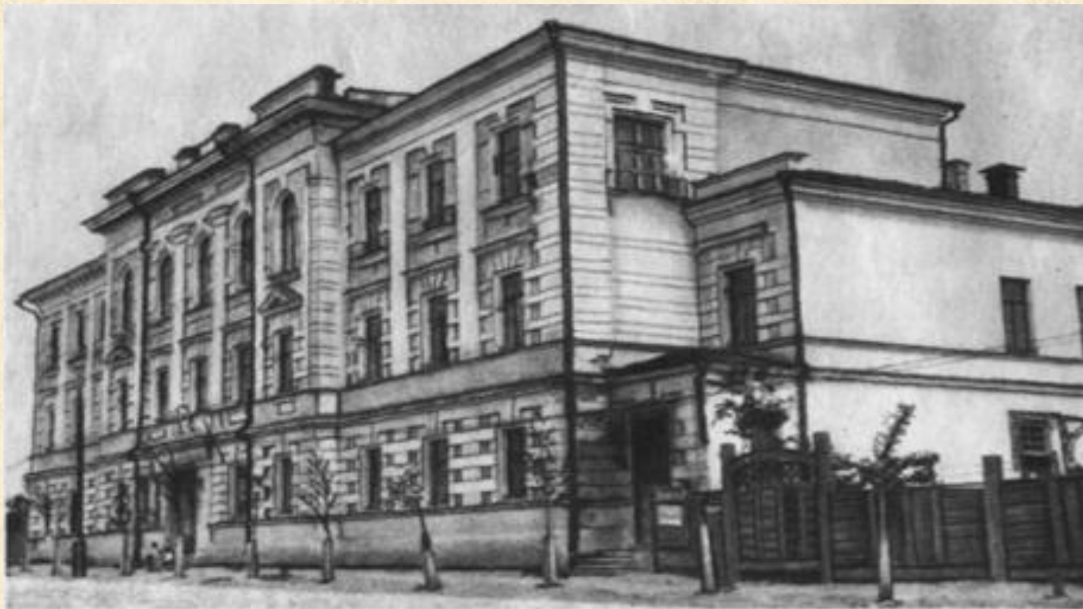
Здание Арзамасского училища, где учился Аркадий Голиков с 1914 по 1918 год.

Родные определили Аркадия в Арзамасское училище. Но еще не начались занятия в классах, как разразилась война. Отца взяли в солдаты. Для семьи Голиковых началась суровая жизнь.