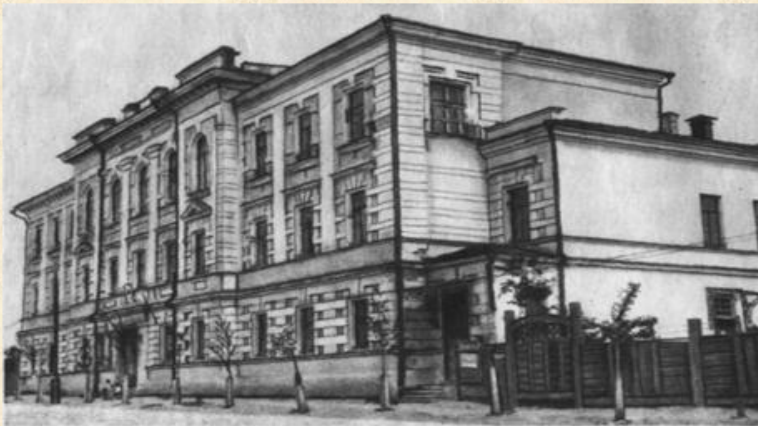
Здание Арзамасского училища, где учился Аркадий Голиков с 1914 по 1918 год.

Родные определили Аркадия в Арзамасское училище. Но еще не начались занятия в классах, как разразилась война. Отца взяли в солдаты. Для семьи Голиковых началась суровая жизнь.