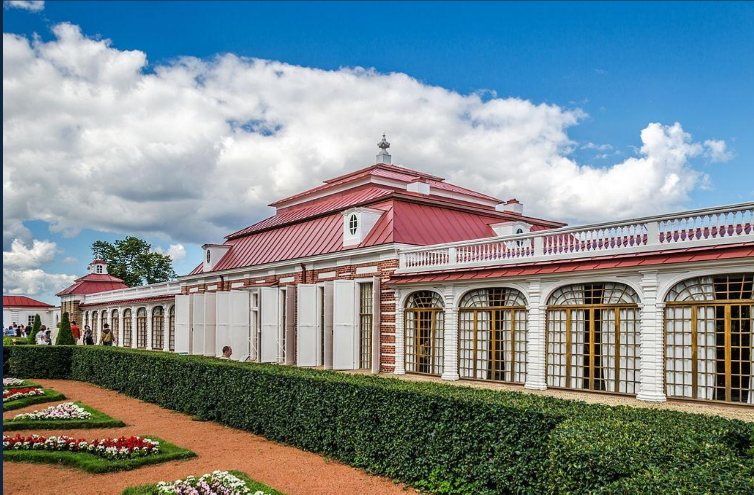
Андреас Шлютер, Иоганн Фридрих Браунштейн, Жан-Батист Леблон и Николо Микетти. Дворец Монплеизр. 1714-1723. Петергоф