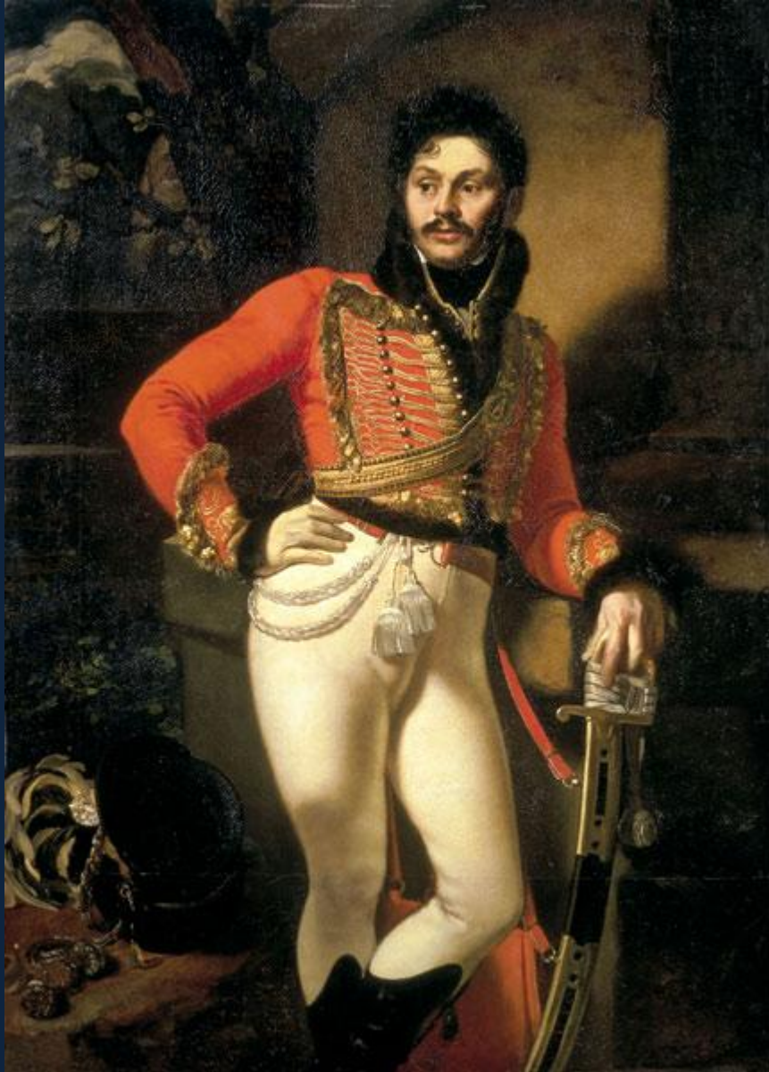
О.А.Кипренский. Портрет лейб-гусарского полковника Евграфа Владимировича Давыдова. 1809. Х.,м. 162 x 116 см. ГРМ, СПб