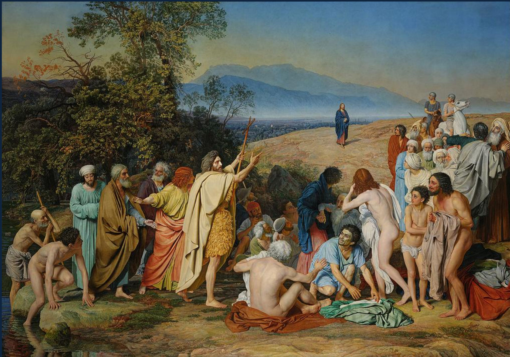
Александр Иванов. Явление Христа народу. 1837—1857. Х., м. 540 × 750 см ГТГ, Москва