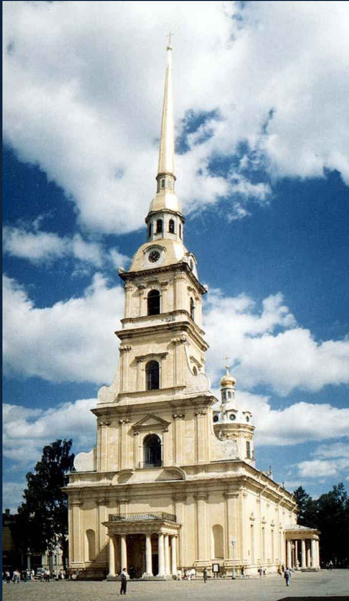
Доменико Трезини. Собор Петропавловской крепости. 1712-1733. СПб