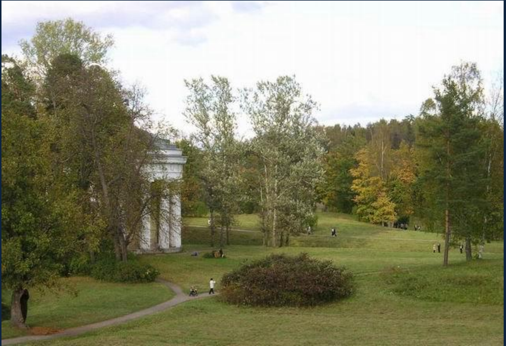
Павловский парк. Долина реки Славянки. Павильон Дружбы (арх. Ч. Камерон, 1781-1784).