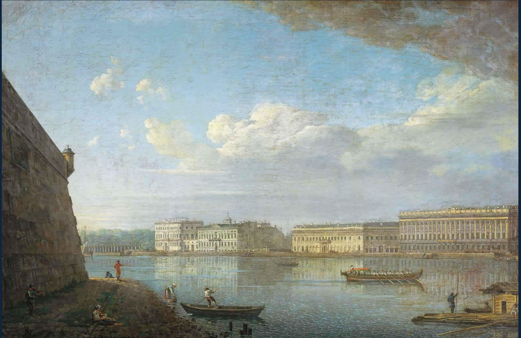
Ф. Алексеев. Вид Дворцовой набережной от Петропавловской крепости. 1794. Х., м. 70 x 108. ГТГ, Москва