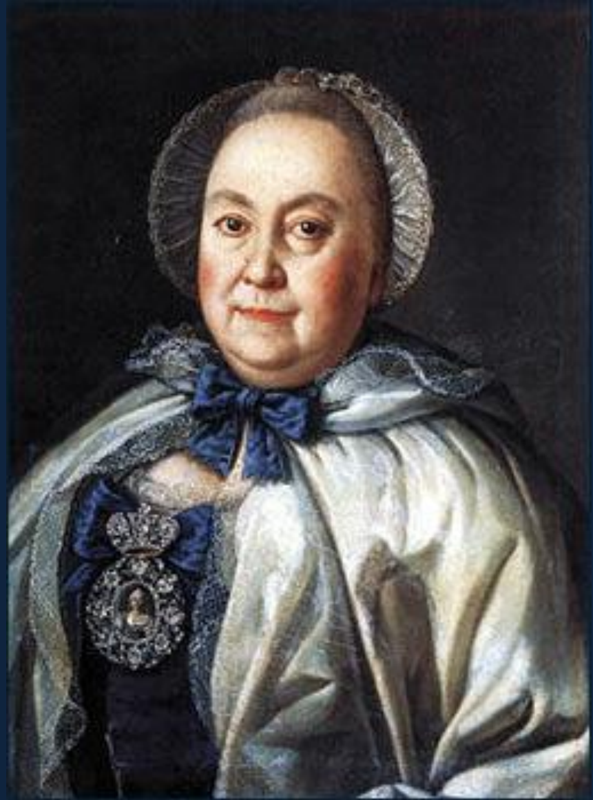
Алексей Антропов. Портрет графини М.А. Румянцевой. 1764. Х., м. 62,5 x 48. 1764. ГРМ, СПб