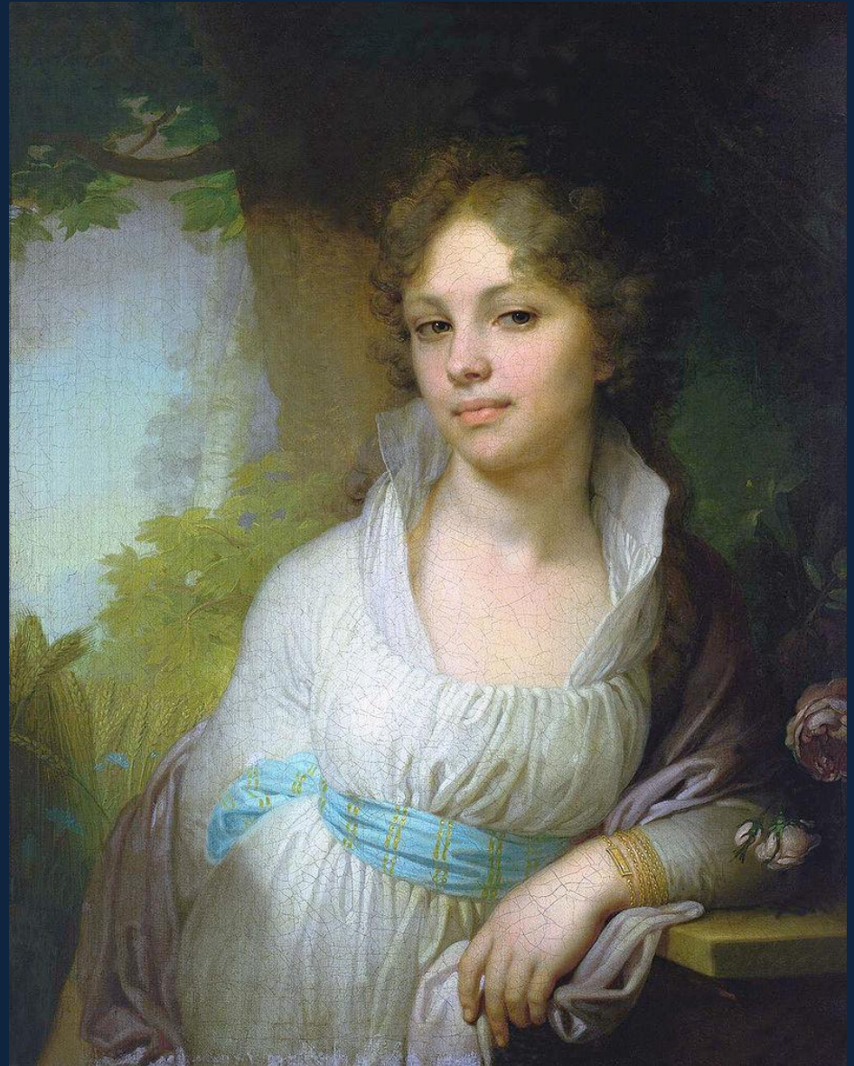
Вл.Боровиковский. Портрет Марии Лопухиной. 1797. Х., м. 72 × 53,5 см ГТГ, Москва