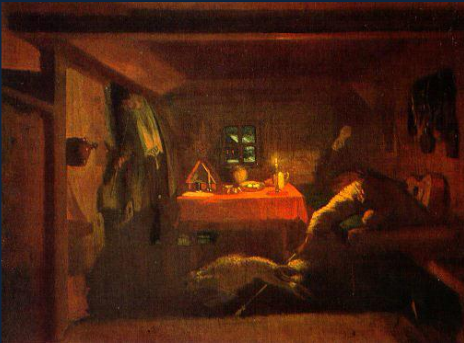
Павел Федотов. Анкор, еще анкор! 1851-1852. Х.,м. 34,5 × 46,4 см ГТГ, Москва