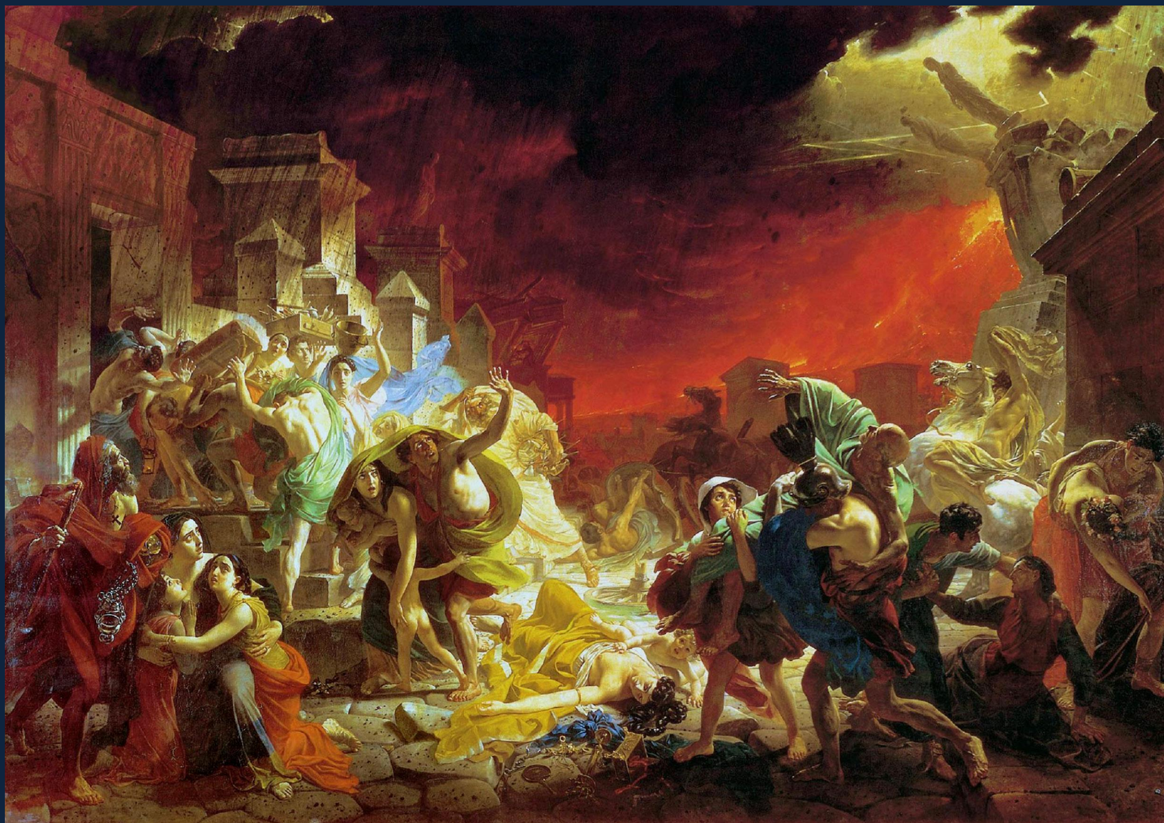
Карл Брюллов. Последний день Помпеи. 1830—1833. Х., м. 465,5 × 651 см ГРМ, СПб