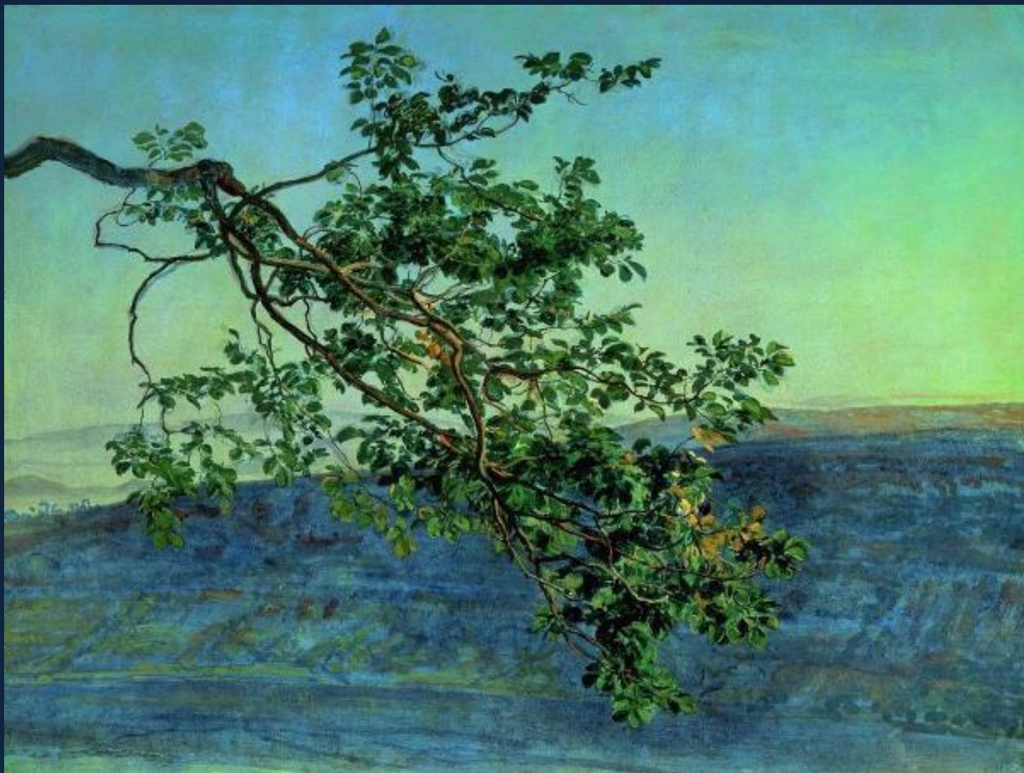
Александр Иванов. Ветка. Конец 1840-х — начало 1850-х. Этюд для картины "Явление Христа народу". Бумага на холсте, масло. 46,5 x 62,4. ГТГ.