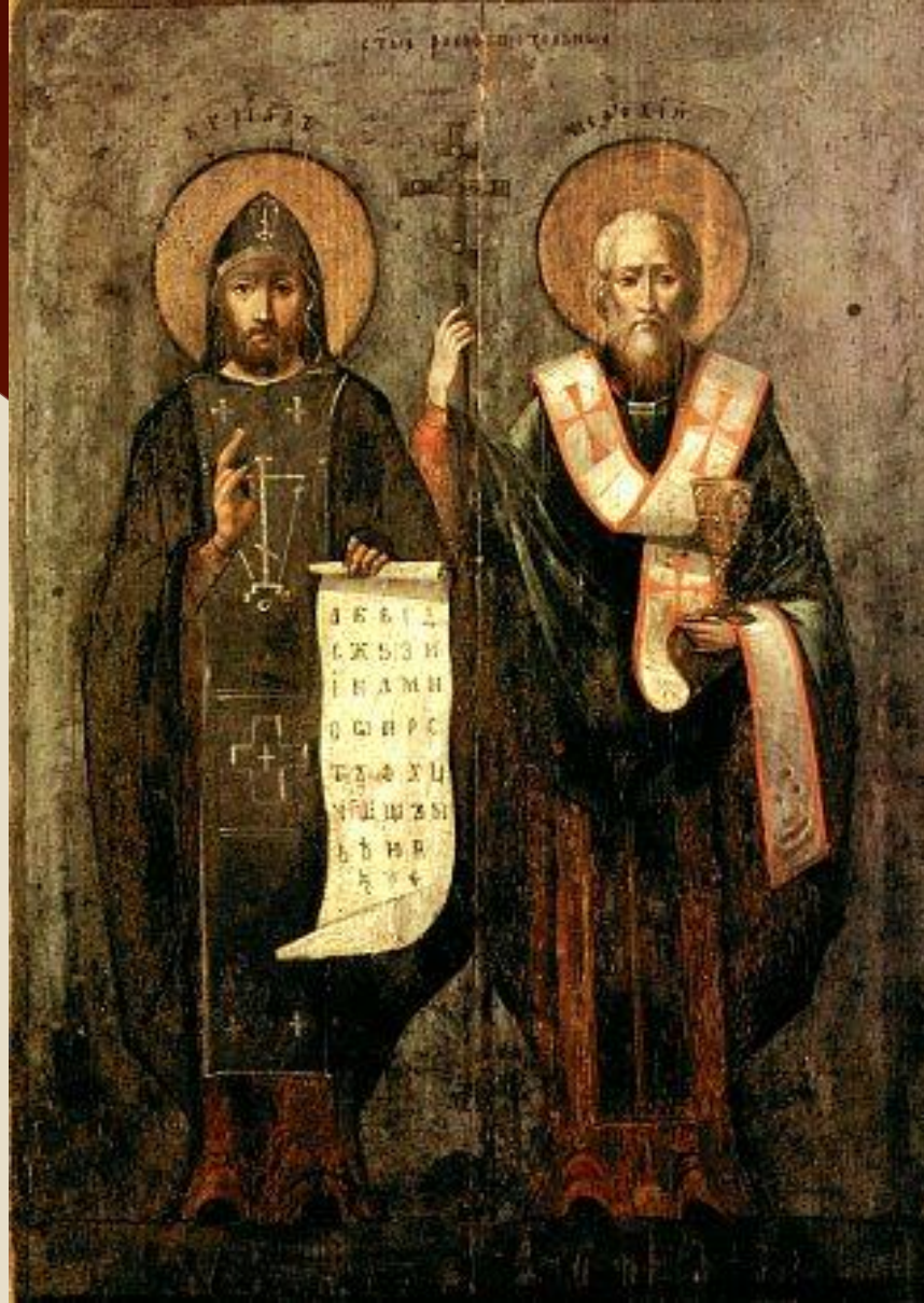
Равноапостольные Мефодий и Кирилл