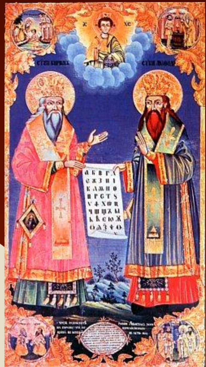
Святые Кирилл и Мефодий