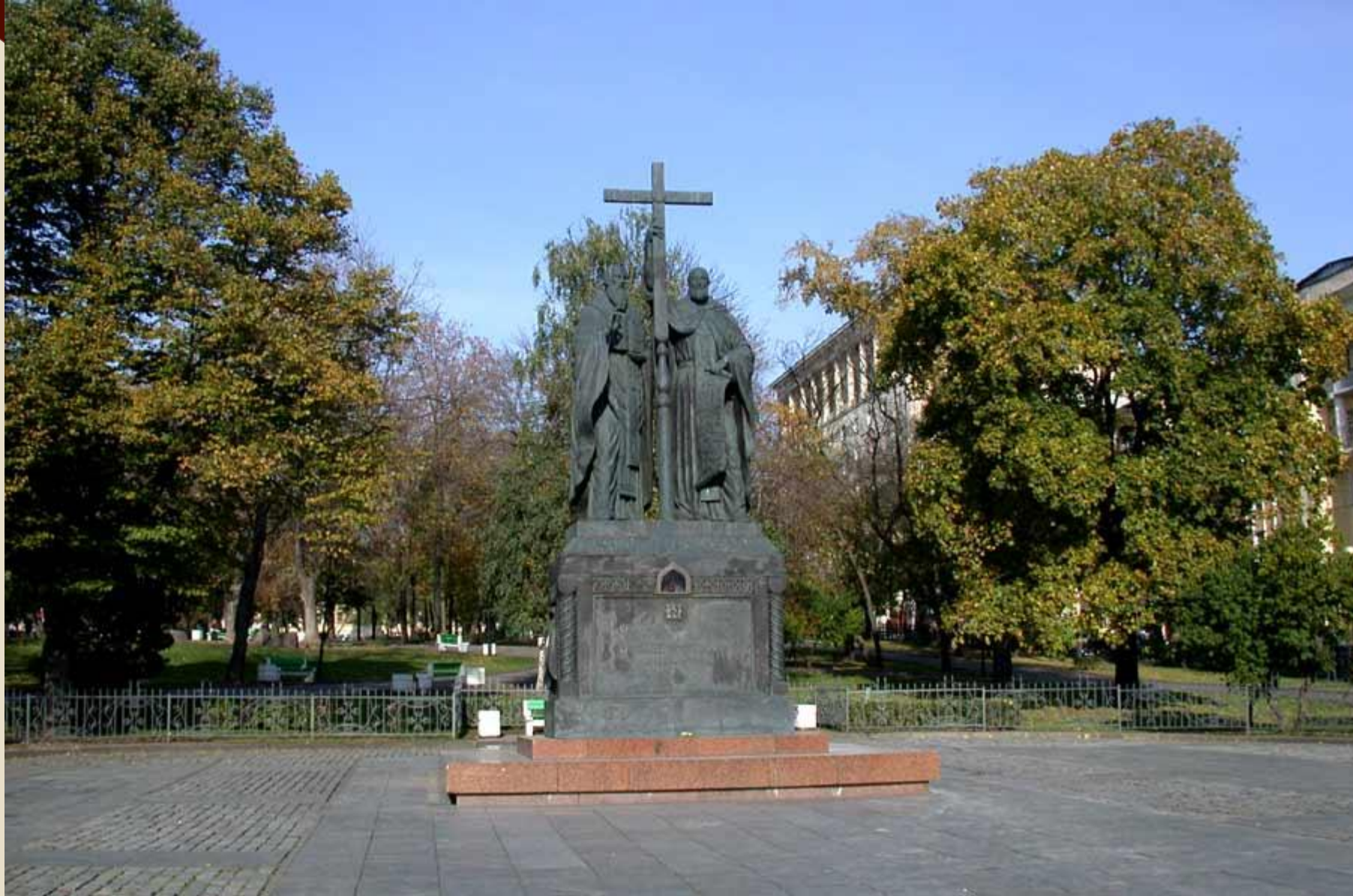
Памятник Кириллу и Мефодию на Славянской площади в Москве. 1992 год