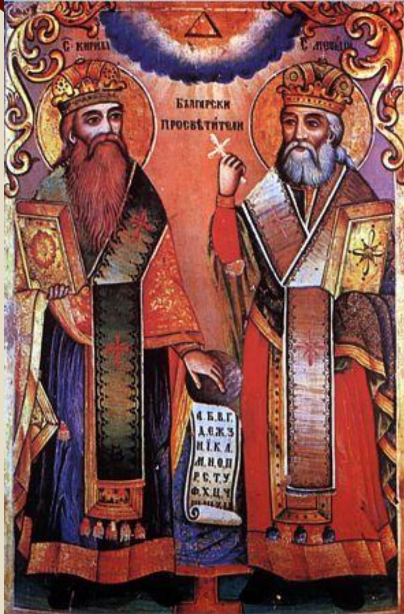
Святители Кирилл и Мефодий