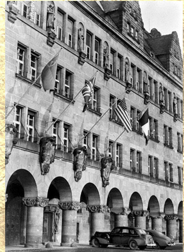
Здание Дворца юстиции в Нюрнберге, где проходил Нюрнбергский процесс