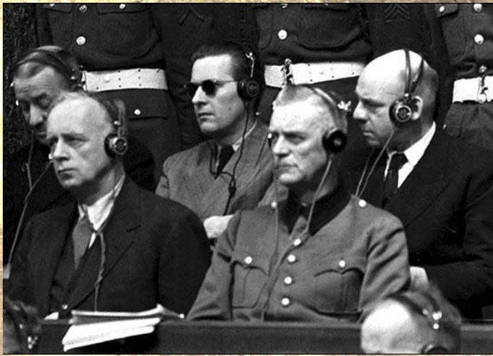
И. фон Риббентрон, Б. фон Ширах, В. Кейтель, Ф. Заукель на скамье подсудимых