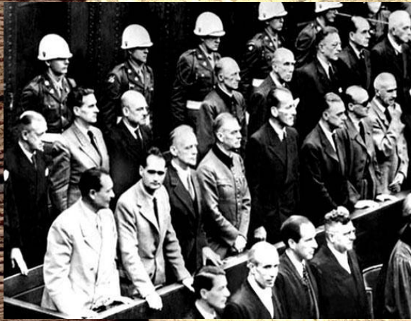
Нацистские преступники на скамье подсудимых

Международный военный трибунал, заседавший почти год, проделал колоссальную работу. В ходе процесса: