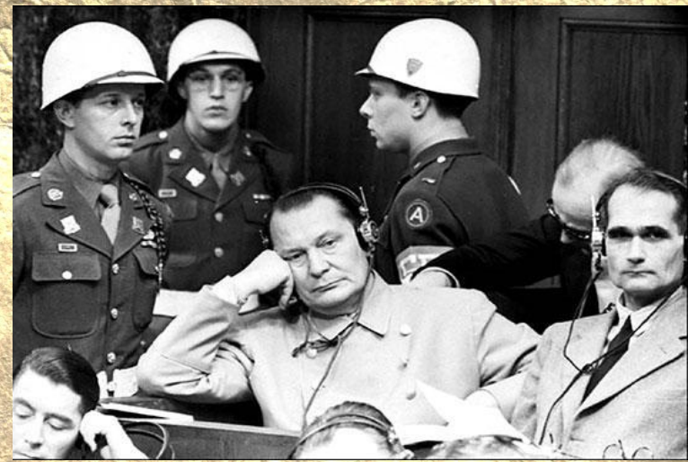
Г. Геринг и Р. Гесс на скамье подсудимых

Всем подсудимым уже 18 октября 1945 г., то есть более чем за месяц до начала судебного разбирательства было вручено Обвинительное заключение с тем, чтобы они могли подготовиться к защите. Таким образом, основные права обвиняемых были соблюдены. Мировая печать, комментируя Обвинительное заключение, отмечала, что этот документ составлен от имени «оскорбленной совести человечества», что это не «акт мести, а торжество справедливости», перед судом предстанут не только главари нацистской Германии, но и вся система фашизма. Это был в высшей степени справедливый суд народов мира.