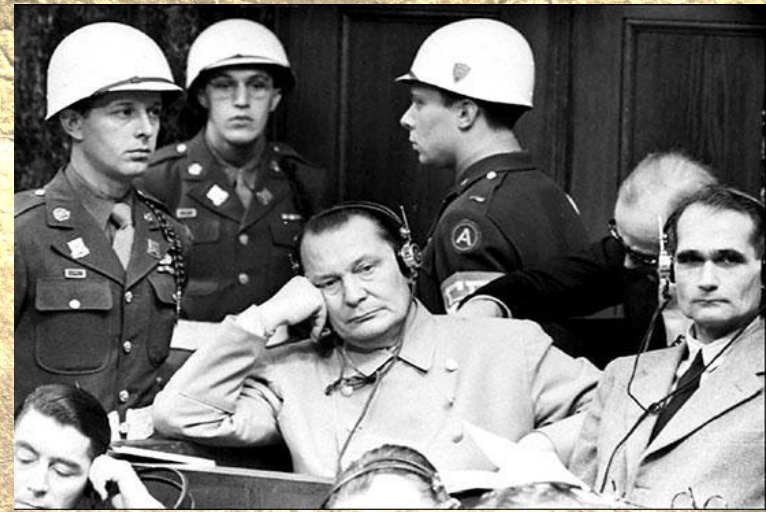
Г. Геринг и Р. Гесс на скамье подсудимых

Всем подсудимым уже 18 октября 1945 г., то есть более чем за месяц до начала судебного разбирательства было вручено Обвинительное заключение с тем, чтобы они могли подготовиться к защите. Таким образом, основные права обвиняемых были соблюдены. Мировая печать, комментируя Обвинительное заключение, отмечала, что этот документ составлен от имени «оскорбленной совести человечества», что это не «акт мести, а торжество справедливости», перед судом предстанут не только главари нацистской Германии, но и вся система фашизма. Это был в высшей степени справедливый суд народов мира.